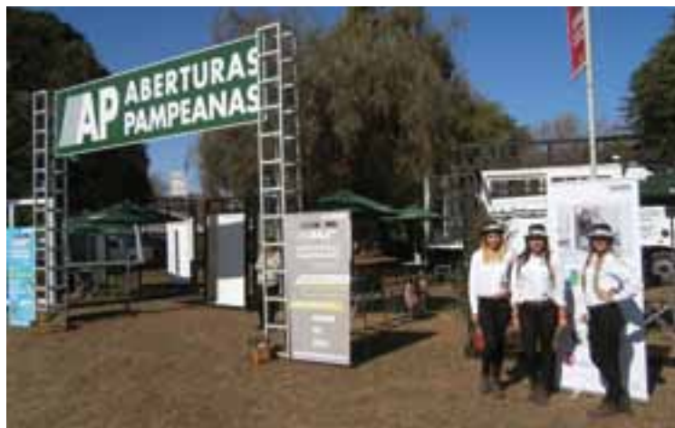
Stand de "Aberturas Pampeanas" con sus simpáticas promotoras.

Señaló que esta muestra es una oportunidad de tomar contacto con productores, industriales y proveedores de servicios, "con quienes compartimos diversas actividades y nos une un diálogo franco. Sabemos lo que representan estos sectores en el potencial productivo, así como lo que significan las pequeñas y medianas empresas agropecuarias y nuestras PyMEs en la contribución a preservar el tejido social de las comunidades rurales".