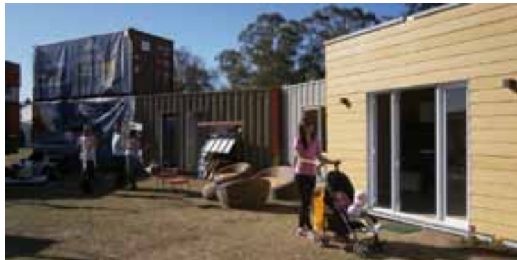
"Aisplac" expuso sus Módulos Habitables, con multiplicidad de funciones.

El fin de semana del 5 y 6 de septiembre, se realizó la 83ª Exposición Rural de General Pico, una de las más grandes de la Provincia. El ministro de la Producción, Pedro Goyeneche, participó de la apertura oficial, donde felicitó el enfoque de este año, elaborado bajo el lema "Conocer lo nuestro", con una propuesta para acercar el campo a la ciudad, afirmando que no se defiende lo que no se conoce.