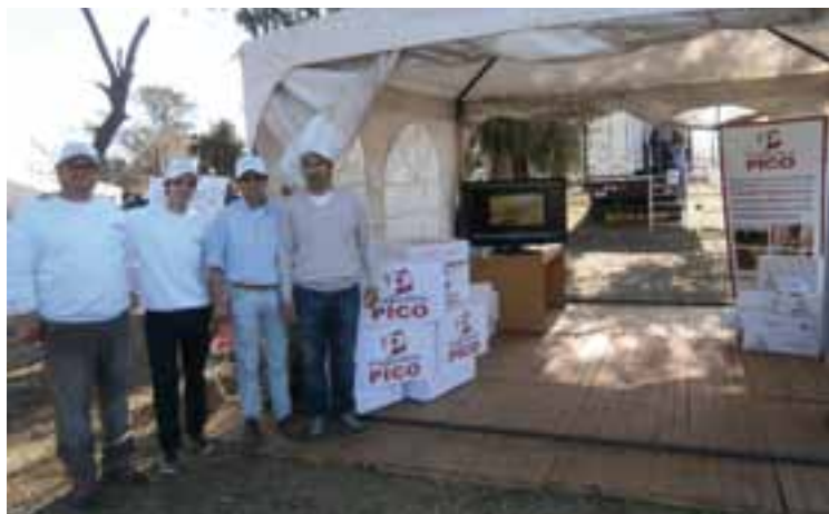
"Frigorífico Pico" presentó en su stand con camión de transporte en frío y todo.