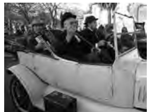
Una caravana de autos Ford modelo "T" que llegaron desde distintos puntos del país, acompañaron la gran fiesta alvearense del "Gobron-Brillié".

Luego que el Gobron fuera depositado en el espacio de exposición realizado por el municipio, los festejos culminaron con una gran cena en el Alvear FBC, a beneficio de la cooperadora del Hospital local.