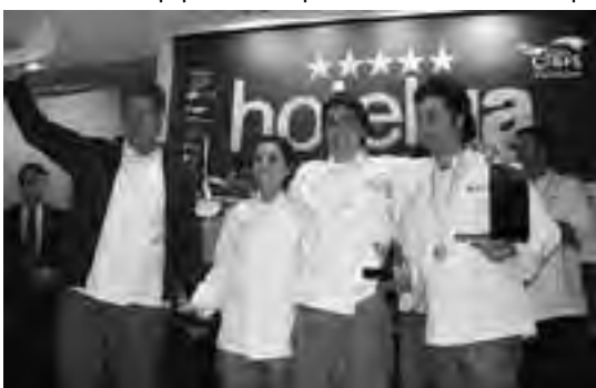
Los ganadores de la gran final del Torneo Nacional de Chefs 2011 "Buscando el Menú Argentino".

La Secretaría de Turismo, felicita a los participantes que representaron en esta edición a la Provincia y agradece el acompañamiento permanente en pos del desarrollo turístico de La Pampa.