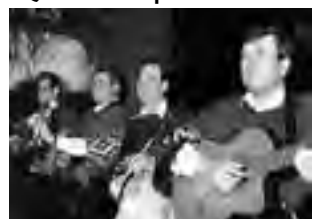
-Dom. 11 Almuerzo y Show en vivo con "Los Trovadores". Picada regional y asado al asador. $ 75 s/beb. Reservas: 415649