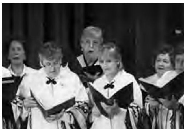
Integrantes de la agrupación coral “Ayuntún”.

Desde hace 9 años, el Coral de La Pampa ha crecido hasta convertirse en el evento cultural más convocante que se desarrolla en el ámbito de nuestra provincia. Con características únicas, promueve la integración de las localidades provinciales a través del intercambio de sus coros, posibilitando la llegada de grupos nacionales y extranjeros a las distintas sedes. En la presente edición, desde el 11 de agosto con el Concierto de Apertura a cargo del Estonian TV Girls Choir, se sucedieron presentaciones corales en toda la provincia, con un fluido intercambio entre las distintas agrupaciones vocales que culminó el pasado sábado 24 de septiembre con el Concierto de Clausura desarrollado en el Aula Magna de la UNLPam.