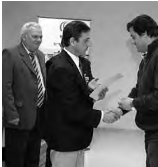
Ambos actos se llevaron a cabo en la sede de Vialidad Nacional de Santa Rosa.

Señaló que las demandas por parte de las municipalidades siguen: "las obras viales siguen al igual que las demandas, en la búsqueda de un futuro laboral que es interesante; la gente, por una baja vegetativa se va reponiendo y los jóvenes son los que tienen que aprovechar estos cursos".