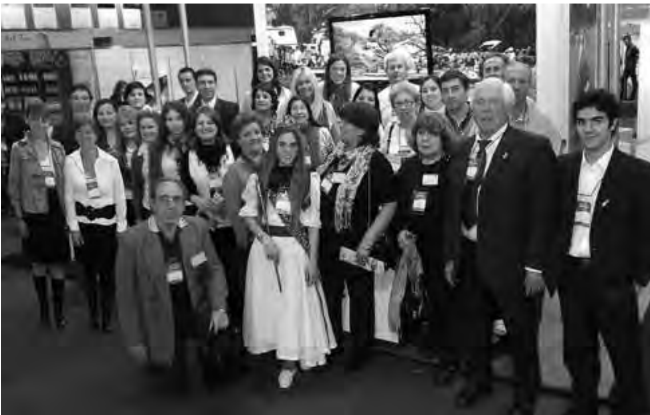
Cabe recordar que esta muestra, que concentra las propuestas turísticas de La Pampa, Neuquén, Río Negro, Chubut, Santa Cruz y Tierra del Fuego, es visitada masivamente tanto por el público en general, como por los profesionales de Buenos Aires, en busca de las novedades que presenta la Patagonia Argentina. El stand del Gobierno de La Pampa, como es habitual, tuvo un importante acompañamiento de autoridades nacionales, provinciales y municipales, representantes del sector privado, asociaciones y cámaras de turismo, actividades que fueron coordinadas por la Secretaría de Turismo provincial.