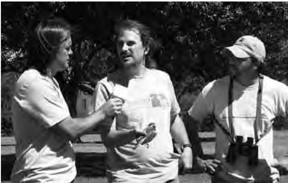
Los Guías de la Reserva Provincial Parque Luro hablaron sobre los atractivos del lugar y las actividades que se desarrollan, mostrando además las tareas de investigación sobre el comportamiento de aves rapaces.

Al respecto de esto, llevaron adelante con aves, en vivo, la medición, el anillado y la toma de muestra de sangre, para luego liberar el