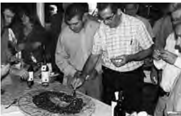
Hoteleros, gastronómicos y dirigentes del ámbito turístico participaron del evento que tuvo amplia convocatoria y muy buenos comentarios.

productos. Es un camino que hemos iniciado pero tiene un potencial