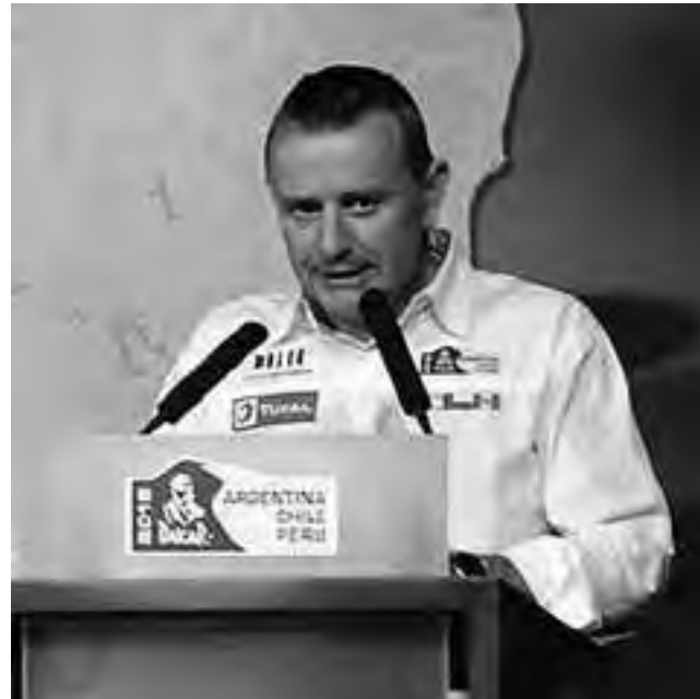
Entre los tantos proyectos que maneja la organización del Dakar en suelo suramericano, Lavigne confió que figura un raid que una "Río-Buenos Aires o un Río-Lima, pasando por Paraguay, Argentina Brasil, Chile, y Perú", aunque aclaró que por ahora Brasil no será de la partida.

"Hay muchos proyectos en suelo suramericano. Claro que siempre