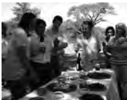
Con integrantes de "Sabores de La Pampa".

Se trata de un programa rodante que, con base en Buenos Aires, da la vuelta por Argentina abriendo cada día una ventana a sus historias, sus costumbres, sus paisajes y su gente. En ese encuentro con cada una de las provincias el programa apunta a conocer, entender y compartir la identidad de los argentinos, más allá de las similitudes y diferencias que nos caracterizan según el lugar donde vivamos. El móvil recorre el país con distintos informes y en esta oportunidad eligió la provincia de La Pampa.