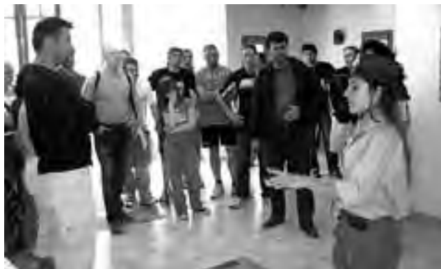
La Estancia Histórica "La Malvina" en el Parque Don Tomás, está abierta de lun. a vie. de 8 a 20 hs; sáb, dom. y feriados de 10 a 12 y 16:30 a 20:30 hs. Para visitas guiadas llamar al: Tel. 43-6555.