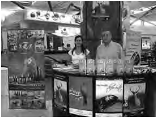
Estarán presentes también la Secretaría de Turismo de La Pampa y la Asociación Empresaria Hotelera Gastronómica provincial.