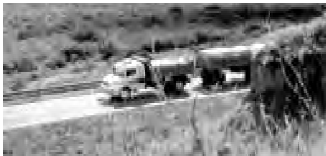
La rutina laboral en sí, exige soportar un ritmo de vida extenuante, que implica estar varias horas seguidas manejando bajo climas adversos o, en muchos casos, soportando problemas físicos por el continuo trajinar.

La actividad del sector del Transporte tiene múltiples facetas, pero quizá la más atractiva siempre ha sido la del clásico «Camionero», ese paladín de las rutas del que el comun de la gente cree saber mucho y en realidad es poco lo que se conoce.