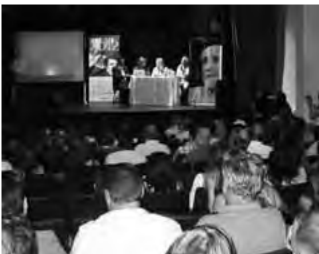
Una importante concurrencia marcó el interés sobre el tema.