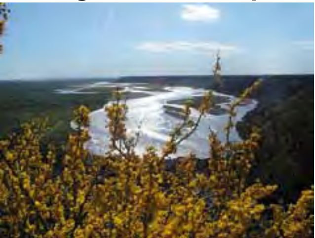
El Río Colorado, límite sur de nuestra Provincia, baña la ribera pampeana a lo largo de 500 km, permitiendo desarrollar potencialmente, 85.000 hectáreas bajo riego.

La semana pasada recordamos en estas páginas (ver REGION® N° 1.047), el 50° Aniversario del Ente Provincial del Río Colorado, tras su creación el 28 de junio de 1962.