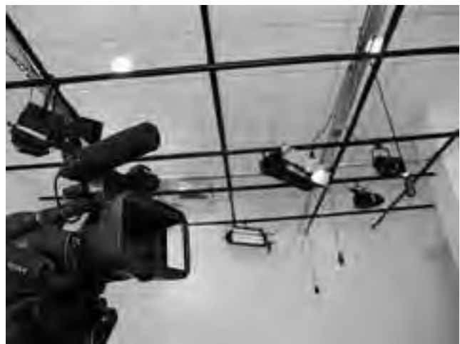
Cámara Sony y equipo de iluminación del Estudio de TV Digital de la CPE.

■ VENDO Mesa roble moro 1,20 x 0,80, c/ 4 sillas armazón metal negro, asiento y respaldo plástico gris, p/oficina hogar. Excelente calidad y estado $ 650. Cel. 15625929