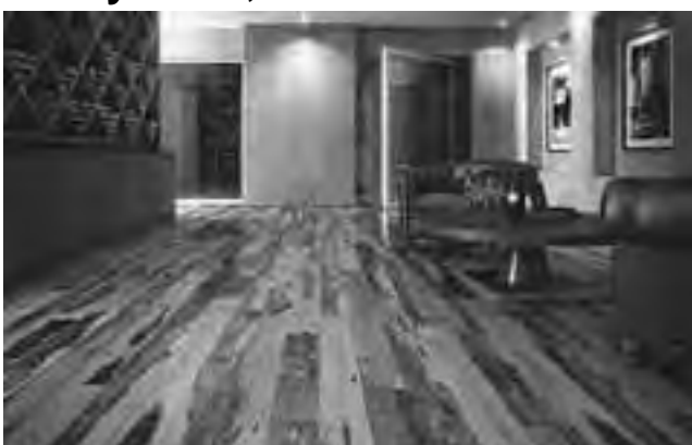
Bodega realizada con Guayubira Prefinished que tiene la ventaja de ser fácil de instalar sin la necesidad de lijar y barnizar en la obra.

En la vertiginosa vida actual se valora cada vez más la experiencia auténtica de lo nativo, el uso de la madera en su estado más genuino, los pisos, muebles, revestimientos y objetos con carácter que den vida a espacios con personalidad propia, aportando calidez y emocionalidad. Los nuevos pisos y revestimientos de madera Guayubira. Los mismos conjugan las cualidades técnicas de las maderas del bosque misionero argentino, resaltando sus exóticas vetas, con tratamientos artesanales.