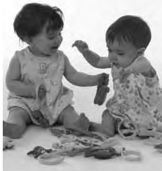
Cuando el bebé intenta y va logrando sentarse, su relación con el mundo que lo rodea, es otra. Ejercerá un dominio distinto frente a los objetos, no sólo puede alcanzar aquel juguete que mira, sino además alcanzar lo que necesita, llevarlo a la boca, chuparlo, morderlo y cuando el interés decae, abandonarlo.

Cercano a los 4 meses de vida sucede algo muy importante, los