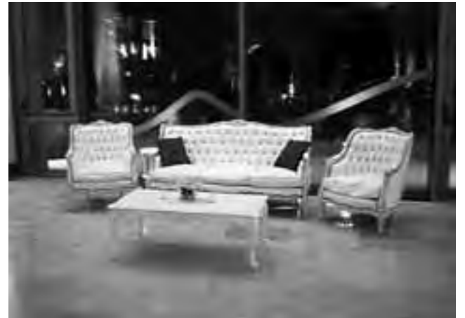
Juego estilo Luis XV con capitoné.

Cuando uno va a encarar un trabajo de decoración debe saber que se pueden combinar estilos, solo hay que saber usarlos con criterio. No todo está permitido y siempre deben primar el buen gusto y la funcionalidad.