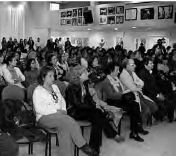
Antes de casi todos los municipios de la Provincia, se leyó la salutación enviada por la presidenta de la Provincia, Alicia Kirchner. La realización de estos encuentros dan lugar al debate, a la formación y al diálogo, una temática que nos involucra y nos compromete a la acción.

como como sus derechos, responsabilidades y oportunidades. El medio para lograrla es la equidad de género , la justicia en el tratamiento a mujeres y hombres de acuerdo a sus respectivas necesidades, lo que implica la posibilidad de tratamientos diferenciales para corregir desigualdades de partida. La equidad de género, en relación a la política pública, está asociada íntimamente a la consecución de los derechos humanos.