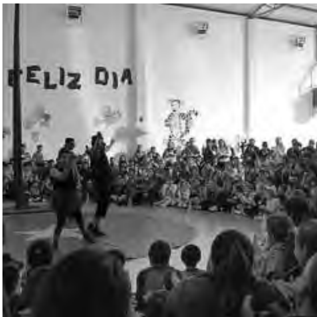
Festejos en Abramo el pasado sábado 4 de agosto.