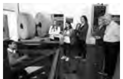
Nuestra visita a la aceitera "Yancanelo"