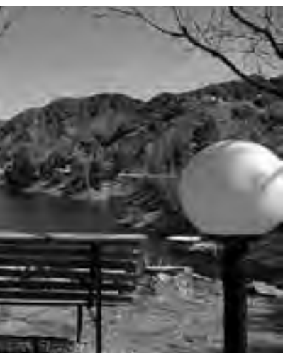
de Pesca y Náutica, un lugar digno de conocer.