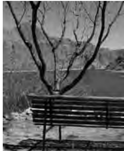
Mirador y lago Los Reyunos, sede del Club de Pesca y Náutica Los Reyunos

Esta empresa aceitera de la familia Zingaretti, ofrece una in-