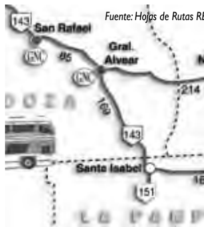
El trayecto más simple desde Santa Rosa es por Villa 25 de Mayo. Los Reyunos está a 35 km del centro de San Rafael.