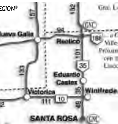
Winfreda, Victoria, Santa Isabel, General Alvear y San Rafael, en el Distrito mendocino Villa 25 de Mayo.

interesante guiada gratuita de unos 20 minutos, en distintos horarios, todos los días. En la misma se aprecia el proceso antiguo y el moderno para la extracción del aceite de oliva y su posterior tratamiento. Se pueden ver antiguas maquinarias y hasta degustar la producción. La firma destaca su producto Aceite Extra Virgen realizado con el método Sinolea, que permite una de las mejores formas de extracción del aceite por goteo natural en frío.