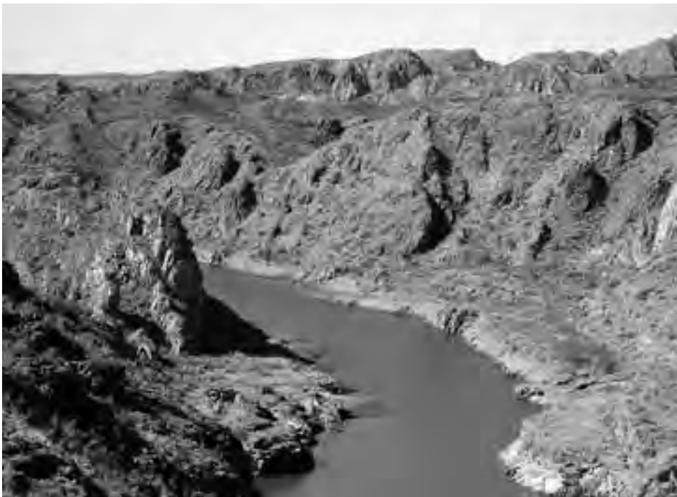
Río Diamante, que da origen al Dique Los Reyunos, aguas abajo de la presa. Belleza incomparable.

En su recorrido, se destaca la presencia del Dique "Los Reyunos", a 134 msnm, un mirador excepcional que realza la belleza geográfica de esta zona y que en su costa -11 km. hacia abajo-, expone lugares increíbles, con buen servicio, como es el caso del Club de Náutica y Pesca que se encuentra enclavado en el Cañón del Diamante a orillas del Lago Los Reyunos. Un lugar deslumbrante donde el pequeño poblado se desarrolló respetando la naturaleza, sin alterar el equilibrio ecológico. El circuito mencionado está conformado por el Dique Los Reyunos, La Presa El Tigre, el Dique Galileo Vitale y la Villa 25 de Mayo, parajes todos de gran belleza que