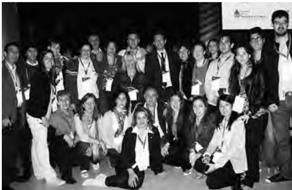
La delegación pampeana completa que viajó a la provincia de Chaco para participar del Segundo Encuentro Federal de Desarrollo Local, ¿Turismo Futuro o Futuro del Turismo?. También la SecTur participó de la Asamblea del CFT (ver aparte).

Parte relevante del Segundo Encuentro también fue un panel de especialistas que abordó el rol de las redes sociales en turismo. Finalmente, el Ministerio de Turismo de la Nación y el CFT realizaron exposiciones de sus estrategias para potenciar el turismo como instrumento central del desarrollo argentino.