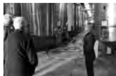
de bodegas “Casa Bianchi” en San Rafael.