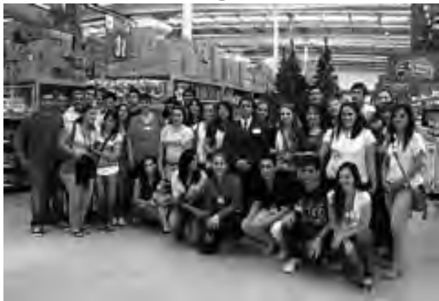
Parte del plantel del personal en la noche inaugural.

La marca supermercadista “Changomas” inauguró una nueva sucursal en Santa Rosa, con una inversión de más de 30 millones de pesos, que generará, según la empresa, 63 puestos de trabajo directos.