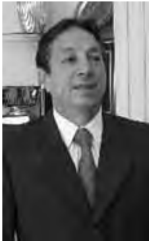
El presidente saliente es Oscar Ghezzi, que actualmente está al frente de la Cámara Argentina de Turismo -CAT-

El encuentro es organizado por la Filial local, la Asociación Empresaria Hotelera Gastronómica Bariloche.