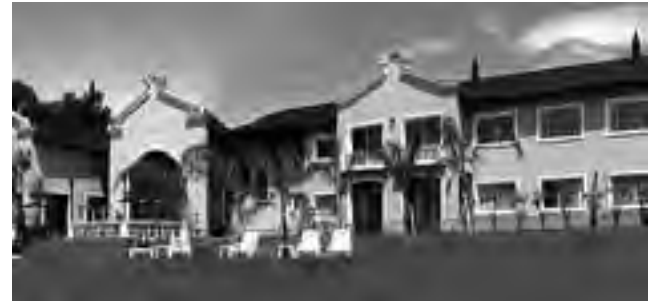
El más cercano: "Howard Johnson Trenque Lauquen"

La cadena hotelera internacional "Howard Johnson", continúa creciendo en Argentina, desarrollándose en los sitios donde está instalada y proyectando nuevas locaciones, siendo 2013 un año de expansión con alianzas estratégicas.