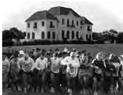
La carrera en Parque Luro, dará inicio a las 9:30 hs del miércoles 1º de mayo. Por la tarde a partir de las 16 hs en las escalinatas del Castillo, actuarán "Somos Trio".

Durante el mes de mayo, con motivo de celebrarse el "Mes de los Museos", la Secretaría de Turismo llevará a cabo una serie de actividades tanto deportivas como culturales en la Reserva Provincial Parque Luro.