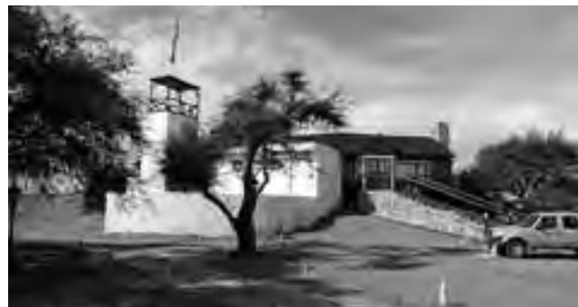
Instalaciones de la Reserva ubicada en Quehué.