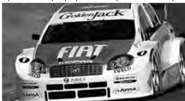
Actualmente FAT ocupa el 2° lugar en el Campeonato Argentino de Marcas del Súper TC2000, que correrá en Santa Rosa el próximo fin de semana.

cionando a Fiat en el 2° puesto a nivel nacional.