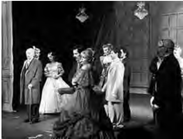
Son extensos los estudios científicos que prueban la capacidad de la música clásica como "ordenadora de ideas", y hoy se la utiliza también en psicología, mediante terapias diversas a través de la musicoterapia.