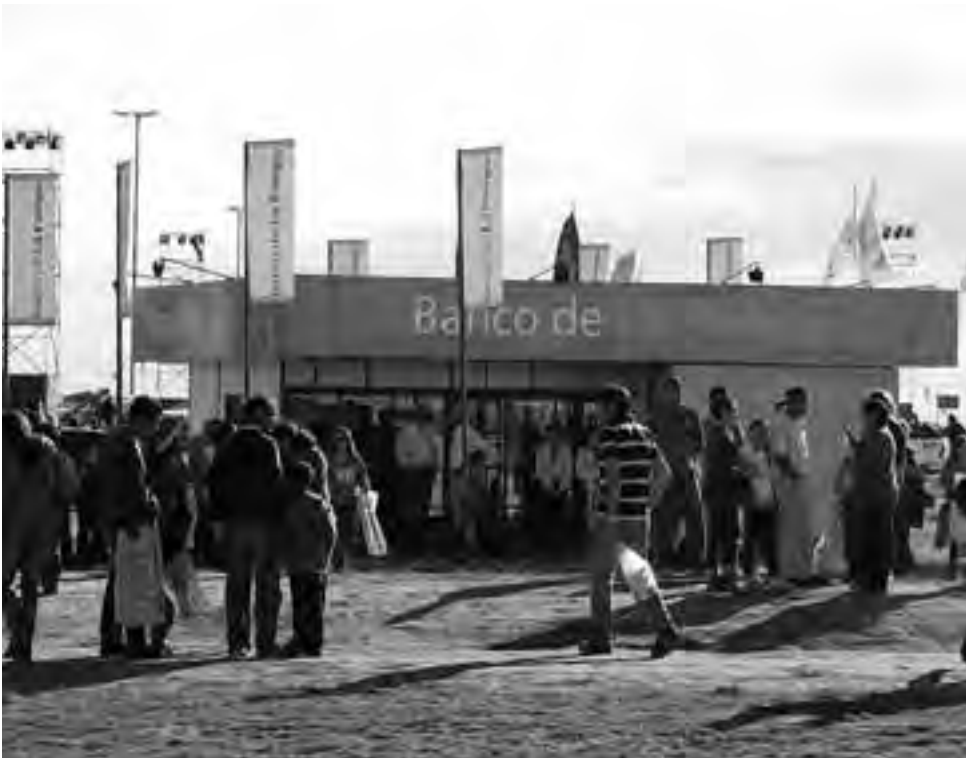
Muy recientemente, junto al Consejo Federal de Inversiones y el Gobierno de La Pampa, el BLP fue uno de los principales auspiciantes de la Feria "Expo PyMEs 2013" realizada en el predio del Autódromo Provincia de La Pampa, con notable éxito.

El Banco de economía mixta se convirtió en un proyecto colectivo de muchos pampeanos. Cuando el 18 de mayo de 1959 abrió sus