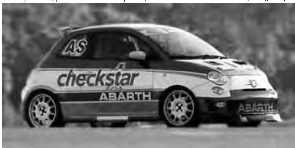
También a partir de la próxima semana ya se podrán disfrutar en el salón de Exposición de “GENOVA SA”, los flamantes Fiat 500 Abarth pertenecientes al campeonato de la monarca Fiat Abarth Punto Competizione-Argentina.

También a partir de la próxima semana ya se podrán disfrutar en el salón de Exposición de “GENOVA SA”, los flamantes Fiat 500 Abarth pertenecientes al campeonato de la monarca Fiat Abarth Punto Competizione-Argentina. Para mayor información llamar al teléfono 02954-450054.