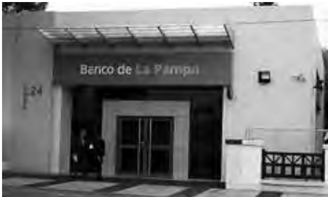
Con la Agencia Hospital Lucio Molas, inaugurada el año pasado y la obra de las nuevas instalaciones realizada en la calle Lagos, el Banco tiene una red de 97 puntos de atención, de los cuales 8 se encuentran en Santa Rosa.