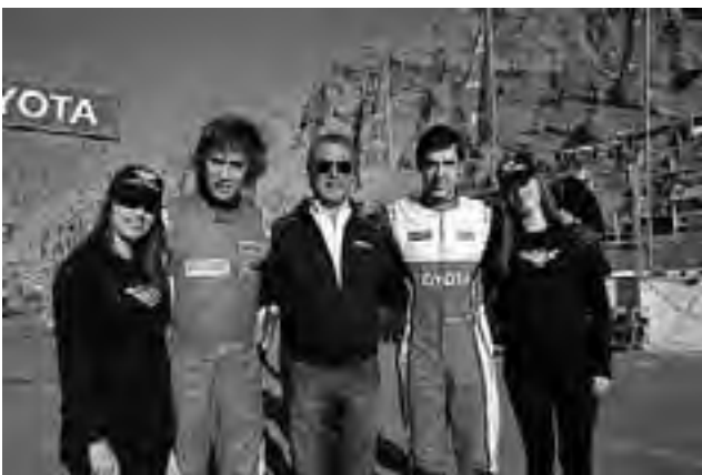
Los Calamari, junto a la promotoras de la Sectur en San Juan.

La semana que viene, estará en circulación la revista del Suplemento Deportivo Color de REGION®, con todos los detalles de esta competencia.