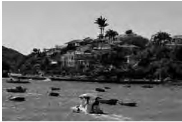
La ciudad posee un estilo arquitectónico propio, donde todas las construcciones no pueden pasar los dos pisos, gracias a una ley de 1979.

En invierno la máxima media baja a 19 °C y la mínima media es de 12 °C. De abril a septiembre la probabilidad de lluvia es muy baja, mientras que entre noviembre y marzo es alta.