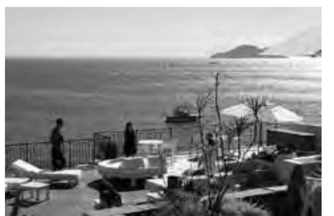
En Búzios se puede elegir entre más de 200 posadas y hoteles para todos los gustos y presupuestos, desde sitios lujosos e impecables, hasta los más económicos y confortables.

Sin embargo, el lugar más exquisito es la Isla de Âncora, a 40 minu-