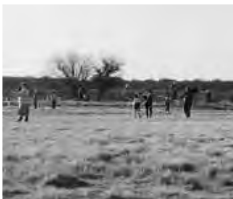
Barrileteada en Parque Luro.

En unas jornadas donde el clima acompañó de manera especial, cerca de 2 mil personas visitaron la Reserva Parque Luro. Además, la Reserva fue el escenario de "actividades especiales para celebrar el Día del Niño", se realizó un taller de barriletes y diferentes juegos para disfrutar al aire libre las bondades que brinda la naturaleza del Parque.