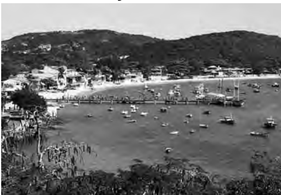
Un pueblo alegre y relajado, en una cultura de aldea de pescadores mezclada con un resort francés, formando un espíritu único. Bares, lugares de la moda y discotecas para disfrutar toda la noche. Pizzerías, creperías y restaurantes para todos los gustos. Boutiques y tiendas de marcas nacionales e internacionales se mezclan con galerías de arte y artesanía local.

Originalmente habitada por piratas franceses, esta feliz mezcla de varios pueblos prosperó y Buzios se transformó en una linda villa de pescadores, elegida como una de las 10 zonas más bellas del mundo. Es famosa por su combinación única de encanto arquitectónico, naturaleza incomparable, boutiques sofisticadas y restaurantes frecuentados por visitantes que vienen desde varios países del mundo para conocer esa magia. En Búzios se puede elegir entre