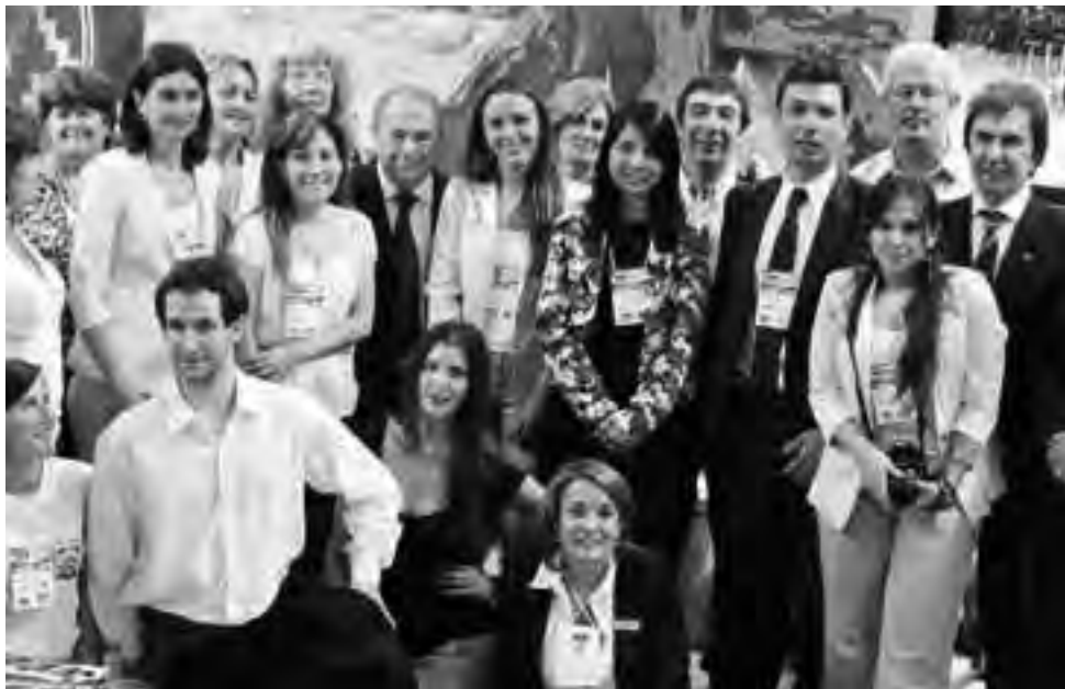
Parte de la Delegación Pampeana que participó en 2012. Casi todos van nuevamente.

En esta oportunidad, acompañando a la Secretaría de Turismo, estará presente el área de Turismo de la Municipalidad de Santa Rosa, Casa de Piedra, Intendente Alvear, General Pico, Guatraché, Realicó, Intendente Alvear, Falucho, La Adela, General Acha y Jacinto