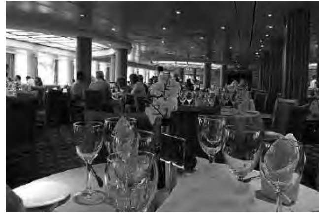
Seis comidas diarias garantizan que nadie pasará hambre. Lujosos restaurantes y buffets grills o pizzerías autoservice intercalan horarios durante todo el día.

De todas maneras es recomendable llevar algunos billetes encima