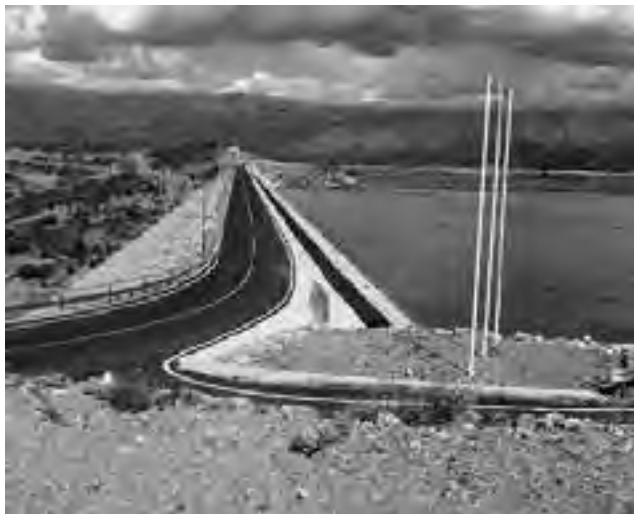
El colosal espejo de agua (más grande que Potrero de los Funes) del nuevo dique "Las Palmeras", es un espectacular lago de 186 hectáreas, uno de los más grandes de la provincia de San Luis, donde se están realizando variadas inversiones.