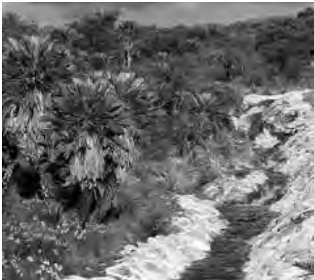
En los alrededores de la localidad puntana de San Francisco del Monte de Oro, varios ríos recorren el valle, con hermosos vados y balnearios, donde abundan el Molle y el Algarrobo Blanco, siendo la vedette de la zona la hermosa Palmera Caranday en su habitat más austral del mundo.

Reconocida mundialmente por las bondades de su microclima, la provincia de San Luis, ubicada en el cuyo argentino, tiene un interesante recorrido por la denominada Zona Norte.