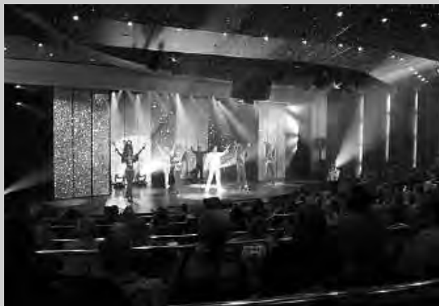
La noche reúne a todos en el gran teatro a bordo.

Si fuera necesario, los barcos cuentan con servicio médico.