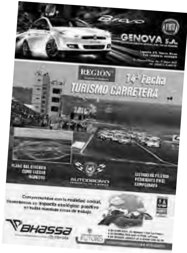
El suplemento color de REGION® con datos de la carrera se puede retirar hoy gratis de 9 a 18 hs. en nuestra redacción (uno por persona).