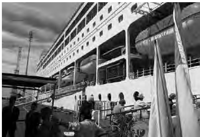
Es recomendable ir a la Terminal a media mañana, despachar equipaje y subir al barco al mediodía, comenzando a disfrutar de las comidas e instalaciones.