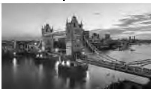
"Tower Bridge", el puente de la Torre de Londres sobre el río Támesis, un icono de la ciudad.

Los famosos tulipanes y los molinos que la rodean, son las postales típicas de este sitio tan pintoresco, asentado en decenas de islas unidas por centenares de puentes. Conocer Amsterdam es abrir una caja de sorpresas, donde se combinan arquitectónicamente el Barroco Holandés con diseños del Renacimiento y la modernidad. Entre los sitios de interés, la Casa de Ana Frank es hoy un testimonio del Holocausto y lugar de visita turística. Otro es el Mercado de las Flores con sus puestos flotantes situado en el Singel y en el campo cultural, el Van Gogh Museum, que acoge la colección más extensa del pintor