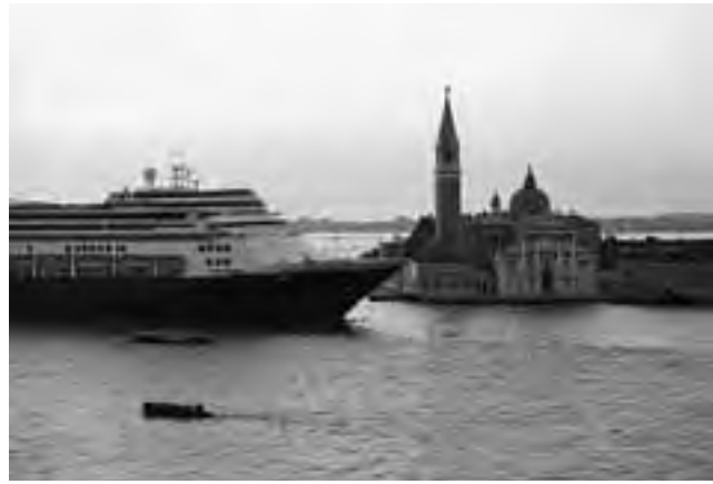
Desde abril a octubre de 2014 los barcos de Holland America Line visitarán a bordo los puertos de Civitavecchia en Roma y Barcelona en España, así como la increíble Venecia italiana.

Mediterranean Explorer, Adriatic Dream, Mediterranean Dream, Venetian Adventure, son todas opciones que el viajero podrá combinar con los tours que se ofrecen a bordo o en la web de Holland America Line. También es importante destacar que las reservas anticipadas se pueden