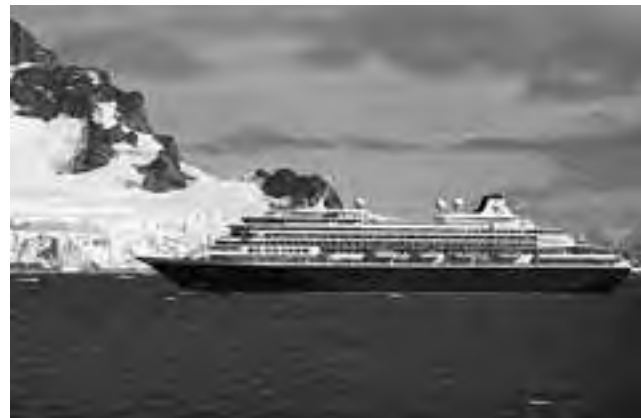
Hasta abril del 2014 el Zaandam realizará una serie de cruceros de 13 días entre Valparaíso, en Chile y Buenos Aires al que se sumará un viaje de 18 días por los indescriptibles fiordos chilenos.

Hasta abril del 2014 el Zaandam realizará una serie de cruceros de 13 días entre Valparaíso, en Chile y Buenos Aires al que se sumará un viaje de 18 días que parte desde Valparaíso, enriquece con su recorrido los indescriptibles fiordos chilenos y llega a Ushuaia