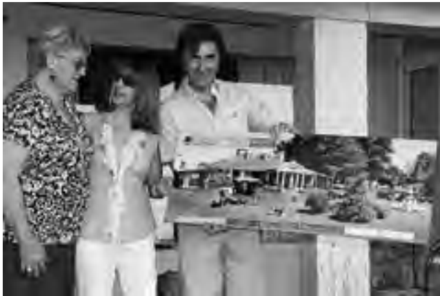
El año pasado, al cumplirse los 20 años, REGION® Empresa Periodística, distinguió a Villaverde con un cuadro de regalo, por ser una estancia turística pionera del Turismo Rural en Argentina.