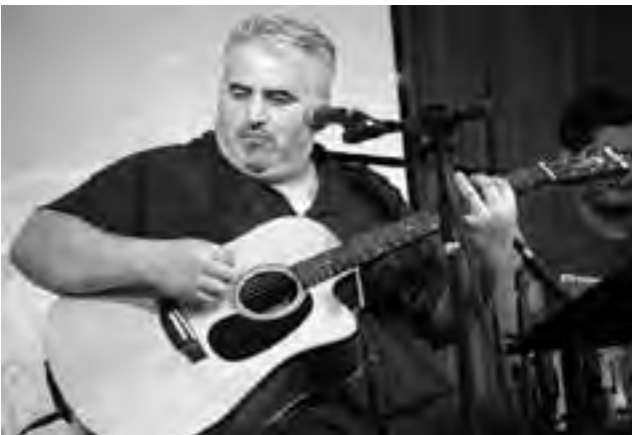
VIENE DE TAPA