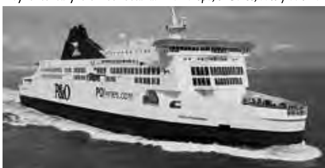
Para ir a Londres en auto, el mejor cruce del Canal de La Mancha es por Calais -Francia- hasta Dover -Inglaterra- en ferry. También se puede hacer en tren por el 'eurotúnel' -es más rápido y más caro-, pero se pierde el atractivo visual del viaje.

Londres es una ciudad inmensa que alberga múltiples culturas. Está situada en el río Támesis, al sureste de Inglaterra y conforma la capital del Reino Unido. No es difícil trasladarse en ella, a pesar de su gran tamaño, porque tienen una buena red de metro -'tube'-, muy extensa y bien conectada.