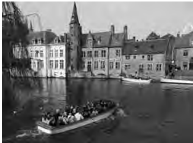
Tanto Brujas como Amsterdam, tienen en sus canales el mejor paseo turístico, donde se consiguen fotos magníficas de lugares imposibles de apreciar a pie.

Desde hace un mes y medio (ver REGION® N° 1.109 al 1.113) venimos publicando este informe de viaje que consta de 8 partes.