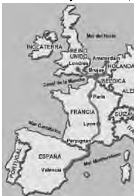
El recorrido propuesto en auto, no es un viaje caro teniendo en cuenta el destino. Para hacerlo bien y que resulte conveniente hay que programar con tiempo.

Una visita a la pequeña localidad de Damme, camino al mar, es