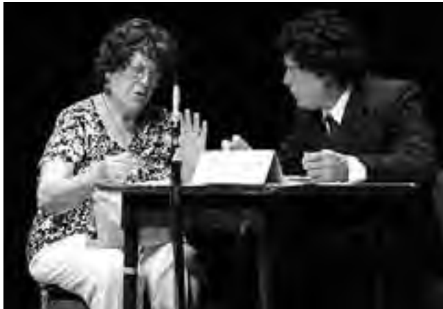
"Cuánto vale una heladera", la divertidísima historia de Claudia Piñeiro.

El cierre fue del "Grupo Voces Santa Rosa", muy aplaudido, y la culminación de la velada llegó con distinciones para los participantes.