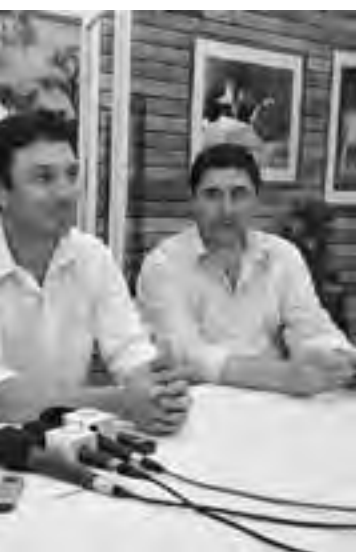
La presentación manifestando el acompañamiento de la Cámara de Comercio coordinarán la actividad.

tomará para el diseño de las vidrieras será: Vidrieras Alegóricas de Navidad 2013. Se podrán utilizar todo tipo de materiales, con técnica libre, que representen mejor esta época del año. Cada vidriera se deberá diseñar en base a los productos o servicios que comercializa poniendo en valor a los mismos, destacándolos y haciendo uso del ingenio para mostrarlos con estas características propias de las vidrieras de Navidad.