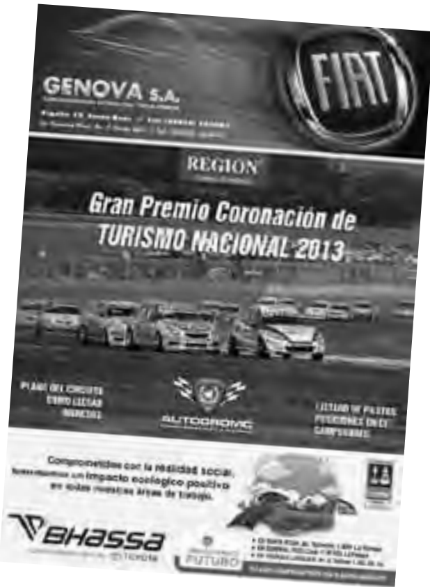
El suplemento color de REGION® con datos de la carrera se puede retirar hoy gratis de 9 a 18 hs. en nuestra redacción (uno por persona).