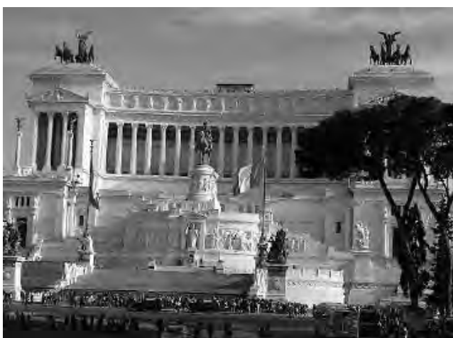
El Victoriano de Plaza Venecia, tumba del Soldado Desconocido y Altar de la Patria.

Es el plato típico de la región, un guiso con porotos, más una verdura parecida al repollo que se llama 'berza', chorizo, morcilla, costilla de cerdo o jabalí. Zaragoza es ruta obligada a Valencia. En sus alrededores hay poblados pintorescos, con apenas un centenar de habitantes, como "El Buste", que vale la pena conocerlos.