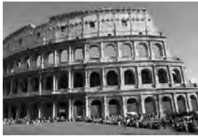
"El Coliseo Romano". La elección de una ruta aérea desde Valencia con una escala de 7 horas en Roma -mucho más barata que un vuelo directo-, agregó la posibilidad de una fugaz escapada al centro de la capital italiana.

Desde hace siete ediciones (ver REGION® N° 1.109 al 1.115) venimos publicando este informe de viaje que lleva por título "De Suramérica a Europa, en barco, auto y avión", que hoy concluye.