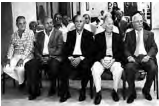
Ex intendentes de General Pico, en la celebración del Concejo Deliberante.