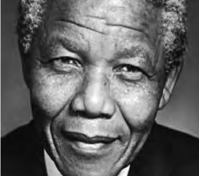
La muerte de Nelson Mandela no supone una pérdida sólo para Sudáfrica. Es una pérdida para todas las personas de este mundo que luchan por la libertad, la justicia y para acabar con la discriminación.

Fue un ejemplo que trascendió al mundo. Amnistía Internacional