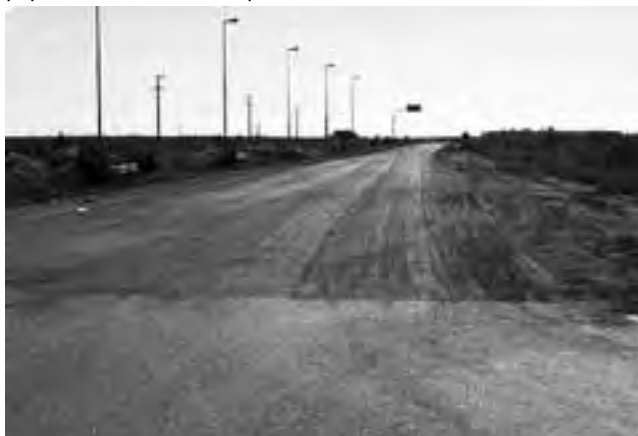
Se observa no más de 300 metros de fresado de cinta asfáltica en la intersección de ruta 70 y ruta nacional 33