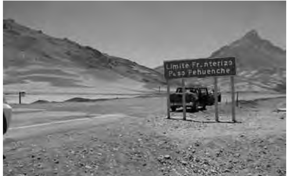
Dicen que el gobernador de Mendoza, Francisco Pérez, piensa invitar a Cristina Kirchner para que visite la zona del paso El Pehuenche.

Se dijo que "Paco" Pérez hablaría en el país vecino de los inconvenientes que todavía subsisten en el paso Los Libertadores, del futuro del paso El Pehuenche y también de un asunto clave desde el punto de vista estratégico: la licitación del tren Trasandino, que está congelada desde hace meses.