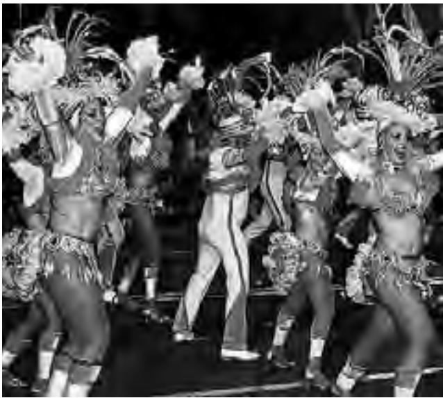
Se anunciaron corsos con murgas y comparsas en General Acha, Miguel Riglos, Cauleufú, Guatraché, Speluzzi, Miguel Riglos, Trenel, Realicó, General Pico y Santa Rosa.