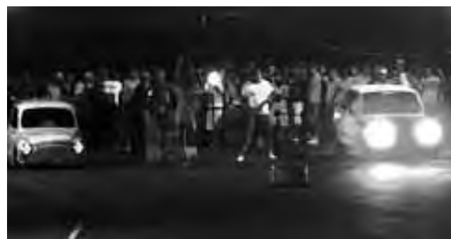
La apertura del autódromo será a partir de las 17 hs. La entrada general costará $ 50 y los menores de 12 años ingresan gratis. Habrá servicio de Cantina

La organización “Santa Rosa Drag Race” ha programado para este fin de semana en el Autódromo Parque de la Ruta Nacional N° 5, la última fecha nocturna de picadas de velocidad, donde aseguran que habrá más de 80 autos y más de 80 motos.