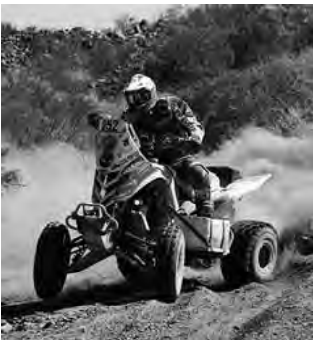
Motos y cuatriciclos a campo traviesa, participarán en el “Rally de Ataliva Roca” agregando emoción a la zona en este fin de semana.