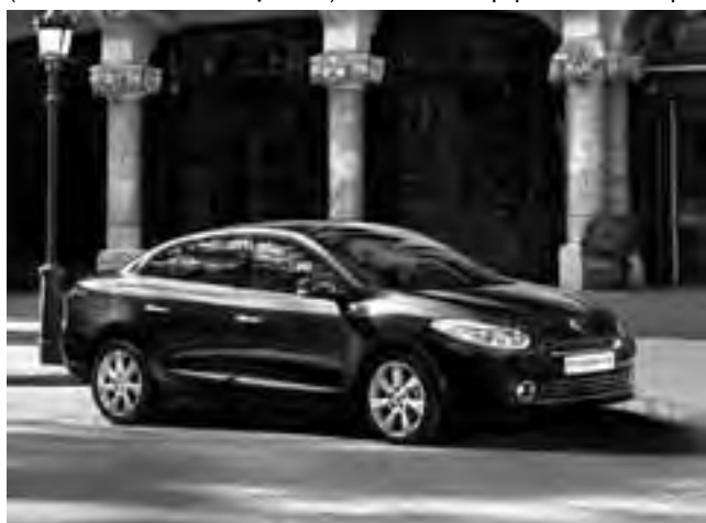
El Renault Fluence 2014 se ofrece en Argentina en 7 diferentes variantes de acabado, con un precio que inicia en los 142.700 pesos para el modelo de acceso con motor 1.6, hasta los 217.300 del tope de gama GT con motor de 2.0 litros.