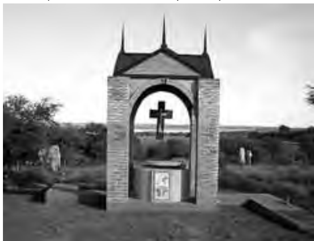
La Adela y Guatraché, en la provincia de La Pampa, preparan caminatas espirituales y actividades religiosas para estos días de Semana Santa.

En estas fechas, las propuestas de turismo religioso se entremezclan con las clásicas propuestas turísticas que ofrece Patagonia en todos los destinos, y el Fin del Mundo no es la excepción. La ciudad de Ushuaia cuenta con innumerables propuestas turísticas en todas las estaciones del año, entre ellas no se puede dejar de visitar el Parque Nacional Tierra del Fuego, el único Parque Nacional argentino que posee costas marinas bañando el bosque. El tren del fin del mundo propone un viaje al pasado, cuando los presos eran trasladados en tren para abastecer de leña a la población. Navegar a través de los canales fueguinos es una experiencia inolvidable y una oportunidad de ver el imponente marco natural de Ushuaia desde otra perspectiva. Bahías, islotes y fiordos de singular belleza deslumbran a lo largo del recorrido por las aguas azules del mítico Canal Beagle, acompañado por una variada avifauna y mamíferos marinos.