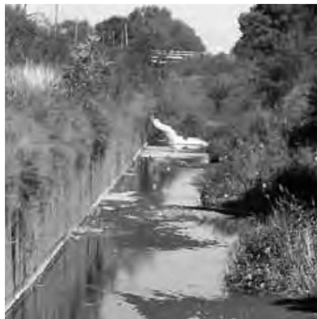
Canal a cielo abierto que acompaña la Ruta Nacional N° 35 lado Este, en la zona de Villa Portal del Sur y Barrio Escondido. Es necesario entubarlo y hacer una calle colectora, para mejorar la salud de la población y la seguridad vial de este sector de la ciudad en el que se anticipa tan importante crecimiento.

Conjuntamente con esta entubación, sería razonable que se haga allí la esperada calle colectora, para mejorar la seguridad vial de este sector de la ciudad en el que se anticipa tan importante crecimiento. Y que no vengan la Municipalidad de Santa Rosa con excusas de que esta obra no les corresponde, porque ya al respecto dijo el Distrito 21 de la Dirección Nacional de Vialidad, que la misma es de responsabilidad municipal.