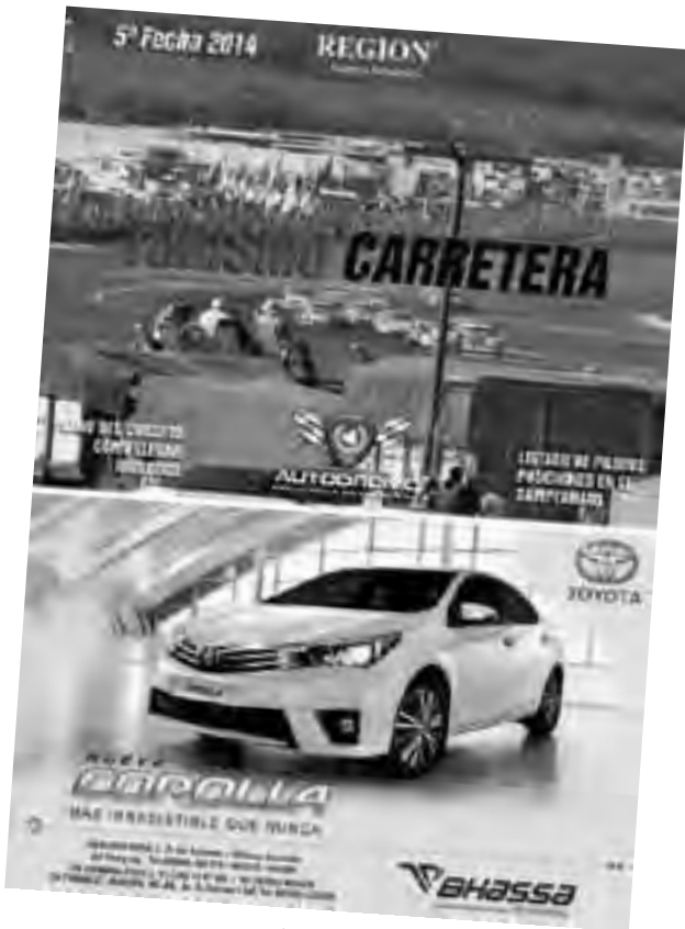
El suplemento color de REGION ® con datos de la carrera se puede retirar hoy gratis de 9 a 18 hs. en nuestra redacción (uno por persona).