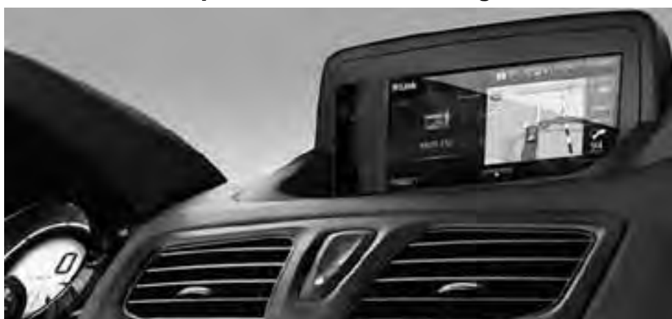
Este nuevo sistema ofrece a diferencia del equipo que reemplazó, una pantalla color táctil de 7 pulgadas, que también integra al navegador con mapas de Tom Tom, conectividad Bluetooth, conexión para iPod y sistema de seis parlantes.