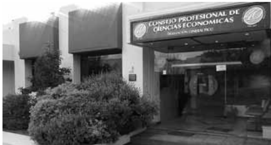
Sede de la Delegación General Pico del Consejo Profesional de Ciencias Económicas de La Pampa.

"Estoy en el Consejo de Ciencias Económicas de La Pampa en el cargo de vicepresidente, representando no solo a General Pico sino a la zona norte, la Mesa Directiva del Consejo Profesional de Ciencias Económicas de La Pampa, está formada por personas que representamos a la zona norte, centro y sur para que toda la profesión esté representada, a su vez el Consejo está federado en una institución de segundo grado que es la Federación Argentina de Consejos la cual está presidida por Mesa Directiva y la Comisión Fiscalizadora donde tenemos un representante por región del país, en mi caso me toca representar a la Patagonia en la Comisión Fiscalizadora de la Federación Argentina de Consejos, así que