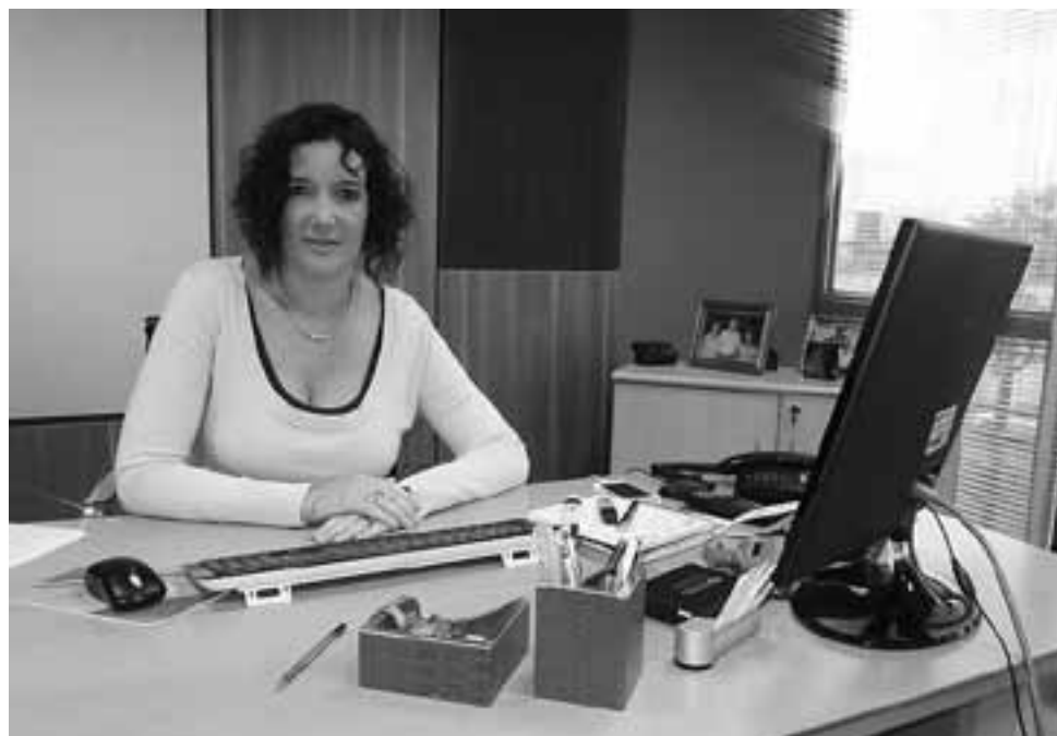
Si uno viaja al extranjero y solicita a la AFIP compra de moneda, Ingaramo explicó: que siendo un matrimonio, si los dos están inscriptos en el impuesto a las ganancias, se obtiene mas si cada uno solicita por su parte, que si solicita uno por los dos.

Respecto de la adquisición de la moneda extranjera para viajar, todos sabemos es de público conocimiento la AFIP tiene su famosa fórmula, una semana antes de realizar el viaje hay que hacer el pedido con la Clave Fiscal por un “x” monto donde se le informa a la AFIP la cantidad días que uno viaja, el costo del viaje, como pago el viaje, y con eso la AFIP determina con su formulita mágica (sic), decimos porque nadie sabe como lo hace, aproximadamente otorga cien dólares por día de viaje, depende de cuantos pasajeros viajen, lo que se aconseja es cuando dependiendo de las personas que viajan, suponiendo que es un matrimonio y que los dos están inscriptos en el impuesto a las ganancias que cada uno solicite por su parte, como que viaja uno, porque generalmente adquieren más que si solicita uno por los dos, esto por la experiencia que