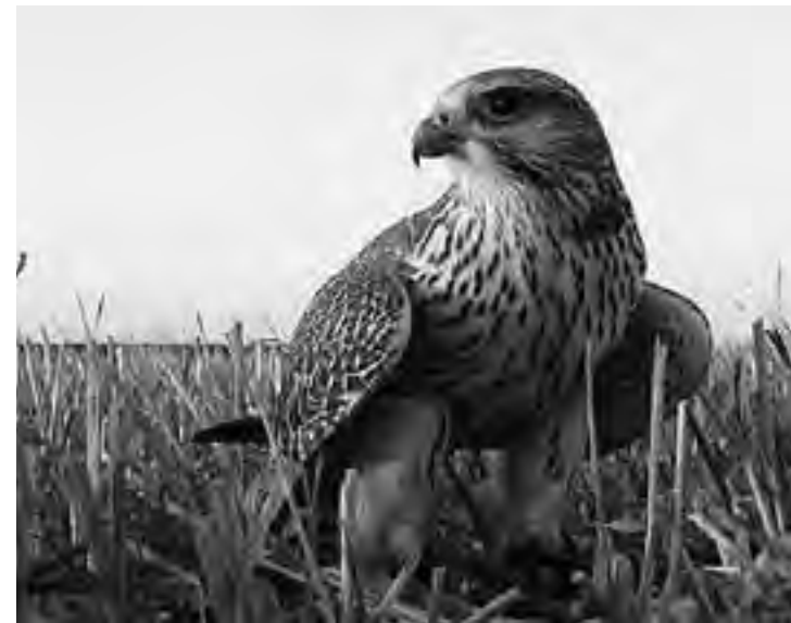
El Halcón Peregrino es el animal más rápido del mundo. Puede alcanzar los 300 kilómetros por hora... es el rey de la cetrería.

buscando un cachorro para cetrería. Duración: 30 minutos y 10 minutos de preguntas