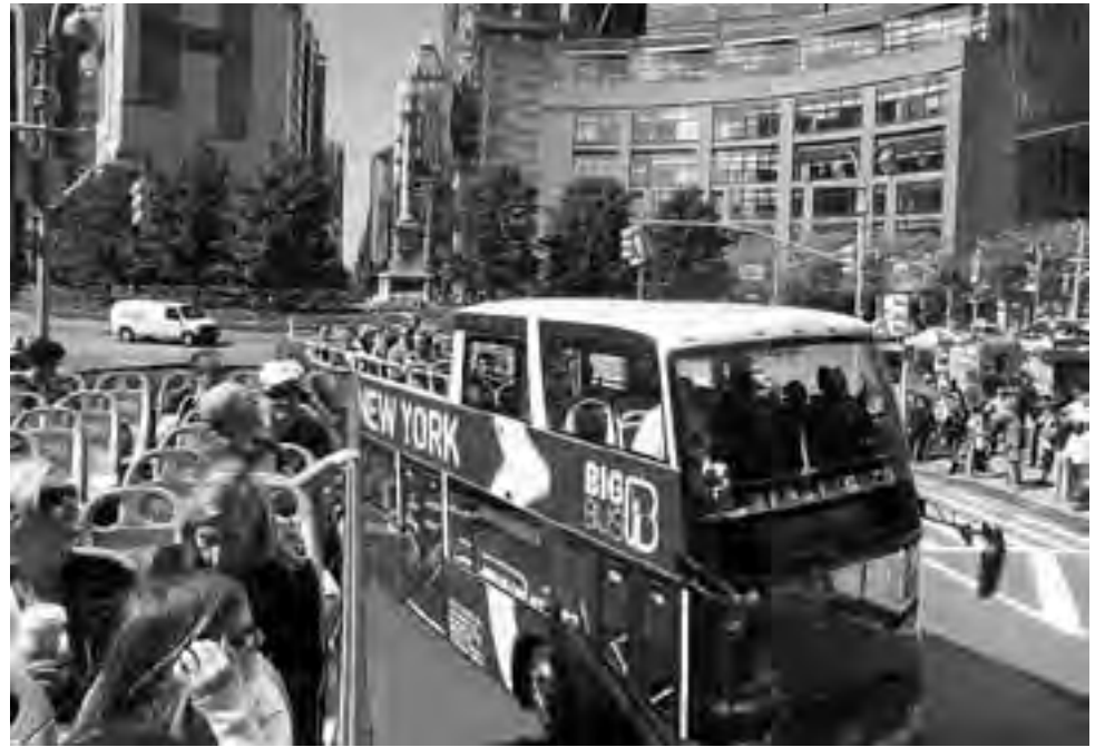
Lo mejor para conocer Nueva York es comenzar con un City Tour mediante algunas de las muchas empresas que ofrecen micros descubiertos con guía y servicio de audio multilingüe, sistema "hop on hop off" -bajamos del micro donde nos guste y continuamos nuevamente luego-, como ejemplo para esta nota tomamos los recorridos de "Gray Line".

Lo mejor para una visita, siempre lo remarcaríamos, es hacer un City Tour con algunas de las empresas que ofrecen micros descubiertos con guía y servicio de audio multilingüe, como por ejemplo "Gray Line" que tomaremos como