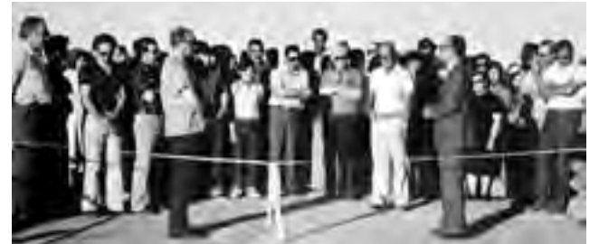
Foto histórica de la inauguración del Paso de los Algarrobos en el Oeste pampeano.

El surgimiento de la Dirección Provincial de Vialidad se vinculó a los contextos nacionales y provinciales, ya que ambos influyeron notablemente en el desarrollo de la repartición.