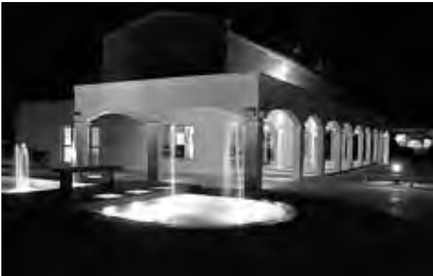
La celebración será este jueves por la noche, con una cena en La Campiña.

El 20 de junio de 1970 se reunió en la ciudad de Santa Rosa, provincia de La Pampa, una asamblea constitutiva de la Asociación Pampeana de Hoteles y Afines, con el objeto de designar una Comisión Provisoria para elaborar un anteproyecto estatutario, una suscripción de socios y luego convocar a éstos para consagrar autoridades definitivas.