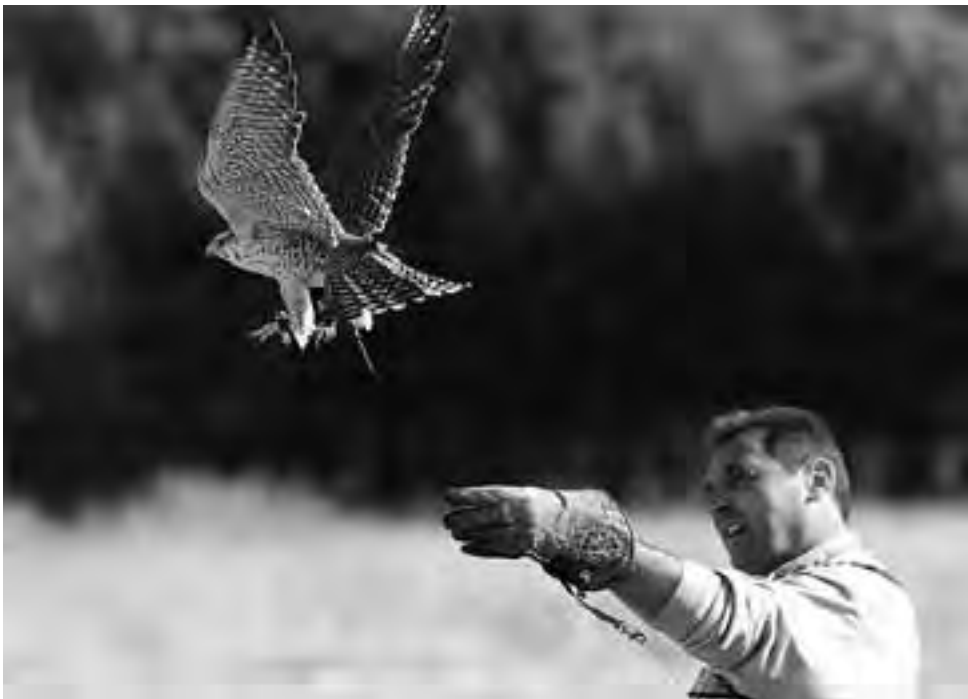
La actividad de "Cetrería", es el arte de cazar con aves rapaces, como halcones, águilas y gaviñanes. Desde Estados Unidos vendrá a Colonia Barón, La Pampa, el vicepresidente de la IAF (Asociación Internacional de Cetrería) Ralph Rogers.

También los visitantes nacionales mantendrán este jueves varias reuniones, entre ellas, una en la Estancia Villaverde, donde tendrán un agasajo y podrán apreciar el producto pampeano del Turismo Rural.