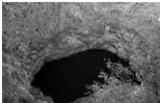
"Lago Rojo" en Dalmacia, Croacia (Europa), de 280 metros de profundidad.

parque. E. Mc Gowman pensó en la flor homónima cuando advirtió la forma del geiser.