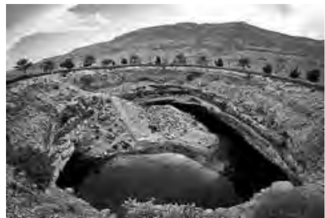
Sumidero Bimamah cerca de Dibab, en Omán (Asia), donde es posible darse un baño en sus aguas turquesas. Está conectado de manera subterránea con el mar, a tan solo 500 metros de distancia