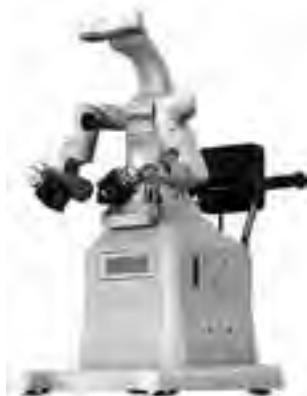
Una innovadora herramienta para la producción, capaz de sentir, pensar y tomar decisiones,

Epson planea hacer una versión comercial del robot en el año fiscal 2015 (que finaliza en marzo 2016).