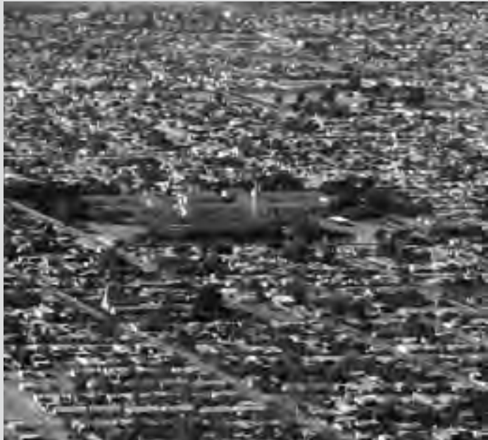
No es razonable que en una ciudad como Santa Rosa hayan quedado 10 hectáreas dentro de la misma, a la que no se le de un mejor aprovechamiento, no por quienes usan el predio actualmente, sino por lo que se podría hacer allí.

Ya en 2008 señalábamos la necesidad de realizar una consulta popular