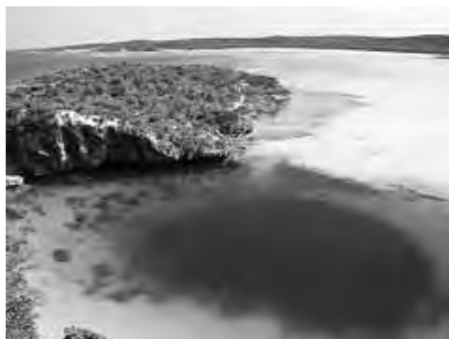
Dean's Blue Hole o "Agujero Azul de Dean" en Bahamas (centroamérica), el más profundo en su tipo con 202 metros y unos 25 de diámetro.

-En el mítico parque Yellowstone, entre sus numerosas atracciones naturales se destaca el Morning Glory (Gloria de la Mañana), un geiser llamado de esa manera por la esposa de quien era por ese entonces una de las autoridades del