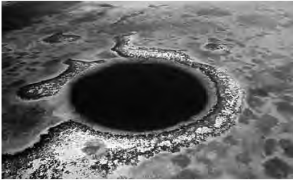
El "Gran Agujero Azul", frente a la costa de Belice (centroamérica), de 123 metros de profundidad y 300 metros de ancho.

Si de profundidades se trata, el Mar Caribe cuenta con algunos puntos destacados, entre ellos tal