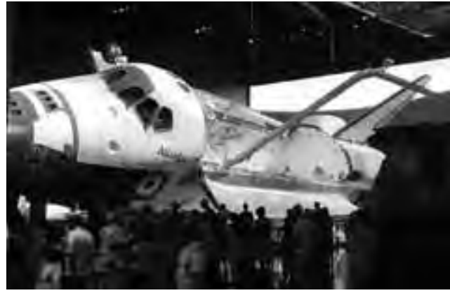
Impresionante la visita al "Space Shuttle Atlantis", un edificio dentro del Complejo de Visitantes que fue construido alrededor de un orbitador Atlantis real.

Titusville es un buen punto para alojarse y acceder con facilidad al "Centro Espacial Kennedy", distante a 25 km. Hay buena hotelería, muy variada y a precios convenientes. Desde la costa de la ciudad también se pueden apreciar los lanzamientos de la NASA. Muy cerca está "Cocoa Beach" un concurrido y muy promocionado balneario del estado de Florida y la hermosa zona de Merrit Island, donde también hay buena hotelería.