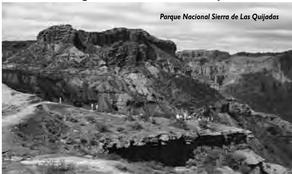
Parque Nacional Sierra de Las Quijadas

un testimonio increíble de la historia ilógica de Argentina, con los desencuentros propios de la intolerancia. Muy apasionante. Solicitar información de horarios en la Secretaría de Turismo.