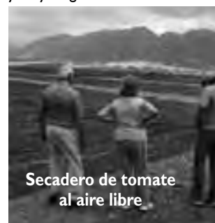
Secadero de tomate al aire libre

-Visita a la champañera «Cavas de Zonda» -no se la pierdan y aprovechen a comprar a buen precio que es de altísima calidad- -Visita al Dique Ullum y el Hotel Howard Johnson. Fotos espectaculares.