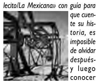
que cuente su historia, es imposible de olvidar después y luego conocer

El regreso hacerlo por la RN 60 hasta el cruce con la RN 40 y doblar rumbo sur, pasando por Chilicito -una visita al Cablecarril «Chilicito/La Mexicana» con guía para