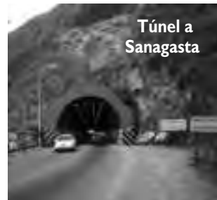
Túnel a Sanagasta

-Tomando la RN 75, a muy pocos kilómetros se puede visitar «Las Padercitas», un conjunto de ruinas de barro y piedra, de valor histórico que da para unas buenas fotos.