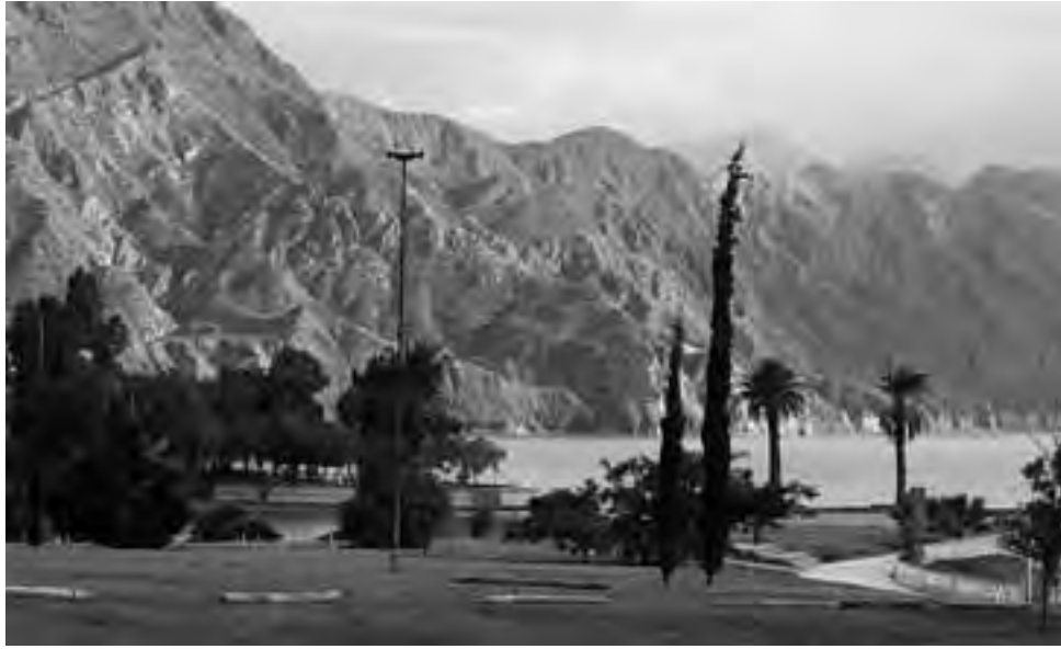
En este primer tramo del recorrido, una visita al Dique Ullum cercano a la ciudad de San Juan, resulta muy conveniente. Al borde del lago hay un hotel de la cadena Howard Johnson, que acepta visitas. El lugar es ideal para hacer un alto en la tarde y tomar el té, o disfrutar de una picada al borde del espejo de agua, desde donde se obtienen fotos espectaculares.

Además, varios de nuestros seguidores reclaman más datos sobre turismo en Argentina para