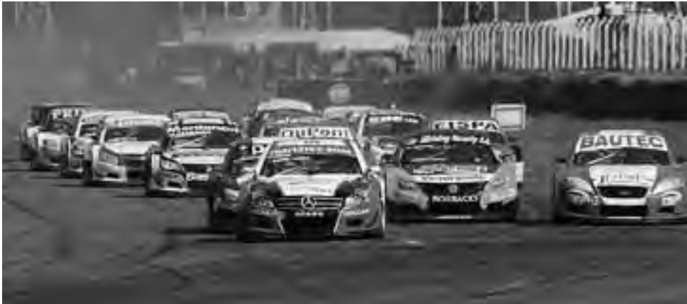
Esta carrera en el Autódromo Provincia de La Pampa, otorgará puntaje especial para la categoría, por lo que se anticipa desde la organización que será definitiva en la clasificación. También corren el Turismo Internacional y el Supercar Pampeano

El trazado a utilizar en La Pampa, a diferencia del año pasado, será el perimetral, de 4.148 metros. Se volverá a usar el sistema de clasificación en tres etapas, para ambas categorías: primero clasificando todos, luego los 10 mejores tiempos y, finalmente, la última tanda con los cinco registros más rápidos. Las tandas serán de 8