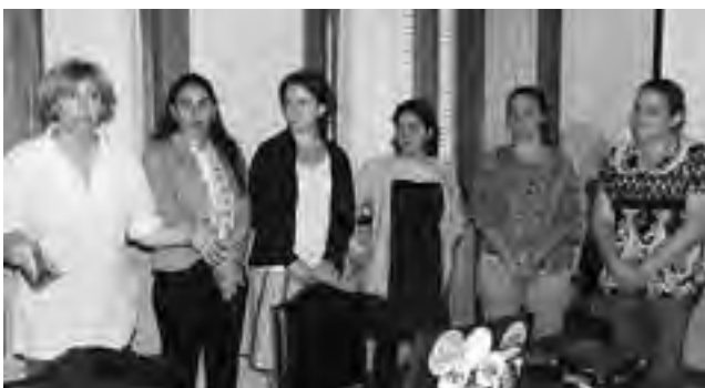
La actividad se enmarca en el programa de carácter nacional "Las víctimas contra la violencia".

En la sala de reuniones del Ministerio de Bienestar Social se llevó a cabo el III Encuentro de capacitación en el marco del programa "Las víctimas contra las violencias", dependiente del Ministerio de Justicia y Derechos Humanos de la Nación. En este caso se abordaron temas como los referidos a explotación sexual comercial infantil y explotación sexual comercial infantil infiltrada en viajes y turismo y en las nuevas tecnologías.