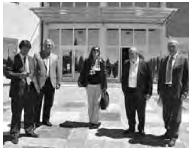
Recientemente el gobernador de la Provincia, Oscar Jorge, recorrió la obra, confirmando su inauguración antes de fin de año.

El Centro Cultural Provincial MEDASUR (Multi Espacio Del Arte del SUR) construido en Santa Rosa en la intersección de la Av. Belgrano y Padre Buodo, abarca una superficie cubierta de 2.400 metros cuadrados -obra en la que el Gobierno de La Pampa ha invertido unos 27 millones de pesos-