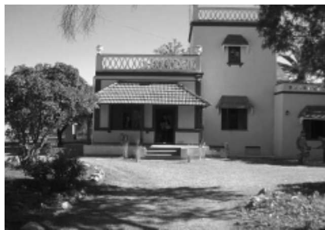
Lamentablemente la palabra «hospice» no tiene una traducción adecuada al español, ya que literalmente sería «hospicio», que esta lejos de lo que representa hoy esta modalidad, que tiene más de 50 años y que fuera introducida a la medicina por Cicely Saunders, en Londres, al crear el primer hospice científico, el St. Christopher, donde comenzó a difundirse el movimiento Hospice por todo el mundo.

El equipo de profesionales de FUCISA, da charlas barriales y el año pasado se trasladó tres veces al interior de la provincia para disertar sobre prevención del cáncer. Todo esto es financiado por los aportes que recibe la Fundación, ya que la actividad preventiva es totalmente gratuita para el público e instituciones donde se dicta. Finalmente, se ha constituido un Equipo de Cuidados Paliativos para el seguimiento y control de pacientes que se hallan fuera de tratamiento curativo. Esta expectativa fundacional fue trabajada durante 2 años hasta que finalmente se logró armar el equipo quienes se hallan en etapa de consolidación.