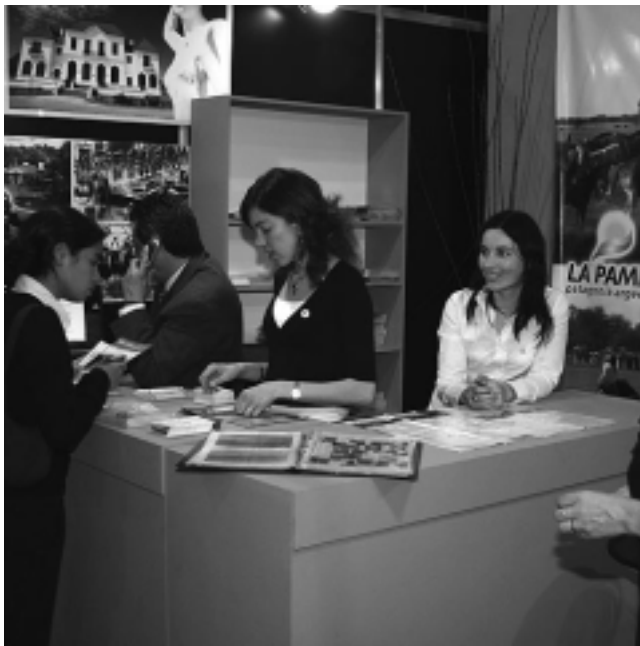
La exposición presentará durante cuatro días, las propuestas en alimentos típicos, turismo y artesanías de todas las regiones del país, donde La Pampa estará presente.

La Dirección de Comercio Interior y Exterior dependiente del Ministerio de la Producción de La Pampa, ha invitado a las empresas provinciales a participar en la Feria "Caminos y Sabores", que se llevará a cabo entre los días 10 y 13 de julio del año en curso, en el Pabellón Amarillo del Predio de la Sociedad Rural de la Ciudad Autónoma de Buenos Aires.