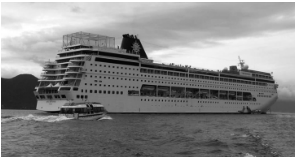
20 días de navegación con paradas en puertos, 19 noches de alojamiento y 100 comidas a bordo, pueden costar apenas un poco más que un viaje en avión de ida solamente.

Estas idas y venidas, cruzando el Atlántico, se producen desde Europa a Suramérica en noviembre y desde Suramérica a Europa en marzo.