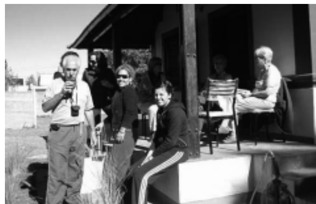
Este Centro Asistencial, que contará con personal profesional y técnico calificado y entrenado en Cuidados Paliativos, facturará sus servicios a Obras Sociales, Sistemas Médicos Prepagas y convenios con áreas gubernamentales. «Queremos dejar claramente expresado que los criterios de admisión de pacientes son médicos, no sociales» señalaron.