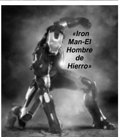
«Iron Man-El Hombre de Hierro»

«Amor y tesoro»: Tess es historiadora y Finn un aventurero. Ambos son cazadores de tesoros en el mar y un matrimonio que no está pasando por su mejor momento. Tienen planeado separarse, pero justo encuentran importantes indicios de lo que podría ser el mayor tesoro hundido de la historia. Ahora no sólo deberán concentrarse en el antiguo galeón, sino además ver la oportunidad de encontrar el