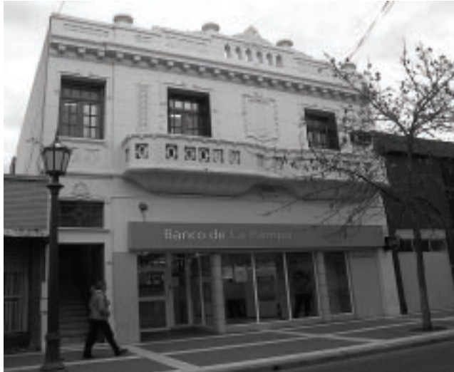
Otro de los edificios históricos que ocupa el BLP, en muy buen estado de conservación, es el de la calle 9 de Julio.

El Banco de La Pampa fue creado en los primeros años en que esta nueva provincia dejaba de ser Territorio Nacional para afrontar el armado de toda una estructura que no sólo sirviese a la parte administrativa, sino que además apuntalase el crecimiento de los sectores productivos. Así fue como nació «en los