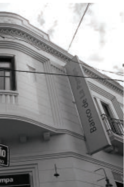
...ne parte de sus oficinas comerciales en Santa Rosa, donde se afincó el Gran Hotel. El edificio que hoy es el Banco de La Pampa hace un siglo atrás, en 1908, con muy buen criterio, ha preservado parte del pasado de la ciudad.

confianza y al final las sucursales se consolidaron.