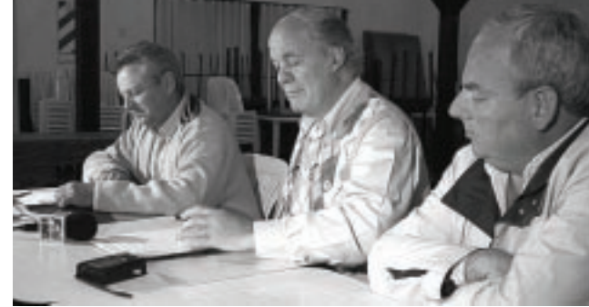
El encuentro estuvo convocado por Cámara de Comercio de González Moreno, Sociedad Rural de América y la Filial de Federación Agraria de Colonia El Toro.