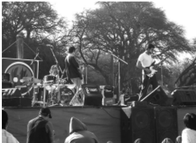
El Club de Caza «Mapú Vey Puudú», bajo la consigna «Una primavera sin alcohol», organizó un festival de rock en su predio de 22 hectáreas en Toay, donde asistieron más de 5.000 jóvenes.

El pasado domingo, la celebración del Día del Estudiante y de la Primavera tuvo importante eco en varios puntos de la Provincia, pero especialmente se constituyó en un evento, la realización en el predio del Club de Caza «Mapú Vey Puudú» en Toay, donde asistieron más de 5.000 jóvenes en torno a un espectáculo de música rockera, bajo la consigna «una