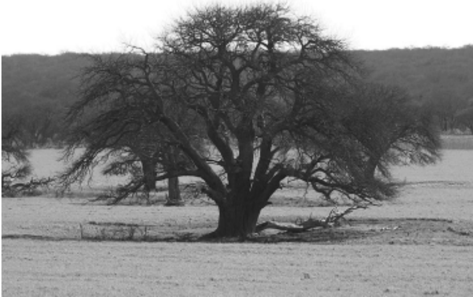
El paisaje pampeano, tan particular que nos distingue, es un atractivo de alto valor a nivel nacional e internacional, que día a día va ganando favoritos. Debemos complementar con buenos servicios turísticos lo que la naturaleza nos ha legado. En el Día Mundial del Turismo, La Pampa tiene mucho para festejar en esta actividad y en buena hora que así sea.