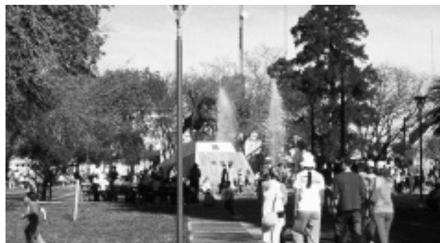
La Plaza San Martín de General Pico fue una acertada decisión para convocar la fiesta del estudiante, ya que es el lugar de ellos todos los fines de semana.