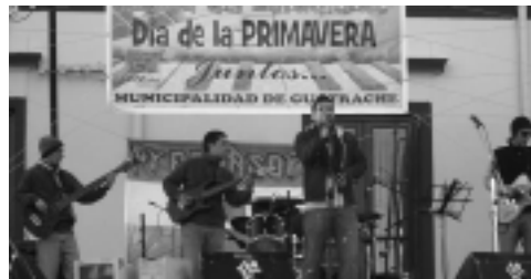
Un encuentro al aire libre en la estación del ferrocarril, fue el lugar de reunión en Guatraché, con bandas de rock, heavy y cumbia.