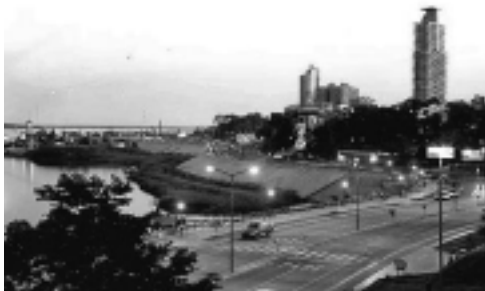
Ciudad de Posadas, provincia de Misiones.