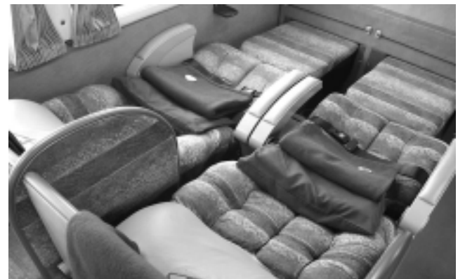
Con asientos cama de una plaza de 0,90 x 1,80 metros y detalles de diseño y tapizados que marcan la diferencia, hoy Expreso Alberino duplicó ese servicio.

«El pasajero valora la calidad del servicio -dijo-, el «Suite» de Expreso Alberino tiene asientos que se convierten en una verdadera cama de una plaza, con detalles de privacidad. La cena caliente es de primera, el personal de a bordo son gente responsable