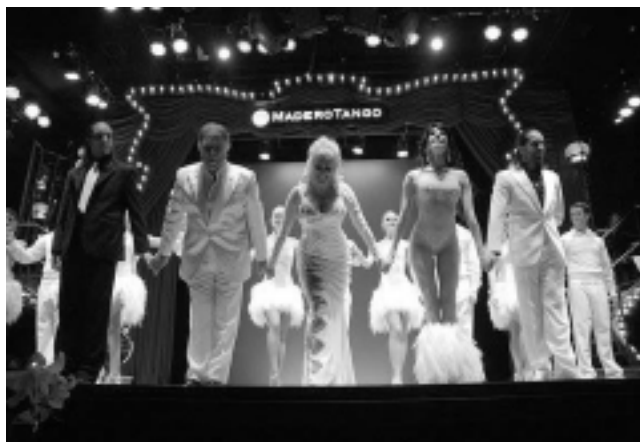
Los artistas en «Madero Tango», uno de los lugares top de la noche porteña.