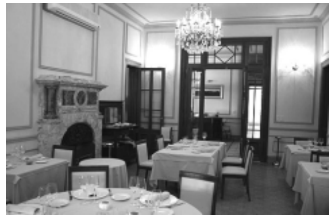
El lujoso hotel rural «La Pampeana», ubicado sobre la Ruta Nacional N° 188, ofrece un menú gourmet para celebrar su segundo aniversario.