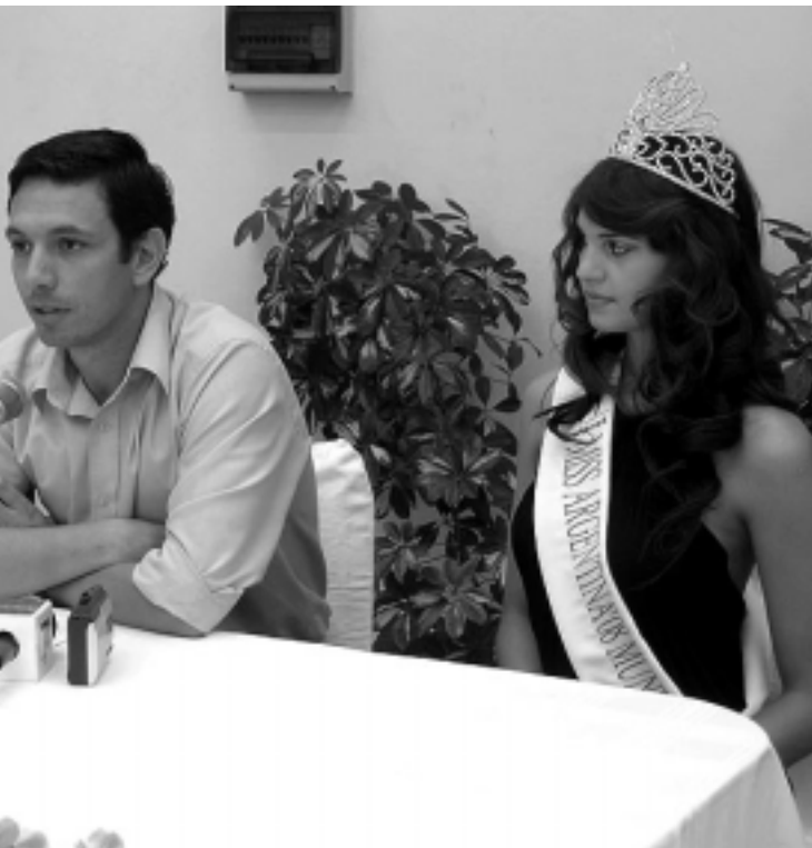
empresa «Entertainment», junto al subsecretario de Turismo de La Pampa y a la postulante de 18 años, nacida en Santa Rosa, 1,77 metros de altura y sus medidas: 87 - 60 - 90.