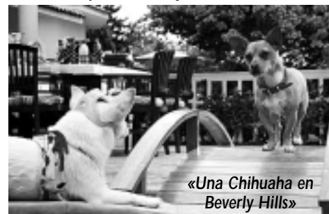
«Una Chihuahua en Beverly Hills»

«Mi hermano es hijo único»: Italia, 1961. El país sufre las agonías de una revolución social y económica. El rebelde Accio decide unirse a un partido neofascista para irritar a sus padres. Su hermano mayor, Manrico, es el principal líder local de la escena política de izquierda. Un conflicto de lealtad entre ambos hermanos se desarrolla. Sin embargo, ellos se darán cuenta de que quizás no sean tan diferentes uno del otro como creían. Con Elio Germano, Riccardo Scamarcio, Angela Finocchiaro. Drama. AM13 c/r. 105 min.