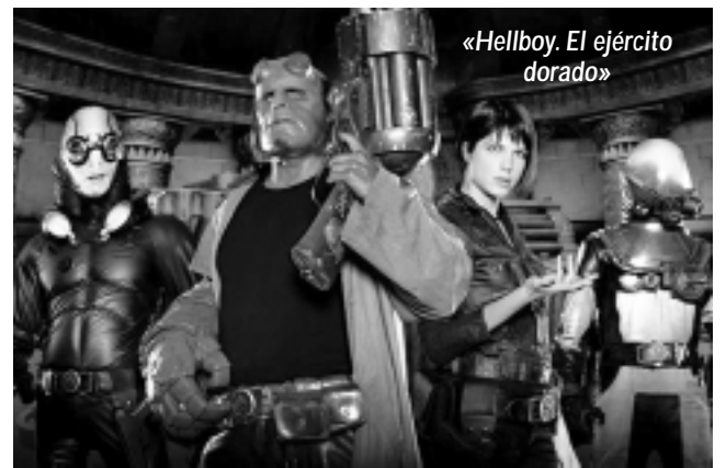
«Hellboy. El ejército dorado»

«007 Quantum of Solace»: La película comienza justo una hora después del final de Casino Royale. Tras la traición de Vesper, la mujer que solía amar, Bond decide rastrear la mente maestra que se encuentra detrás de la siniestra organización de White. Este seguimiento lo lleva a Haití, en donde se alía inesperadamente con Camille, una hermosa y pendenciera desconocida. Con Daniel Craig, Olga Kurylenko, Judi Dench, Gemma Arterton, Giancarlo Giannini y otros. Acción y suspense. AM13. 105 min.