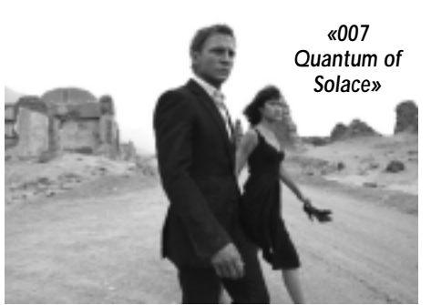
«007 Quantum of Solace»

«007 Quantum of Solace»: La película comienza justo una hora después del final de Casino Royale. Tras la traición de Vesper, la mujer que solía amar, Bond decide rastrear la mente maestra que se encuentra detrás de la siniestra organización de White. Este seguimiento lo lleva a Haití, en donde se alía inesperadamente con Camille, una hermosa y pendenciera desconocida. Con Daniel Craig, Olga Kurylenko, Judi Dench, Gemma Arterton, Giancarlo Giannini y otros. Acción y suspense. AM13. 105 min.