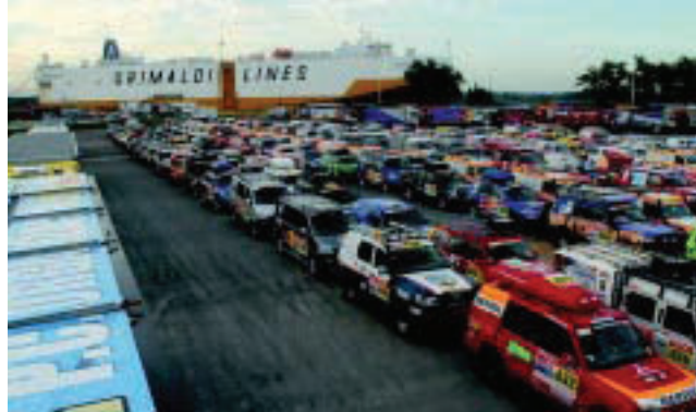
Entre las máquinas que arribaron al puerto de Zárate, en la provincia de Buenos Aires, se cuentan 710 vehículos de carrera (motos, cuadríciclos, autos y camiones), además de las camionetas y camiones de asistencia de cada uno de los equipos. También llegaron 60 vehículos de la organización y 50 de prensa.

Tras el desembarco en Buenos Aires la semana pasada, de la mayoría de los vehículos que competirán el «Rally Dakar Argentina Chile 2009», la euforia por la competencia crece en los medios y en las provincias involucradas, entre ellas, La Pampa, 1er Campamento de la carrera.