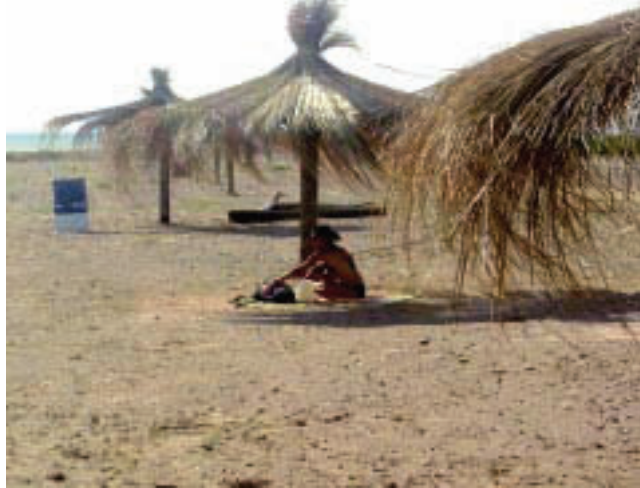
Como dijera Ripley: «aunque usted no lo crea». Imágenes como ésta van conformando una nueva realidad en la Villa Turística Casa de Piedra, tras el trabajo en la transformación del árido desierto pampeano.

Numerosas obras públicas están listas para ser inauguradas en la Villa Turística de Casa de Piedra como la Estación de Servicio, 4 viviendas de servicio de Pampetrol, 8 unidades habitacionales para municipales, el Vivero Forestal, la Unidad Operativa Policial e infraestructura de energía y agua para los nuevos terrenos.