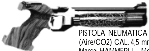
PISTOLA NEUMÁTICA (Aire/CO2) CAL. 4,5 mm. Marca: HAMMERLI - Mod. 480 Nro. de serie: 93-00071.