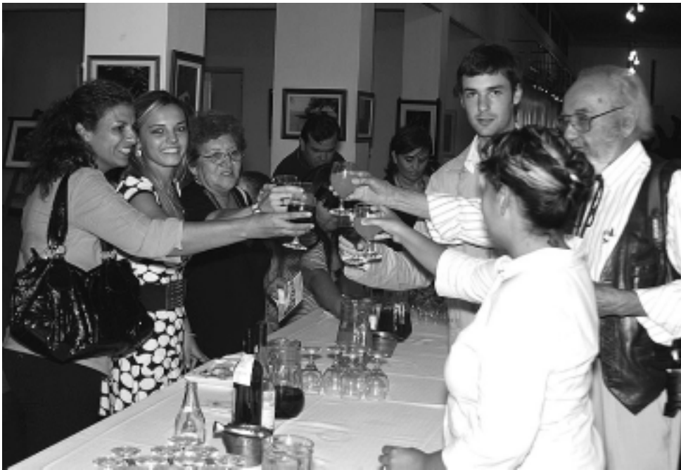
Momento del brindis en la inauguración de la exposición fotográfica que puede verse en el Centro Municipal de Cultura.

Finalmente dijeron que la Escuela de Fotografía de Yanes Studio necesita 50 profesionales para cubrir toda la provincia, con garantía de trabajo. Consultas personales en Alem 330, Santa Rosa. Para pedir entrevista, llamar previamente al tel: (02954) 414-333.