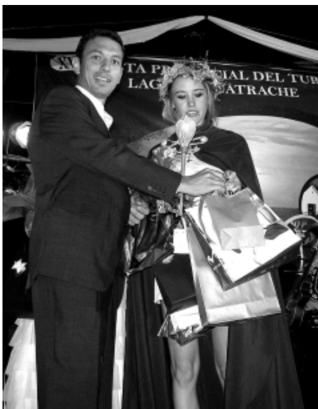
El subsecretario de Turismo, Santiago Amsé, entregando varios presentes a la flamante Reina del Turismo 2009, en el momento de la coronación.

El domingo 1º la fiesta continuó con la expo de los artesanos, los puestos de comidas, el disfrute de la pileta y el baile popular al cierre.