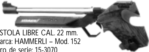
PISTOLA LIBRE CAL. 22 mm. Marca: HAMMERLI - Mod. 152 Nro. de serie: 15-3070