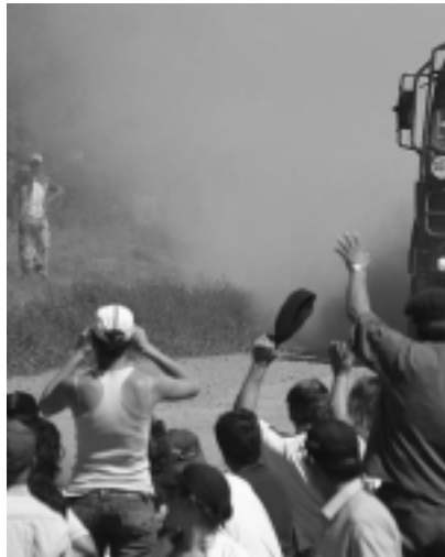
En La Pampa el público vivió el Rally como una fiesta, a varios miles de personas que colmaron las zonas que no pudieron ubicarse. El Campamento en el Parque Nacional El Comandante Riquelme atrajo la atención de todos los habitantes de Santa Rosa.

Los organizadores del Rally Dakar quedaron sorprendidos con los paisajes y el fervor del público en Argentina y Chile y dejaron la puerta abierta para que la edición 2010 se corra nuevamente en Sudamérica.