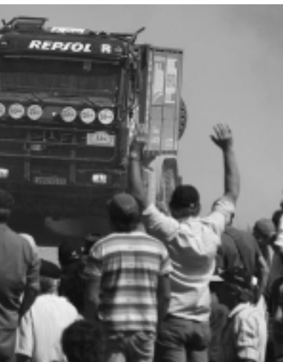
verdadera fiesta deportiva, que atrajo turísticamente zonas de espectadores y todo otro lugar donde de Don Tomás funcionó a la perfección y atrajo a que se acercaron para ver su funcionamiento.