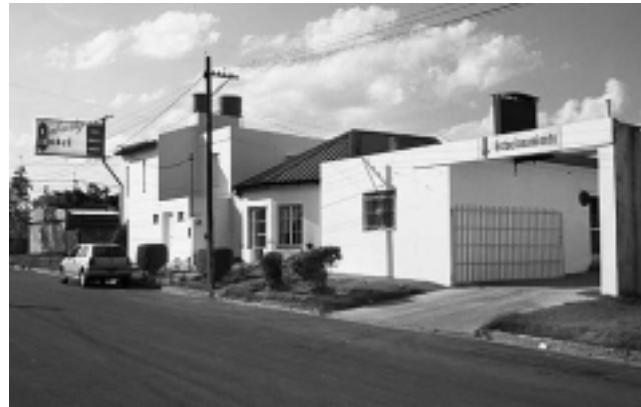
En la actualidad el hotel familiar dispone de 24 habitaciones, pero ya hay un proyecto de ampliación que espera el tiempo adecuado para iniciarse.