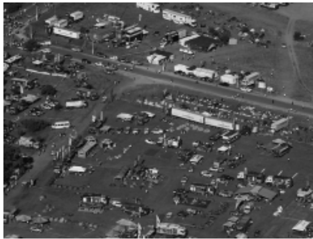
Imagen aérea del 1er Campamento Santa Rosa del Rally Dakar 2009.

Frente al éxito y al entusiasmo popular suscitado por el Dakar 2009 que se desarrolló por primera vez en Argentina y Chile, la organizadora de la prueba A.S.O. ha convenido con ambos gobiernos para llevar adelante la organización del rally en 2010