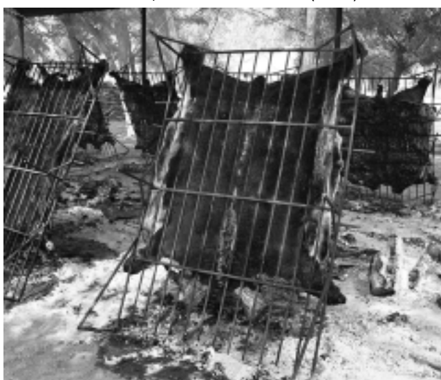
El almuerzo del domingo será asado con cuero y costillares. Una especialidad destacada de la cocina rural que ha distinguido los Encuentros de Quemú.