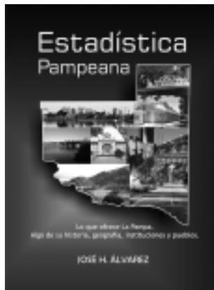
El nuevo libro cuenta con el sello «Ediciones Pitanguá».