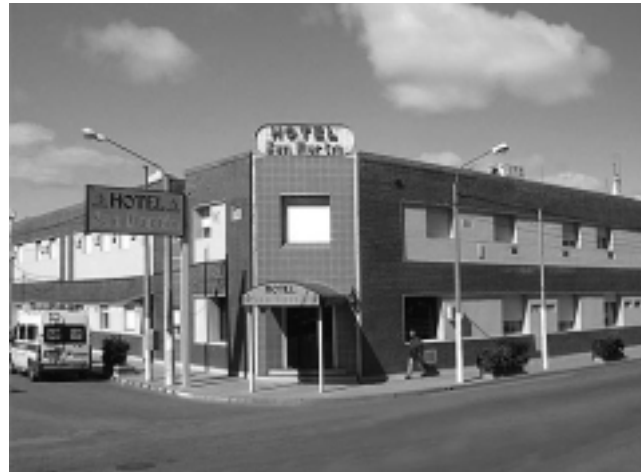
De aquellos primeros años de la capital del Territorio, tres eran los establecimientos que en ese entonces componían la oferta hotelera de Santa Rosa: el Hotel Comercio (Pellegrini y 9 de Julio, hoy conservado en manos del Banco de La Pampa), el Paris (Sarmiento y Pellegrini, demolido para convertirse en estacionamiento) y el Hotel San Martín, actualmente administrado por la familia Amsé y González.

Y como los requerimientos de alojamiento en la ciudad tienen amplia diversidad y buen futuro, tanto las inversiones hoteleras que se hacen en la periferia, como las programadas en pleno microcentro, sin duda serán exitosas. En este momento, a pocas cua-