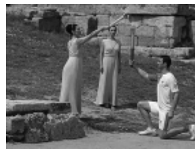
Representación en Olimpia, Grecia.

Durante estos juegos antiguos se hacían carreras a modo de competición, que se siguen haciendo hoy, pero en aquel tiempo no había ninguna de una distancia tan larga como los 40 y pico de kilómetros actuales. El Maratón, que hoy forma parte de una disciplina de