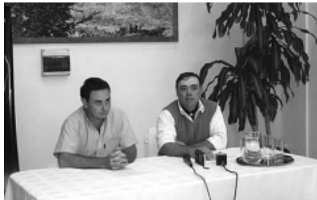
Marcoantonio y Fernández en conferencia de prensa en la SubseTur.

Este domingo 5, en el norte y el centro de la Provincia, habrá dos importantes fiestas criollas con jineteadas y folklore.