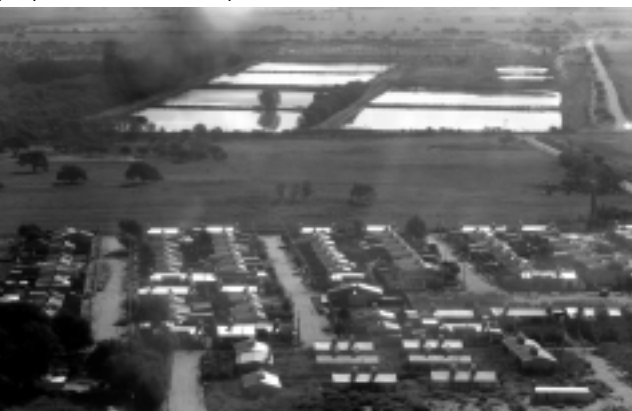
Las Piletas Sanitarias ya están muy cercanas a los barrios de viviendas. Aparte del mal olor, preocupan las napas contaminantes.