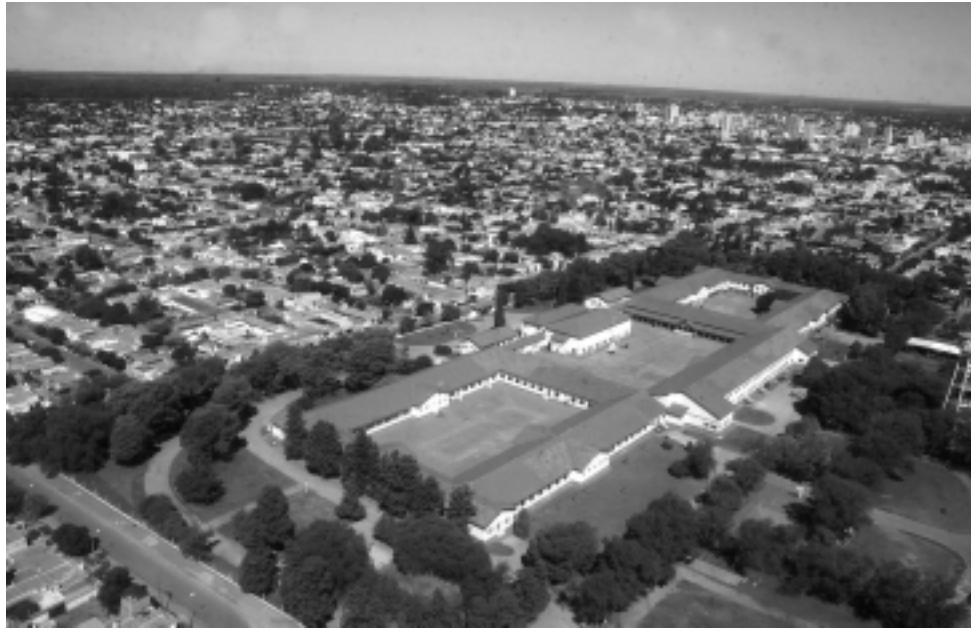
No es razonable que en una ciudad como Santa Rosa, haya quedado una hectárea dentro de la misma, a la que no se le de un mejor aprovechamiento, no por quienes usan el predio actualmente, sino por lo que se podría hacer allí.

El Parque Industrial mismo, pareciera lejos 30 años atrás y ahora está pegado a populosos barrios y hasta un nuevo hospital. El día que de verdad se radiquen las industrias y empresas de servicios derivadas (una deuda pendiente porque están diseminadas por toda