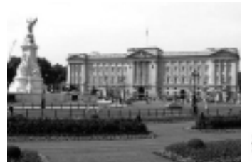
Palacio de Buckingham

Resultó entonces, que la distancia existente entre la meta prevista y los soportales del palacio (pórtico cubierto, un alero con columnas), sumaron un total de 42,195 km, distancia que permanece como oficial hasta nuestros días.