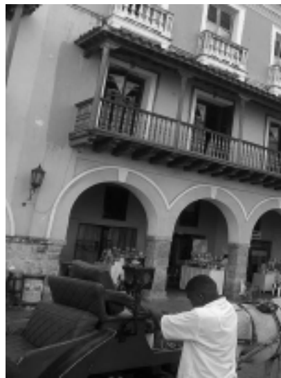
La ciudad respira sensualidad y las opciones se multiplican para escoger entre los planes de playa, buceo o, simplemente, de romance. Cartagena.