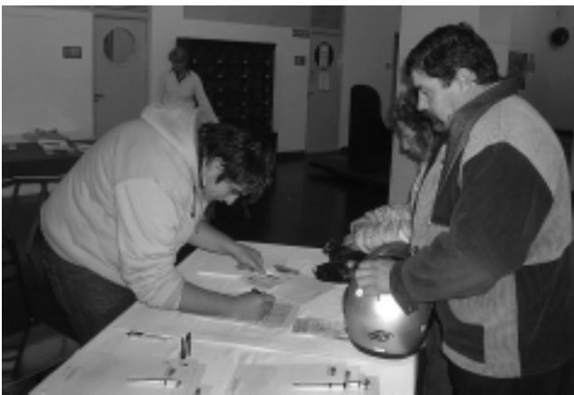
Más de 50 inscriptos tuvo el Seminario, entre hoteleros, agencias de viaje, de turismo rural, docentes, estudiantes, consultores y técnicos del Sector.

El Seminario «Marketing en Tiempos de Crisis», brindado por la Asociación de Hoteles de Turismo de la República Argentina, en forma conjunta con la Cámara de Turismo de La Pampa (CaTuLPa), fue auspiciado por el Club Hotel La Campiña, con la adhesión de la Subsecretaría de Turismo de La Pampa; la Subsecretaría de Cultura de La Pampa; la Dirección de Turismo Municipal de la Municipalidad de Santa Rosa y REGION® Empresa Periódica.