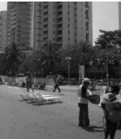
Disfrutar unos días románticos o disfrutar de una vida moderna. La historia se mezcla con la modernidad y lo típico de la cultura europea.

Con una temperatura media anual de 28° y tan sólo 2 metros sobre el nivel del mar, Cartagena es sinónimo de descanso y diversión. Sus plazas invitan a tomarse unos deliciosos cocktails y disfrutar de la música, junto a diversas alternativas gastronómicas que van desde recetas típicas cartageneras, hasta la cocina internacional.