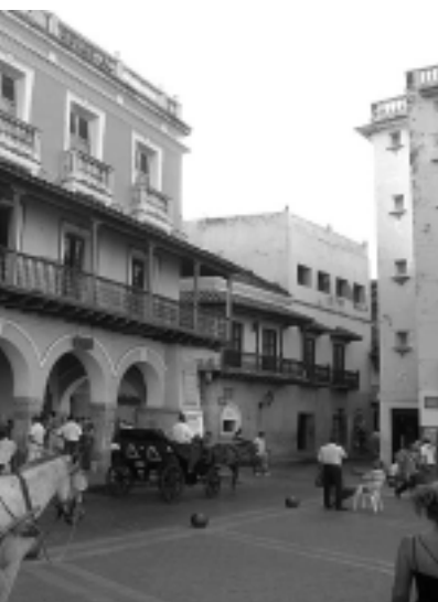
Se multiplican para el viajero. La hora es determinante para el snorkeling y los de restaurantes, bares, compras y compras. Cartagena es la joya del caribe colombiano.