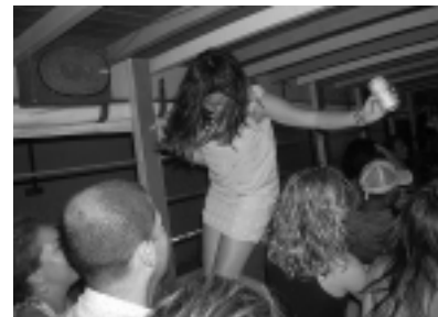
Paseo de «Rumba en chiva», música, mucha diversión y mucho ron a canilla libre.