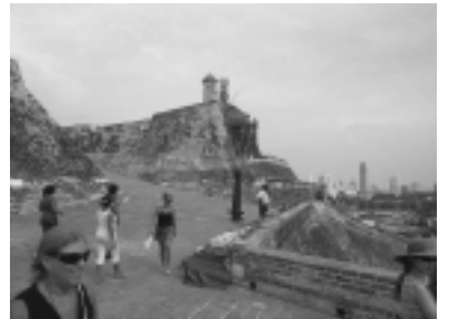
El Fuerte de San Felipe de Barajas, construido en 1657, aún perdura en todo su esplendor.