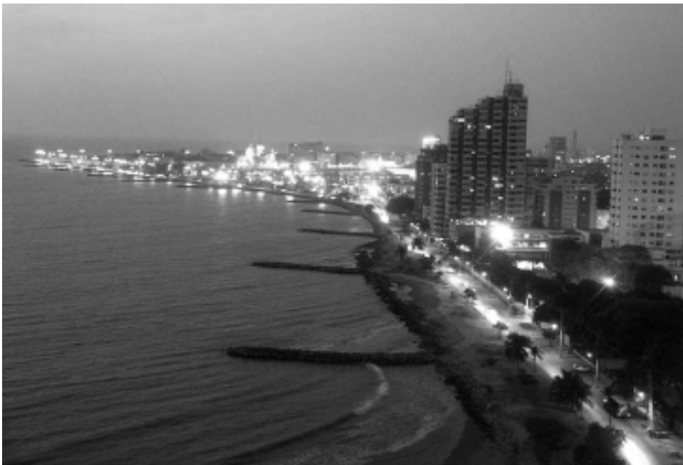
Enmarcada por una hermosa bahía, Cartagena de Indias es una de las ciudades más bellas y conservadas de América. Su temperatura media anual es de 28°. Cartagena es sinónimo de descanso y diversión. Cerca de la ciudad amurallada se encuentra un moderno sector turístico, Bocagrande, con amplias playas, hoteles, restaurantes y discotecas.

Cartagena fue sede del maléfico Tribunal de Penas del Santo Oficio de la Inquisición, alojó virreyes, fue arrasada y devastada, sufrió dramáticos bloqueos, tuvo un largo período de estancamiento y entrado el Siglo XX renació con la reactivación de su economía y dada su historia, sus leyendas y su excepcional legado edilicio de la Ciudad Amurallada o Ciudad An-