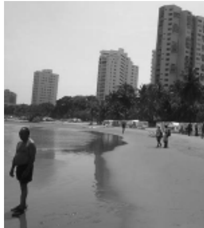
Cartagena de Indias es un destino ideal para pasar una noche inolvidable, un lugar mágico en donde la historia se confunde con la influencia.

Declarada por la UNESCO Patrimonio Cultural de la Humanidad en 1984, Cartagena de Indias suma a los encantos de su arquitectura colonial, republicana y moderna, los atractivos de una intensa vida nocturna, festivales culturales de renombre internacional, paisajes exuberantes, magníficas playas, excelente oferta gastronómica y una infraestructura hotelera y turística para todo tipo de presupuestos.