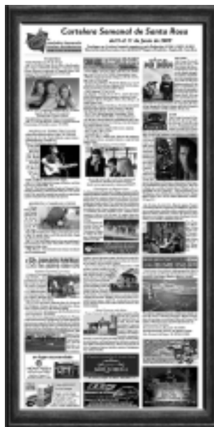
Cartelera Semanal de Santa Rosa, innovador servicio que la AEHGLP brinda a sus asociados para informar debidamente al turista.

También la Asociación brinda una gran asistencia informativa a los principales establecimientos asociados y a organismos oficiales como la Subsecretaría de Turismo provincial y Turismo de la Municipalidad de Santa Rosa, a través de la «Cartelera Semanal», una agenda impresa en color que se exhibe en cuadros de amplia dimensión, con la información de teatro, espectáculos musicales, exposiciones, museos, cine y lugares