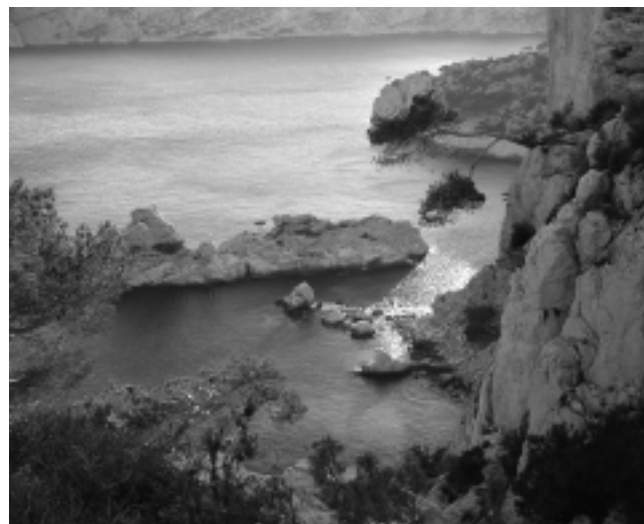
«Les Calanques», en las afueras de Marsella. Es la imagen de la típica postal de aguas turquesas, acantilados blancos y apartadas calitas -pequeñas playas y pozos profundos en medio de acantilados-, ideal para nadar y hacer snorkel.

Continuamos en esta edición con la 3ra Parte de la nota, cuya propuesta de viaje es recorrer una porción de Europa en auto, a partir del ingreso por Madrid, con una ruta bordeando el Mar Mediterráneo -sur de España y de Francia-, hasta atravesar Italia por el norte, llegando al Mar Adriático, en Venecia.