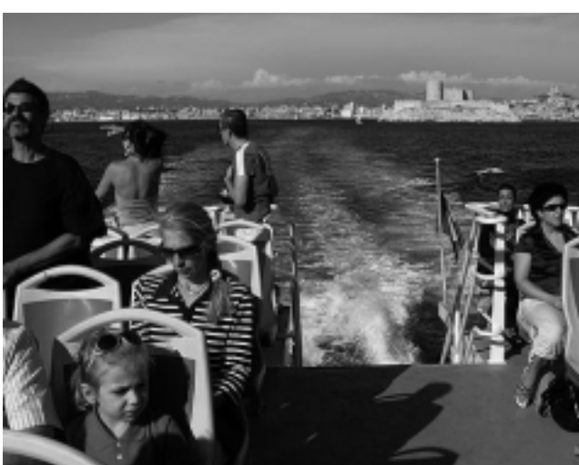
Los paseos en barco desde el «Vieux Port», tiene que estar en su agenda. En el fondo se aprecia la ciudad de Marsella y por delante la «Ile d'If», morada carcelaria del Conde Montecristo en la novela de Alejandro Dumas.

Con un día de tiempo, hay que visitar Les Calanques , en las afueras de Marsella. Es la imagen de la típica postal de aguas turquesas, acantilados blancos y apartadas calitas -pequeñas playas y pozos profundos en medio de acantilados-, ideal para nadar y hacer snorkel o submarinismo.