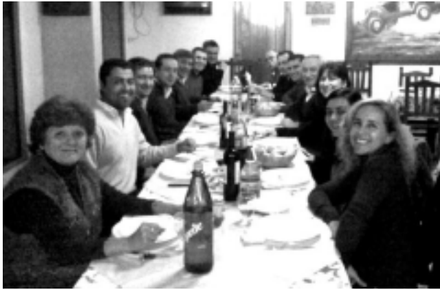
Gran parte de los arquitectos de General Pico no comparten la postura que persigue un grupo de colegas, con la intención de desprenderse del Consejo Profesional actual, el cual reúne a ingenieros, arquitectos y técnicos.