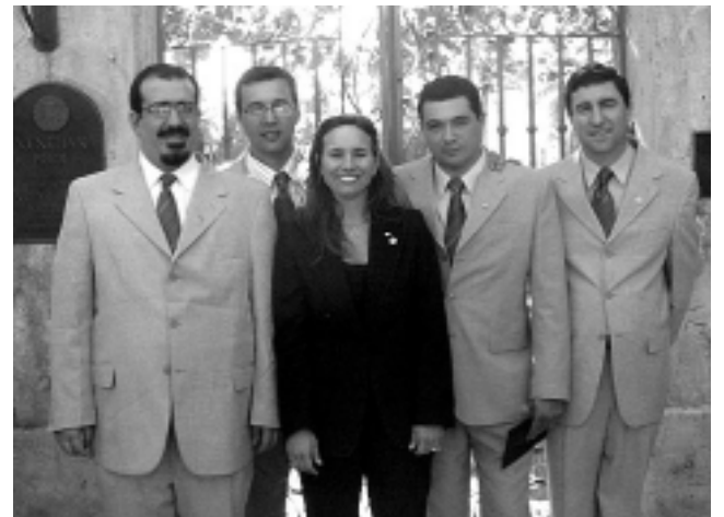
Grupo IGE (Intercambio de Grupos de Estudio) 2008 Florida y Bahamas.

Rotary International, la primera organización de servicio voluntario del mundo, abarca casi 33.000 clubes en más de 200 países y regiones. Su red internacional de socios está compuesta por líderes empresariales y profesionales que aportan su tiempo, dinero y conocimientos a fin de prestar servicio en sus comunidades y en todo el mundo.