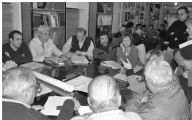
Uno de los objetivos es lograr la conexión del tren entre Santa Rosa y Toay y otro, activar el tren entre Santa Rosa, Buenos Aires y demás ciudades.

Una nueva reunión del proyecto «Tren para Todos» se realizó en la semana que pasó, donde están participando instituciones intermedias, funcionarios públicos y demás sectores de la sociedad.