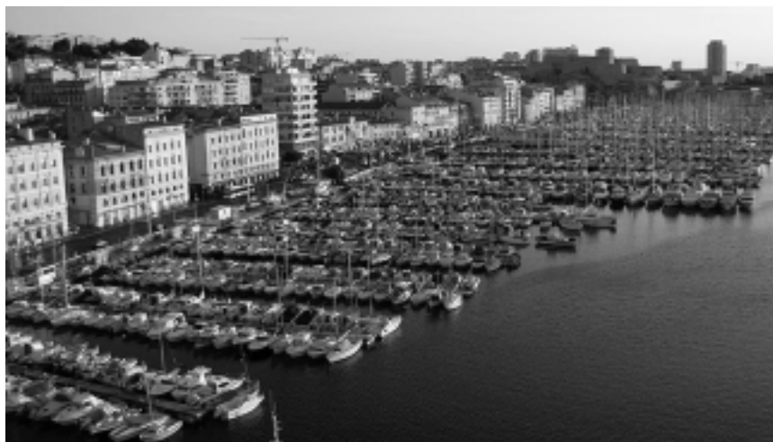
El corazón turístico se concentra en el «Vieux Port» -el viejo puerto-, poblado de miles de embarcaciones, desde donde parten barcos con paseos turísticos inolvidables.

En este recorrido podrá apreciar La Criée , el teatro construido en 1909; el impresionante Hotel de Ville -Ayuntamiento- del siglo XVII; el laberinto de callejuelas del Quartier du Panier , la parte más antigua; la Vieille Charité , conjunto de edificios antiguos donde se concentran varios museos; la Abadía de San Victor , del Siglo V; el enorme retrato de Zinedine Zidane , héroe futbolístico local; la Corniche , carretera costera que nace en el viejo puerto y la famosa iglesia Notre Dame de la Garde , que se encuentra en el punto más alto de la ciudad, entre otros sitios de interés.