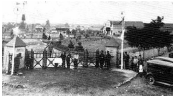
La foto superior muestra la entrada al predio rural de la Asociación Agrícola Ganadera en Spinetto y Gobernador Duval a principios del siglo pasado. En la foto inferior puede verse Spinetto, hace más de ocho décadas atrás, en el año 1926.