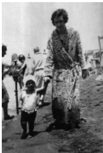
Paseos por la Rambla (1926). Se muestra la moda femenina playera que imperaba en esa época en las playas marplatenses

caminos, puentes y las logísticas de uso. De allí que las Conferencias de 1928 del ACA en Alta Gracia, la propiedad en Buenos Aires, por el TCA, para la creación de la Vialidad Nacional, y otras, cubrieron junto a la Dirección de Parques creada por Exequiel Bustillo, un impulso de gestión turística, que tuvo su remate el 11-07-42. Parques que dependía del Ministerio de Agricultura, dio cabida a la novel Institución, donde Bustillo creara las condiciones.