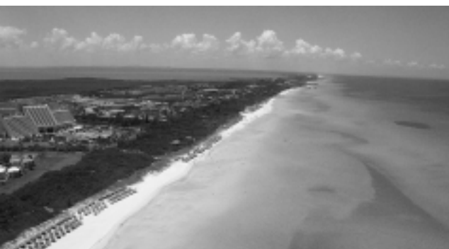
La variedad en los atractivos y excursiones en el exterior, donde el trato con el pasajero es excelente, marcan diferencias que el viajero sabe valorar.