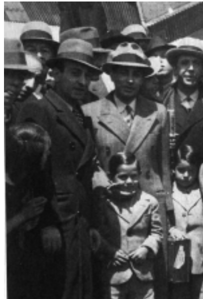
Carlos Gardel, el zorzal criollo, un ícono turístico. En la foto, el recordado cantante, músico y compositor. Le Pera y una persona de apellido...

La estructura hueca del Obelisco fue realizada por 157 obreros, fue revestido con piedra calcarea de Luis y como los movimientos del subte provocaban desprendimientos, fue cubierto con pintura látex.