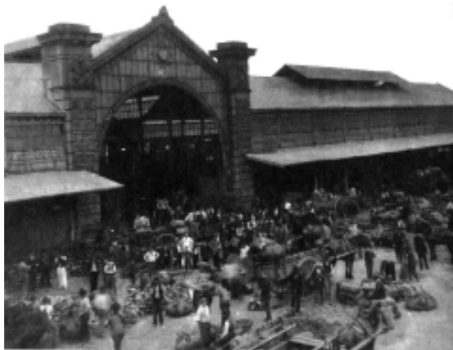
Primer Mercado de Abasto (1925). Fue inaugurado en 1893, donde los verduleros negociaban los productos del campo. Hoy en el mismo lugar se encuentra el shopping, lugar de encuentro del turista en Buenos Aires.

«En el Bicentenario de la Patria, 25 de Mayo de 2010, no sólo tendremos que recordar y reivindicar, la historia escolar conocida, sino que también, ser justos en la mirada al sector de los viajes, las postas, hospedajes, y casas de comida, que con distintas calidades y compromisos, hicieron posible, lo que antes