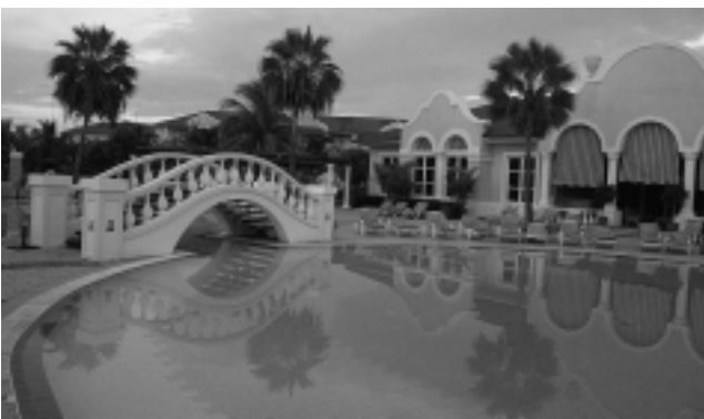
El Caribe sigue ganando adeptos no sólo por la bendita naturaleza, sino por el buen servicio hotelero. Los paquetes «All Inclusive», invento jamaicano ya popularizado, son algo así como un crucero en tierra, donde todo está previsto.

Y encima los costos, si bien son importantes, con creces merecen pagarlos. En plena temporada, una