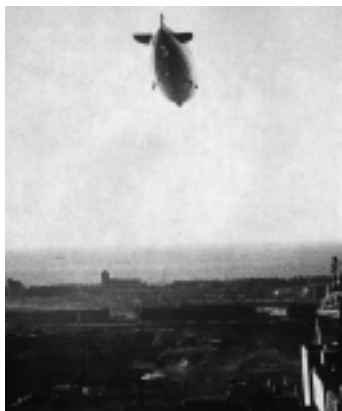
El Graf Zeppelin (1934). Este dirigible alemán de 235 metros de largo, pasó sobre Buenos Aires el 30 de junio de 1934 y aterrizó en Campo de Mayo, el interés de la gente fue tal que las autoridades decretaron ese día feriado.