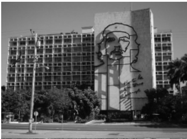
Una foto clásica de la devoción al Che Guevara. Su figura en el edificio del Ministerio del Interior, con vista a la Plaza de la Revolución José Martí.

El recorrido abarca el Centro Histórico de la Habana Vieja -declarado por la UNESCO Patrimonio de la Humanidad- y por otros sitios interesantes de La Habana moderna. Generalmente incluyen el Mirador del Morro, Plaza de San Francisco de Asís, Plaza Vieja, Plaza de Armas, Plaza de la Catedral, Feria de la Artesanía, un Recorri-