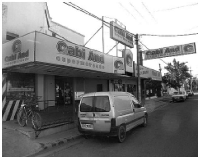
A media cuadra de donde se iniciaron, en la calle Tomás Mason, con una pequeña despensa, hoy el Supermercado «Gabi And» dispone de una amplia superficie cubierta y una sucursal en Av. Luro 65.

El supermercado «Gabi And» cumple este viernes 23 de octubre, 26 años de vida comercial.