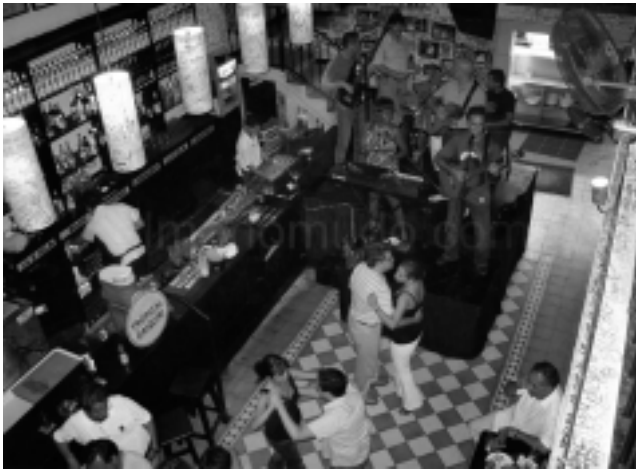
La Bodeguita del Medio, típico restaurante de La Habana vieja, donde se puede tomar un «mojito» con todo el sabor del Caribe. Ha sido visitada por escritores, actores y gente famosa desde los '50, quienes han dejado su impronta. Es sitio obligado de encuentro para todos los turistas que visitan la ciudad.

Mientras tanto el Malecón es el centro estratégico de La Habana, el Malecón es un punto de orien-