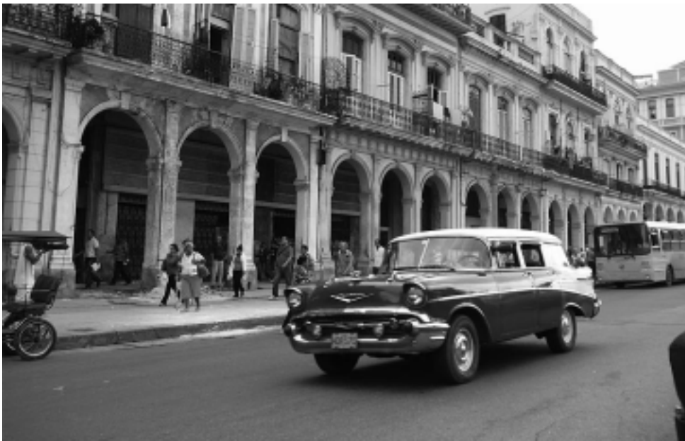
La ciudad de La Habana, capital de la isla de la República de Cuba, es cautivante y nostálgica. Una postal del pasado, un estandarte de la resistencia, una rebeldía hecha pueblo. La envuelve una mística que sin duda no durará para siempre. Conózcala ahora, con sus atractivos y sus hermosos desencantos, antes de que el consumismo la absorba definitivamente.

La Habana es el esplendor tropical, que reúne lo mejor de España, lo mejor de África y lo mejor de las Antillas. La Habana, con sus antiguos automóviles americanos, su bullicio, sus edificios en recuperación, su historia, su gente y sus ritmos, no lo dejará indiferente frente a ella.