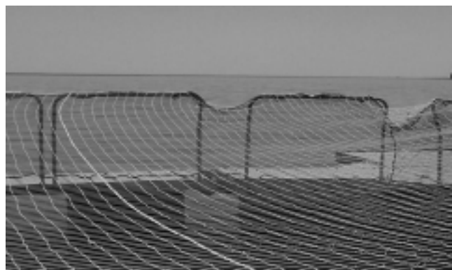
El Criadero de Truchas se ubica en el Río Colorado, a 41 kilómetros de la Villa, donde hay 50.000 ejemplares juveniles en producción, que son monitoreados diariamente para su correcto desarrollo. Los ejemplares traídos desde Puelén hoy alcanzan su tamaño juvenil y están en pleno proceso de engorde.

Utilidad de los terrenos El delegado del Ente Comunal, Alberto Ramón Campo señaló que los terrenos para la construcción de cabañas alcanzan los 2.800 metros cuadrados y se deberán construir 6 en cada uno de ellos. En cuanto a los terrenos para la construcción de viviendas familiares «podemos decir que van de entre 600 y 800 metros cuadrados