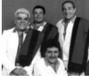
Sáb. 24 a las 23:30 hs: Los de Salta $ 5