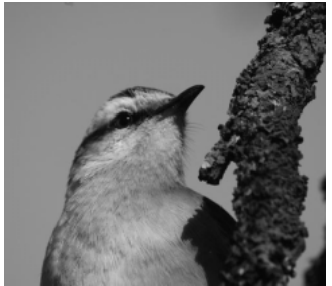
«Calandria», una de las tantas aves que pueden observarse en la Reserva.

En el marco del Festival Mundial de las Aves, la Subsecretaría de Turismo, en conjunto con la Subsecretaría de Ecología y la Dirección de Recursos Naturales, invitan a participar nuevamente de una salida a campo en la Reserva Natural Parque Luro, para conocer las especies de aves que habitan los diferentes ambientes de la misma.