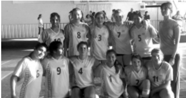
Clasificó campeón por 4ª vez consecutiva el Club Atlético y Cultural Argentino, en el Campeonato de Clubes Campeones que se realizó en Corrientes, con una campaña impecable ganando: a Ciudad 84/28; a FCO 94/71; a Judiciales 118/48; a Quimsa 116/42; a Regatas 114/54 y a Córdo-