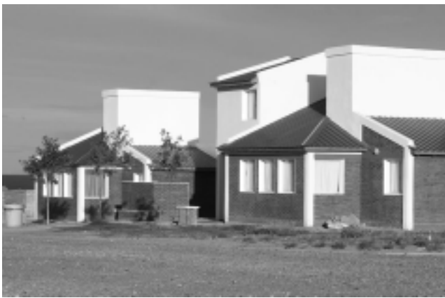
Tras la licitación de fin de agosto, ahora los adjudicatarios formalizaron la elección de terrenos, donde se construirán 36 cabañas turísticas en total. Actualmente, para el alojamiento turístico en la villa, está en funcionamiento el establecimiento «Cabañas de Piedra» (foto), confortables edificaciones con capacidad para 2, 4, 6 y 8 pasajeros, totalmente equipados con cocina, baño, tv satelital, cocheras, asadores, aire acondicionado, calefacción y lavadero. (Reservar previamente al 02954-1551-8841).

En la sede del edificio comunal de Casa de Piedra se realizó el acto de elección de 6 lotes para la construcción de 36 cabañas (6 en cada uno de ellos) y 13 terrenos para la construcción de viviendas familiares. Los terrenos corresponden a los dos actos licitatorios realizados en el Centro Cívico el pasado 28 de agosto, por ello el orden de elección mantuvo el orden de adjudicación.