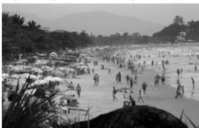
Ubatuba, a mitad de camino entre Ilha Bela y Angra dos Reis, con más de 80 playas de aguas cristalinas, en temporada recibe medio millón de turistas.

En el trayecto además, pasaremos por hermosas cascadas -cachoeiras- al costado de la ruta, impregnada de flores alegrías del hogar, que seguramente obligarán a una parada para sacar fotos y quizá también degustar una calabresa con queso, el choripán carioca.