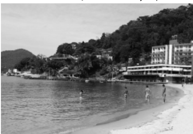
Lo mejor para alojarse en el continente son las 'pousadas' que dan a las playas. Aunque no son muy económicas, están bien equipadas.

Angra dos Reis es considerada una de las regiones más bellas del mundo, con un mar calmo, aguas