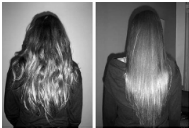
«Antes y después» con el sistema CHI de alisado no tóxico.