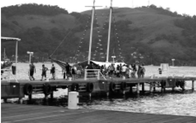
Angra dos Reis es la puerta de acceso a unas 365 islas con más de 2.000 playas, lo que hace que las excursiones de navegación sean obligadas.

Desde el muelle es fascinante subirse a un escuna -velero clásico de brasil-, para ir mar adentro de-