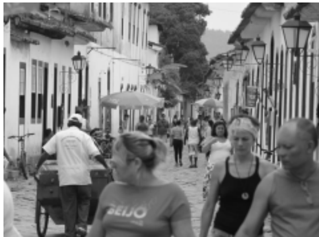
Centro histórico de Paraty, ciudad antigua fundada a mediados del siglo XVI, con calles empedradas -sin autos-, casas coloniales que permanecen intactas, en un entorno bien turístico, con muchos lugares de comida, bares y tiendas.

En la primera parte de esta serie, nos dedicamos a recorrer la ciudad de San Pablo, punto de partida de esta propuesta de viaje por el Sur de Brasil.