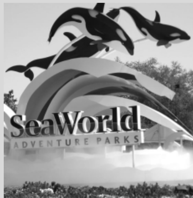
SeaWorld Orlando, una de las atracciones más visitadas.

La cantidad de Argentinos llegados a los Estados Unidos de acuerdo a las últimas estadísticas suministradas correspondientes al mes de septiembre de 2009, registró un 3.9% de aumento en relación a ese mes de 2008.