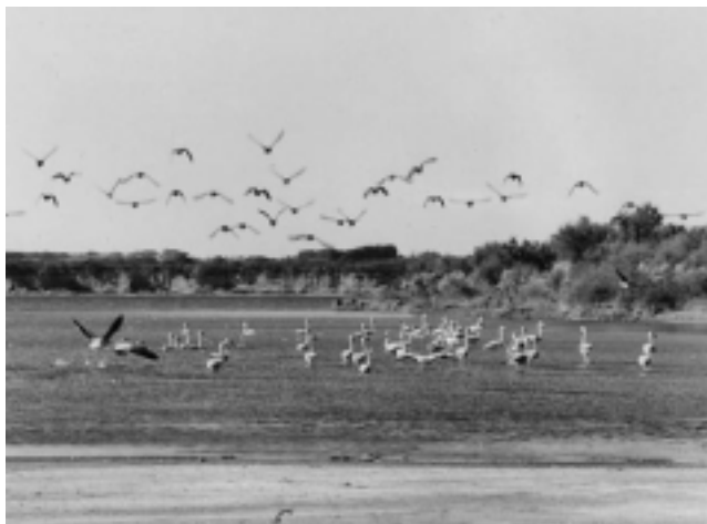
Foto de archivo de la Laguna de Guatraché, en el Parque Recreativo Samuel Novick. En la actualidad hay poca agua, debido a las sequías.

VIENE DE TAPA La jornada del domingo 20, cuando se lleve a cabo la presentación oficial del lanzamiento de la Temporada de Verano en la Laguna de Guatraché, será a las 19 hs. en el Parque Recreativo Samuel Novick y finalizará con un gran baile popular que contará con la actuación de Mauro y su banda, de la provincia de Santa Fe.