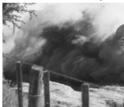
A la salida del Parque Don Tomás en la edición 2009.

En el momento de inicio de las celebraciones del bicentenario de las dos naciones, Argentina y Chile estarán representados tres veces más que el pasado año con participantes capaces de dar una buena sorpresa.