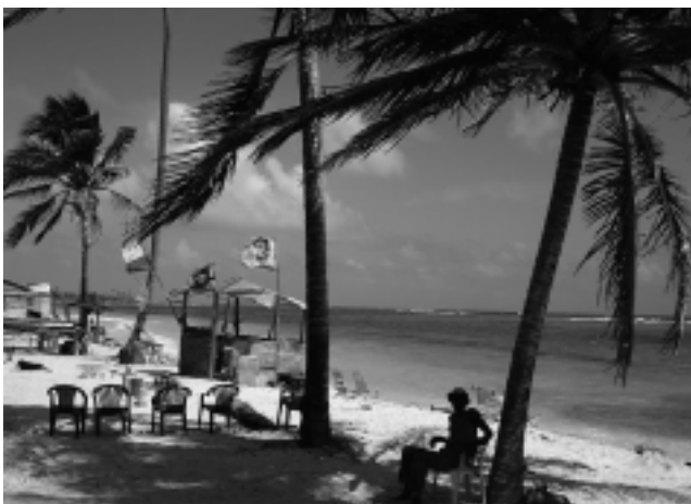
La Isla de San Andrés, Colombia, junto con Caratgena de Indias, es un paquete exquisito en playas, paisajes y lugares inolvidables.

Costa Cruceiros para las salidas del 28 de febrero y el 7 de marzo desde Buenos Aires, con destino a Angra dos Reis, Ilhabela, Punta del Este y regreso a Buenos Aires, por 7 noches pensión com-