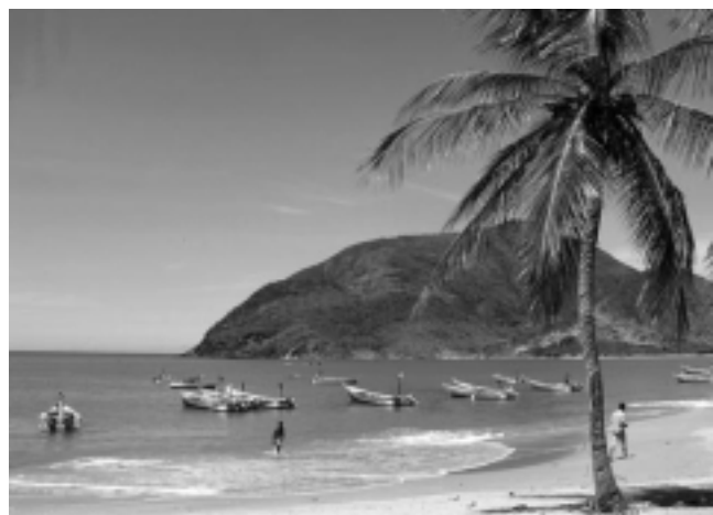
El gobierno de Venezuela le está dando un fuerte impulso al turismo. Para ir a Isla Margarita, los argentinos no necesitan Visa y la oferta de vuelos es muy amplia con precios convenientes y muy buena financiación.

Todos los valores que señalamos son actuales del mercado turístico y están vigentes. Para más información, consulte con su Agente de Viajes.