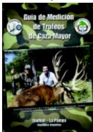
Fue presentada la «Guía de Medición de Trofeos de Caza Mayor».

La organización demostró buen trabajo en los preparativos y acertadamente agilizó la entrega de medallas y premios, todo con la