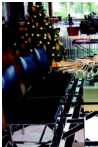
Aprovechando los adornos que no se han colocado alguno de los mejores adornos que nos brinda las bayas rojas, ramas de canela, castañas, nueces. mesa del comedor, a la mesa del hall de entrada,

Elementos: árbol, pesebre, muérdago en las puertas, botas para colgar en la pared son los indispensables. Un detalle muy original son los crackers para las mesas. Es un adorno típicamente inglés que consiste en unos tubos envueltos de papel decorado en forma de grandes