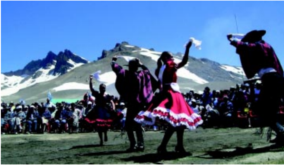
Del jueves 4 al domingo 7 de febrero, se celebrará en el hito fronterizo Valle del Campanario, el «50° Encuentro Binacional Paso El Pehuenche». Recién a partir de ese fin de semana podría quedar habilitada la ruta.

Sucedo que en ambos países se trabaja agitadamente para poder cumplir con el compromiso tomado por las presidentes Bachelet y Fernández, para dejarlo inaugurado en 2010, año del Bicentenario y esta época -sin nieve- es ideal para poder avanzar en obras.