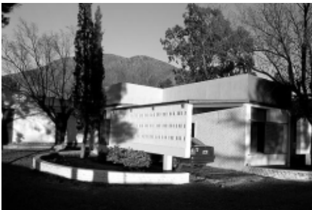
Ex Motel del ACA en la localidad de Lihuel Calel.

Resulta gratificante ver que finalmente, el Gobierno de La Pampa avanza en la ejecución de los trabajos de remodelación de la estación de servicio de Santa Isabel, principal ingreso turístico de la zona de Cuyo a La Pampa, con intenso tránsito que se refleja a diario por las rutas provincial 10 y nacionales 143 y 151.