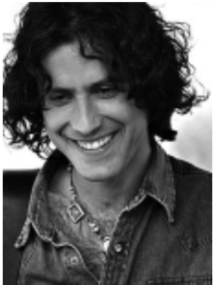
-Sáb. 25 a las 23:30 hs: «Coti Sorokin», $ 10

• CMC: Quintana 172 Tel: 455324 Galerías: -Vie. 18 a partir de las 19 hs: Muestra de los Talleres del Centro Municipal de Cultura. Gratis. • Museo Prov. de Historia Natural: Quintana 116. Tel: 42-2693. Lun.-vie. de 8 a 13:30 y de 14 a 18 hs.; Dom. 18 a 21 hs. Gratis. • Museo Provincial de Artes: Villegas y 9 de Julio. Tel: 427332. S. Rosa. Vis. guiadas. Lun.-vie. 8 a 20. Sáb.-dom. 18 a 21:30 hs. Gratis. -Expo "Pasajes", obras de colección de la Pinacoteca del Museo Provincial de Artes y "Nuevo Textil" con la participación de 23 artistas de todo el país. Gratis. • Estancia «La Malvina»: Parque Don Tomás. -Lun. a vie. 8 a 19 hs; sáb, dom, y feriados 10 a 12 y 15 a 19 hs. Visitas guiadas llamar al: Tel. 43-6555. Gratis. • «Olga Orozco» - Toay: Av. Reg. 13 de Caballería 1102. Tel: 49-2214. Mar. a vie. 9 a 17 hs. Fin de semana 17 a 20 hs. Visitas guiadas. Gratis. • Cívico Militar - Toay: R.S. Peña y 9 de Julio. Tel: 49-8060. Lun. a vie. 9:30 a 12 y 15 a 18:30 hs. Visitas guiadas. Gratis. • Policia «Comisario Antonio»: Belgrano 140. Tel: 43-3551. Lun. a vie. 9 a 13 hs. Gratis.