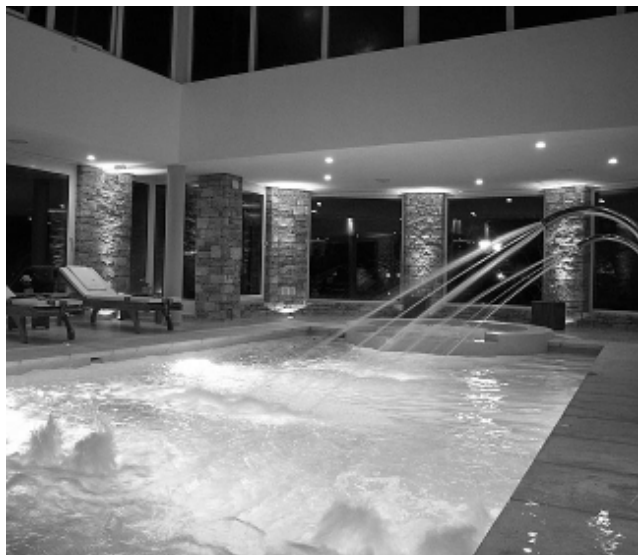
La última incorporación de servicios fue la inauguración en 2010 de un moderno Spa Premium, único en el país por su entorno.

«La Campiña Hotel Club & Spa», el complejo turístico más importante de la provincia, cumple este domingo 20 de febrero, 23 años de actividad del Club La Campiña y 13 años de vida del Hotel Club. Ubicado en la Ruta Nacional N° 5, en la puerta misma de la Pata-