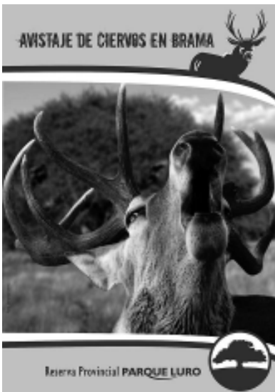
Nueva folletería de la Secretaría de Turismo sobre la Temporada de Brama 2011 del Ciervo Colorado en La Pampa, que será distribuida en los próximos eventos.

-También en el marco de los Festejos del Centenario del Castillo