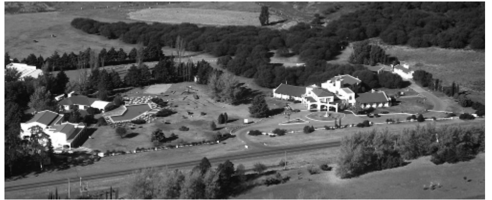
«La Campiña Hotel Club & Spa» da la bienvenida al viajero proveniente de las grandes urbes, con su pacífico entorno en un predio que atesora un monte de caldenes nativos, que le da una fisonomía única e inigualable.

En la primer década desarrollaron el Club House, en la segunda década se concentraron en el hotel 4 estrellas y la tercer década la iniciaron con el Spa.