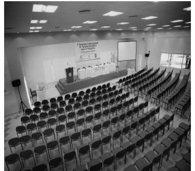
Varios salones que se modulan para cada necesidad, distinguen a «La Campiña» que ha hecho especial incapié en este segmento, donde hoy se destaca, como el hotel de mayor capacidad para realizar eventos.

El servicio está dirigido a los pasajeros, pero también al público de Santa Rosa y zona.