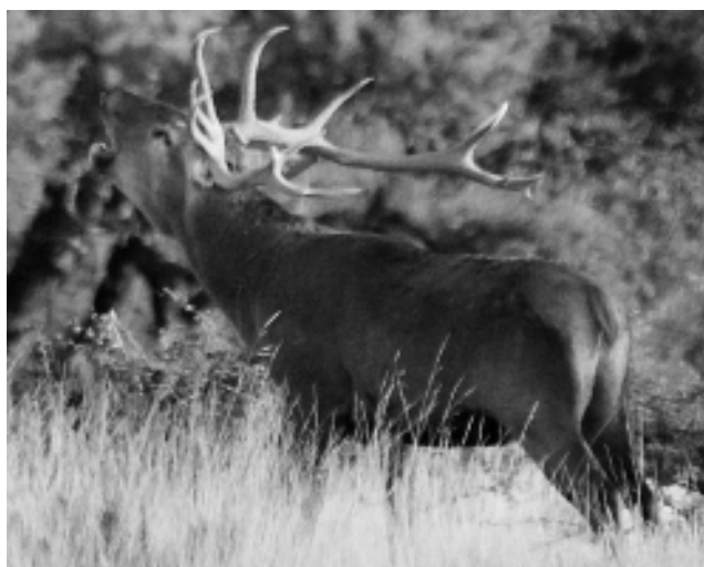
En la primer salida del año de Avistaje, este hermoso ejemplar macho con 14 puntas de cornamenta, posó a la vista de todos los que quisieran sacarle una foto. ¡Lo habrá contratado el Concesionario o fue suerte nomás...?