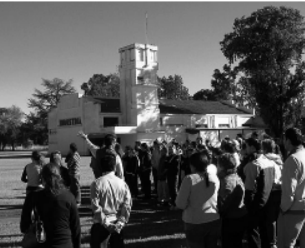
Hubo una jornada preparatoria en el predio de la Sociedad Rural de Pico.

La organización del evento el "Asado más grande del mundo", destinado a figurar en los registros de récords Guinness, realizó la semana pasada una jornada preparatoria y de simulacro, en el predio de la Sociedad Rural de General Pico, donde habrá de desarrollarse, donde participaron numerosas instituciones del medio que se han sumado a esta realización, junto a la municipalidad local y el Frigorífico Pico (que este año arriba a su 30° aniversario). Recorrido el predio, fueron definidos los sectores que ocuparán las parrillas, las cantinas y los es-