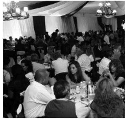
A salón lleno se desarrolló la Fiesta de la Caza

El costo por persona será de $ 45 para la guiada solamente; $ 50 para la guiada con desayuno in-