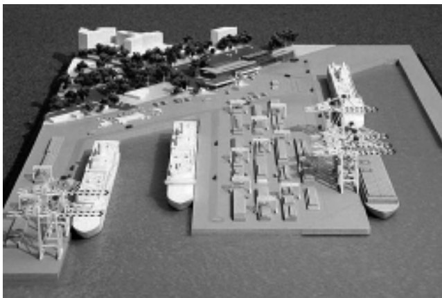
La nueva Terminal de Cruceros es la más importante de Suramérica.

La presidente Cristina Fernández se manifestó «muy contenta» al inaugurar la Terminal de Cruceros «Quinquela Martín», la que - señaló- será «la terminal para cruceros más importante de América del Sur, con una inversión de más de 90 millones de pesos». «Significa un estímulo muy importante para el turismo. Cada pasajero de crucero genera 7 puestos de trabajo en la Argentina. Además es un pasaje que gasta por sobre la media, unos 300 dólares por sobre los 106 dólares de la media», explicó.