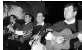
-Dom. 20 al mediodía: Show en vivo con «Los Trovadores Pampeanos». Picada regional con asado al asador. $ 65. Reservas: 415649

• Teatro Español: Lagos 44 -Sáb. 19 a las 22 hs: Javier Malosetti presenta su nuevo disc. $ 40, $ 50. -Dom. 20 a las 20 hs: Vermilion Mix 60x60. Espectáculo multimedial por primera vez en Argentina. Gratis.