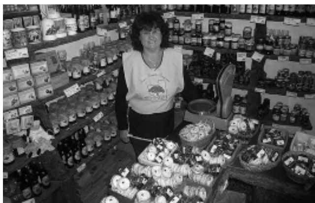
Las exquisitices de «Kiyen Witrú» recorren el mundo, ya que son un souvenir gastronómico que los turistas eligen especialmente. Calidad, buen gusto, innovación, caracterizan la producción casera que satisface el paladar de los pampeanos y de todos los que visitan nuestra provincia.

Si uno va por Av. Luro, entre Av. San Martín y Lisandro de la Torre, más precisamente al N° 480, se encuentra con un pequeño local, que por sus características te invita a entrar. Una vez allí tus sentidos de la vista y olfato harán que tu sistema digestivo comience a funcionar; ya sea que te atraigan los dulces o los salados. Se trata de «Kiyén Witrú», su nombre significa «Luna de Caldén» en lengua mapuche y se puede encontrar en este lugar, gran variedad de alfajores, bocaditos, dulce de leche, chocolatería, mermeladas, jugos, quesos de oveja «Pampinta», ahumados de ciervo y jabalí, escabeches, salames y mucho más.