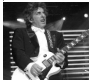
-Sáb. 19 a las 23:30 hs: Los Tipitos $ 20

junto al cantautor solista Cucu Howes. $ 10 • Casino Club Santa Rosa: Ruta 5 Km. Tel: 45-4794. Entrada $ 3, antes de las 19 después: -Vie. 18 a las 23:30 hs: Grupal Utopía $ 5