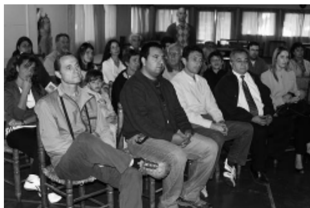
Charla introductoria a cargo de los técnicos que harán las guías.