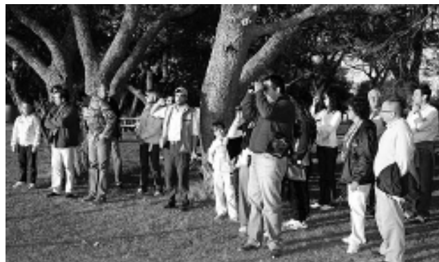
Ya hay mucha actividad de brama en la Reserva, se estima que será una buena temporada de avistaje a juzgar por lo que pudimos apreciar personalmente.

diendo el regreso se pudo apreciar olores y sonidos, agudizando todos los sentidos. El cierre fue con un exquisito asado al asador y show musical. Un programa para disfrutar a pleno. Reservas al tel: (02954) 41-5649.