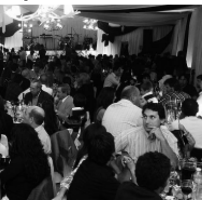
En Quehué, con cañilla libre, shows y baile.