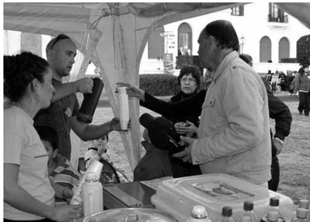
Una movida excepcional, que de la mano del sector Turismo conmovió a los presentes. La empresa Chevallier transportó gente gratis, la Asociación Hotelera convocó a los pasajeros alojados, el concesionario gastronómico de la Reserva obsequió chocolate caliente a todos los presentes y hubo muchas más colaboraciones.