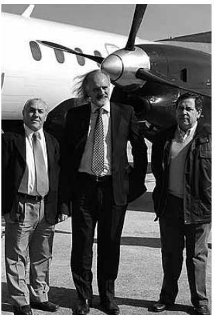
Vuelo inaugural de SOL a Gral. Pico.

Denuncian a la aérea SOL los aeronavegantes