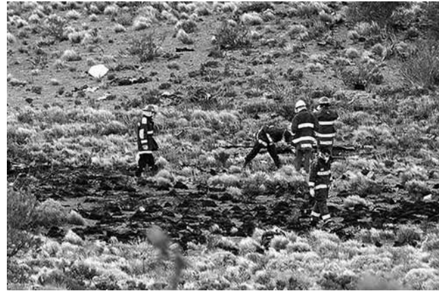
Tras conocerse la noticia de la caída de un avión de la línea aérea SOL en Río Negro, las consultas por aerofobia aumentaron notablemente en la sede del Centro de Estudios Especializados en Trastornos de Ansiedad (CEETA).

He aquí algunos tips para aquellas personas que no reciben tratamiento actual para superar el miedo a volar y deben viajar de igual modo (debido a razones de tipo laboral, familiar, salud, etc.): • Prepare el equipaje con tiempo, para evitar estresarse • Procure descansar adecuadamente antes del viaje • Es aconsejable ingerir pequeñas y frecuentes colaciones de hidratos de carbono hasta tres horas antes del vuelo, dado que disminuyen el nivel de ansiedad (pizza, arroz, dulces, etc.) • Evite mirar a través de la ventana. Esto podría aumentar la ansiedad • Evite el alcohol y grandes cantidades de comida durante el vuelo. • Camine cada tanto tiempo por el avión, para prevenir el "síndrome de la clase turista" (trombosis