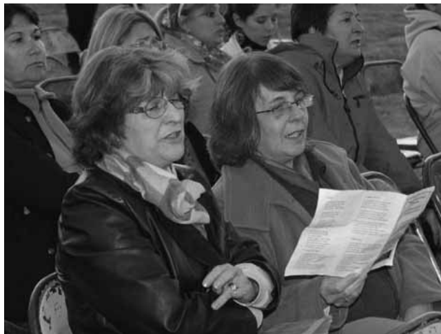
El buen gusto, la refinada elección de los artistas, lo acertado del repertorio, el lugar... fueron perlas de un collar que brilló de manera especial, donde el público fue invitado a participar y lo hizo con muy buena respuesta

Así de esta manera, la historia, la cultura, lo natural y el deporte se unieron en la Reserva Provincial Parque Luro para ser anfitriona y participe de este particular evento.