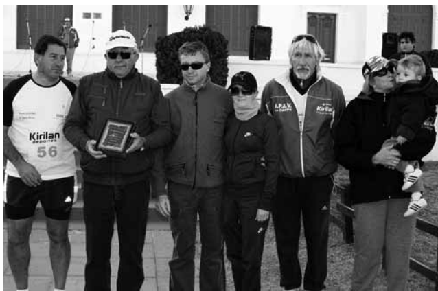
La APAV distinguió con una plaqueta a "Kirilan Deportes" por su apoyo.

la empresa de transporte Chevallier, un importante número de personas pudieron asistir al evento y disfrutar de un espectáculo único rodeado de naturaleza. Por último, y como se venía realizando en los eventos anteriores, al finalizar el concierto se abrieron las puertas del Museo "El Castillo" para que el público presente pudiera realizar una visita al interior del mismo.