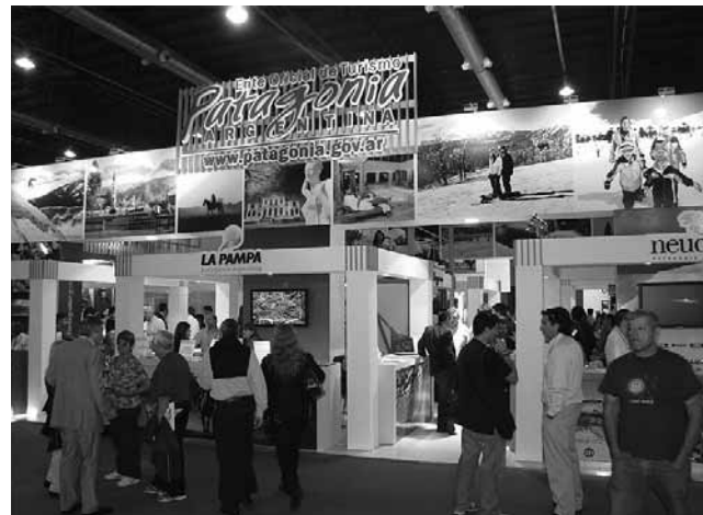
Stand de la Región Patagónica en la feria de Invierno 2011, con una muy buena ubicación del escritorio perteneciente a la provincia de La Pampa.

Agrupadas en el espacio del Ente Patagonia Argentina, ubicado al ingreso de la feria, las provincias patagónicas presentaron su oferta turística invernal al público visitante. Durante tres días del pasado fin de semana, la provincia de La Pampa participó en la primera edición del Salón Internacional de Turismo de Invierno que se desarrolló en La Rural de Buenos