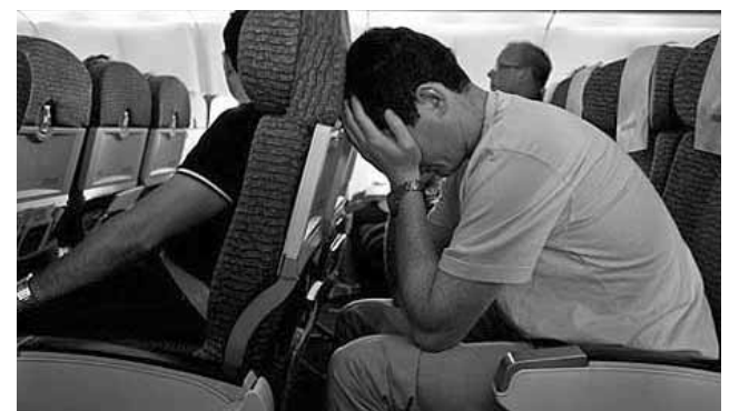
La aerofobia o miedo a volar, es un temor intenso a volar en avión. Según el nivel de intensidad del mismo podría impedir que el individuo vuele o lo haga a un costo muy alto. Los síntomas son malestar psicológico (ansiedad) y físico (como taquicardia, sudoración, sensación de falta de aire y desesperación por querer bajar del avión).

Colaboración: Centro de Estudios Especializado en Trastornos de Ansiedad www.quasarcomunicacion.com.ar/ceeta