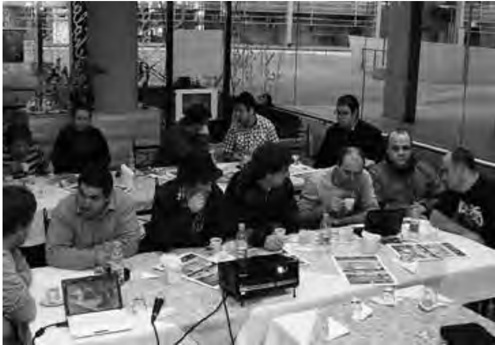
La semana pasada se llevó a cabo en Santa Rosa, el anunciado “Seminario de Cocina para Torneos”, con muy buena participación de profesionales del medio. El lugar de clases fue el restaurante “Schola Brunch & Delicacies”, ubicado en la confitería del Centro Judicial Santa Rosa, en las avenidas Perón y Uruguay.

Se trataron distintos temas como la creatividad como disparador, la diversidad de técnicas aplicadas a distintos productos, concepto de plato, planificación, estudio, prueba, producto final, puntos de cocción e impacto visual.