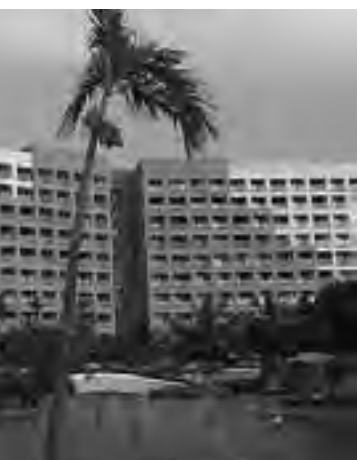
Construcción en las inmediaciones del Dique 1 de los ríos del continente americano. Con el nombre de Dique 1, se proyecta abrir en 2013.

"Buenos Aires es el destino argentino que mejor ha desestacionalizado su demanda, y esto, a partir de un minucioso trabajo de calendarizar su oferta de eventos y actividad cultural del año", dijo Lombardi a La Nación. El funcionario agregó: "Esto es un elemento estratégico en la atracción de inversiones en el turismo y en la decisión de los inversores de elegir la ciudad de Buenos Aires". La inversión en turismo desde 2008 hasta 2010 habría tenido un crecimiento del 133%, al haberse sumado unos u$s 1.124 millones en construcción de hoteles.