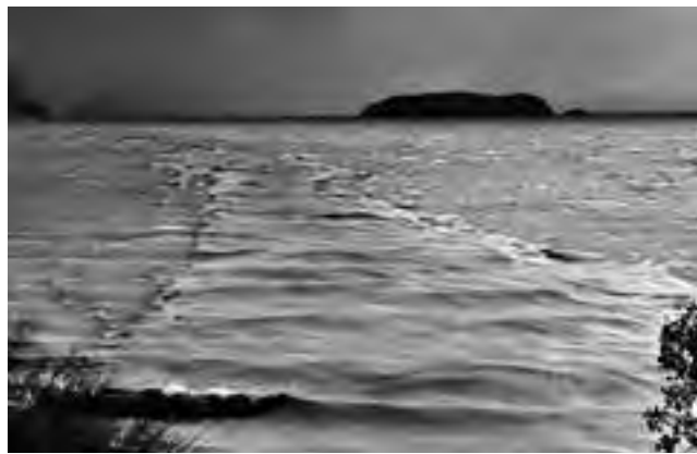
cenizas flotando en el Lago Nahuel Huapi, isla Huemul. El turismo en la Patagonia está en crisis a partir de la erupción del Volcán Puyehue.

Las autoridades turísticas patagónicas agrupadas en el Ente Patagonia Argentina fueron recibidas la semana pasada en el Ministerio de Turismo de la Nación donde el secretario de Turismo, Daniel Aguilera, puso en conocimiento que la presidente de la Nación dispuso la conformación de un comité de contingencia de ministros entre los que se encuentra el ministro de Turismo, Carlos Meyer, lo que significa una oportunidad para canalizar las necesidades de otras áreas de gobierno vinculadas con esta crisis que trasciende el