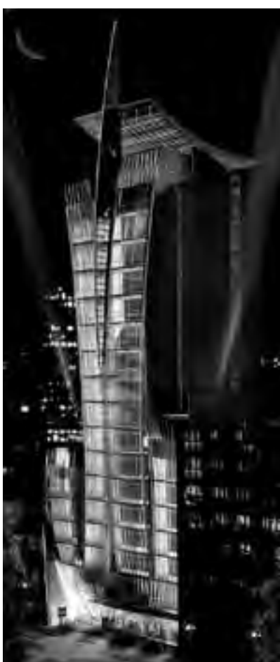
La firma Design Suites abrirá en 2012 el Hotel Boca Juniors en la calle Tacuarí, en San Telmo. Será el primer hotel temático de fútbol construido en el mundo. El edificio, ultramoderno, fue diseñado por el prestigioso arquitecto Carlos Ott.

Mientras que otra "sucursal" del prestigioso hotel, el Alvear Hotel y Residence, que se levantará en Puerto Madero, tendrá 150 habitaciones, dos restaurantes, business center, parque con pileta, bar, solárium y dos pisos de health club con piscina climatizada. La inversión estimada es de 75 millones de dólares y abrirá en 2013.