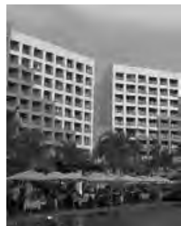
La cadena Mansions of the Word anunció la construcción del primer hotel seis estrellas Mayan Resort Buenos Aires y una inversión

También se consolidará en los próximos meses un fenómeno bien porteño: el explosivo crecimiento de los hoteles boutique. Se calcula que un tercio de los 36 hoteles que se estrenen pertenecerán a esta categoría. Los hoteles