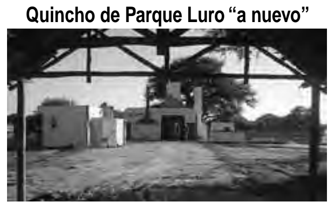
Quincho de Parque Luro "a nuevo"

Como se ve en la foto, del viejo restaurante de la Reserva Provincial, conocido como "Quincho de Parque Luro", no queda nada, ni techo ni paredes. Es que la obra encarada en estos días, tiene previsto hacerlo todo a nuevo. En principio se pensaba recambiar el techo de paja por uno metálico, conservando la estructura, pero ahora también se harán nuevas las paredes y se colocará un cielorraso para mejorar la estética y optimizar el funcionamiento de un equipo central de aire acondicionado y calefacción a instalarse. También se techará el sector de parrillas, se ampliarán en unos 30 m2 los grupos sanitarios y se construirá un sanitario para la oficina y depósito. Se pondrá en funcionamiento la pileta del sector y se efectuarán las instalaciones contra incendios, sanitaria, eléctrica y la pintura interior y exterior.