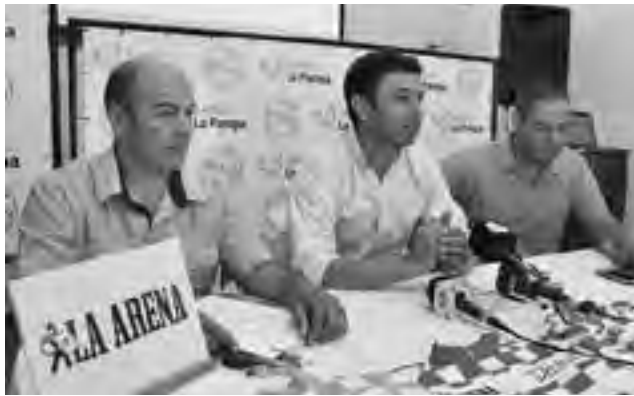
La competencia es auspiciada por el Diario La Arena.