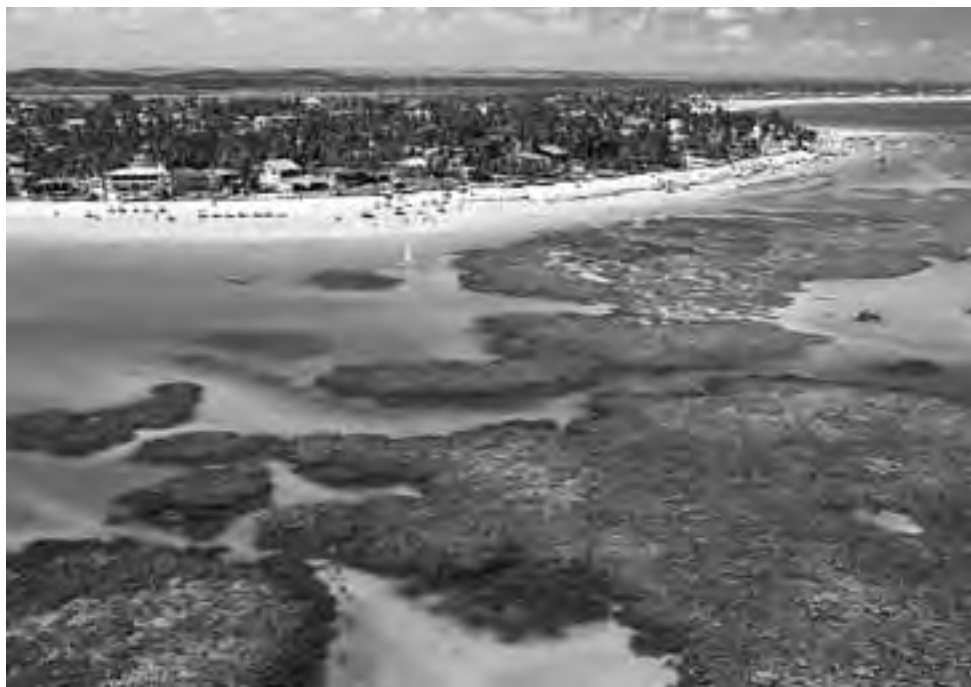
Porto de Galinhas logró un reconocimiento internacional por viajeros de todo el mundo.