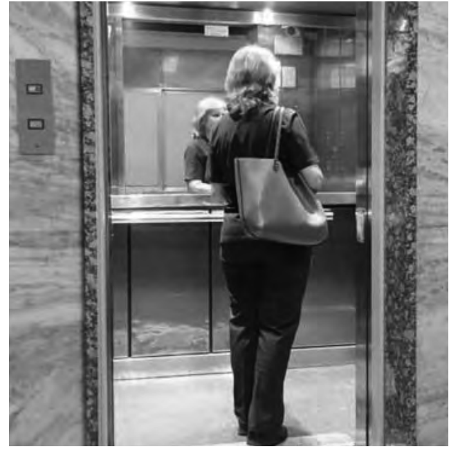
Una sonrisa o un breve saludo en un ascensor, además de ser un signo de cordialidad, puede aliviar la tensión que el viaje de ascenso o descenso generaría en una persona con claustrofobia.

Para sacar de la olla a los ñoquis bastará que en cada repartición pública, sea nacional, provincial o municipal, se entregue a cada empleado una planilla que tenga las características de declaración jurada de los firmantes, en la cual se advierta de las consecuencias legales de la falsedad en su llenado. En dicha planilla cada titular deberá indicar, además de todos sus datos personales completos, el lugar físico donde desarrolla sus tareas, con indicación de piso y ámbito laboral, detalle y fecha de la última tarea administrativa hecha, indicación de los nombres y apellidos de sus jefes inmediatos de los cuales reciben órdenes