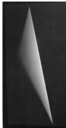
James Turrell Reflective Hologram XXXC, 2010

Hasta el domingo 13 de marzo podrá apreciarse la exposición Obsesión Geométrica. American School 1965-2015. Medio siglo de arte geométrico estadounidense en el MACBA Museo de Arte Contemporáneo de Buenos Aires, Av. San Juan 328, Buenos Aires.