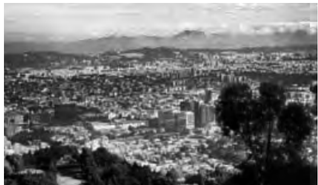
Bogotá, la capital de Colombia, es una ciudad cosmopolita donde las modernas edificaciones y avenidas contrastan con su tradicional centro histórico.

Bogotá, Colombia - Vitrina Turística Anato. Brindará a los agentes de viajes herramientas para que como expositores presenten sus servicios o productos turísticos, o bien como compradores puedan conocer, promover y comercializar las ofertas que cada año se presentan en este foro. (Hasta el 26/02/16) Informes: www.vitrinaturisticanaato.org