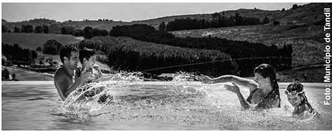
Es importante la supervisión de los adultos cuando los chicos están disfrutando de la pileta o cualquier otro lugar de esparcimiento para evitar situaciones de riesgo.

• La mujer embarazada debe extremar los cuidados antes de exponerse al sol, utilizando protectores solares con un índice de protección mayor a 30. Éstos ayudan a disminuir la aparición de manchas en la piel que suelen producirse durante la gestación -melasma/cloasma, hiperpigmentación que se ubica más frecuentemente en pómulos, labio