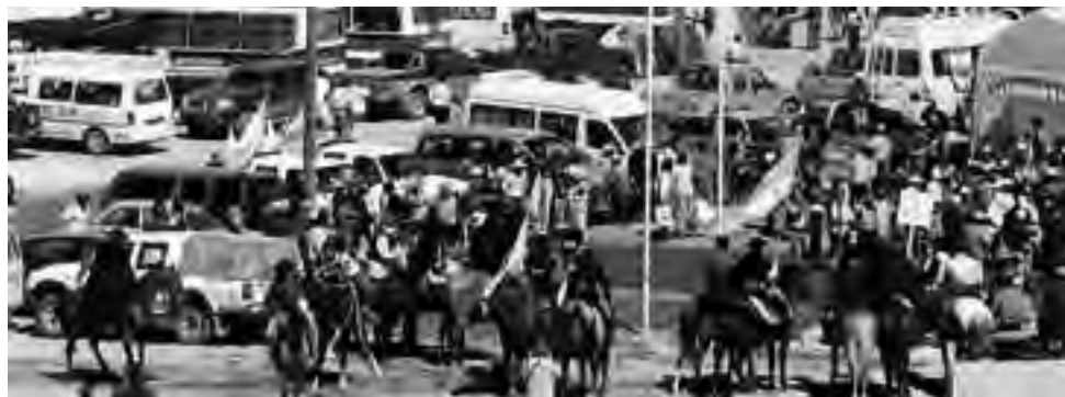
Tradicional encuentro binacional que se realiza anualmente en el Paso El Pehuenche

Para mejor, alguien desde el sector oficial propuso que tras el cierre de más de dos días que llevó el paso binacional Libertadores/Cristo Redentor, el más transitado del país con un promedio de circulación de 10 mil personas por día, aconsejaron