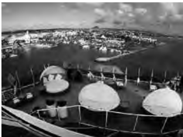
El recorrido incluye destinos de gran belleza e interés.

El barco, de 14 pisos -o decks-, cuenta con tres cuerpos de varios ascensores cada uno, pesa 74 mil toneladas, mide 264 metros de largo y puede albergar en sus 1.304 camarotes a 2.744 pasajeros más los necesarios 858 trabajadores