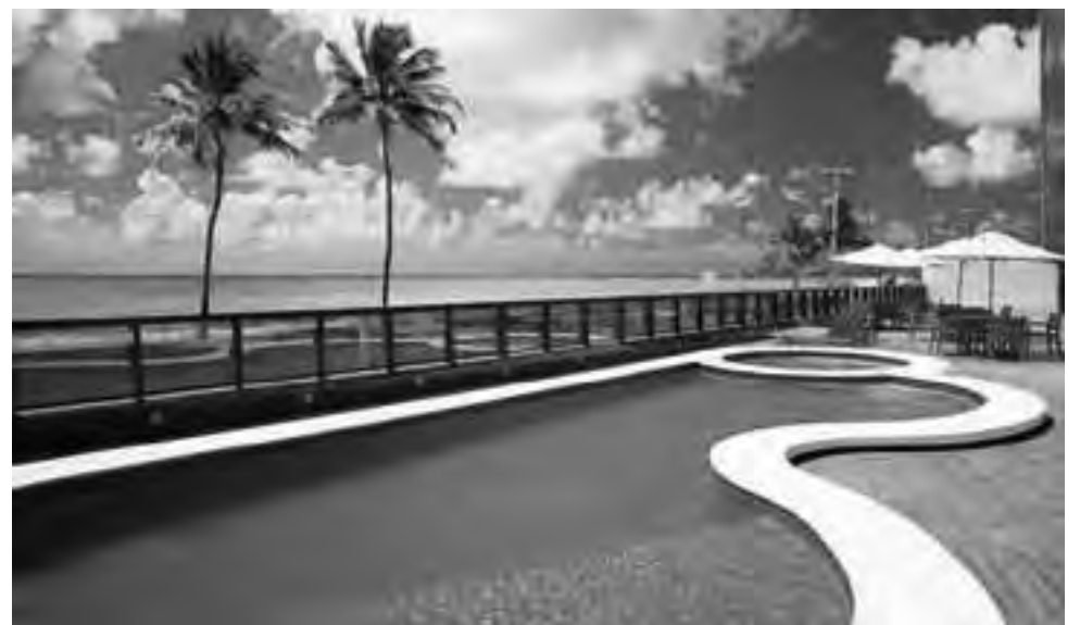
Ritz Suites: http://www.ritzsuites.com.br/

El Ritz Suites se sitúa en el centro del sector turístico de la ciudad. El hotel posee una arquitectura moderna, piscinas para adultos y niños, sauna, gimnasio, centro de eventos, estacionamiento privado, generador central, banda ancha y wi-fi en todas las habitaciones, bar y restaurante con la mejor cocina regional. El gran diferencial que ofrece Ritz Suites son sus habitaciones completamente equipadas con todas las comodidades, pensadas tanto para familias como para los ejecutivos más exigentes. Por otra parte, para aquellos que planean estadías más largas, posee habitaciones equipadas con cocina.