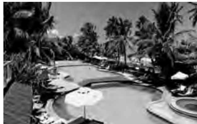
Ritz Lagoa da Anta: www.ritzlagoadaanta.com.br

En sentido opuesto, el vuelo 7620 se realizará los sábados desde Buenos Aires con salida a las 23:00 y llegada a Recife a las 04:30. Al igual que el vuelo 7621, el avión