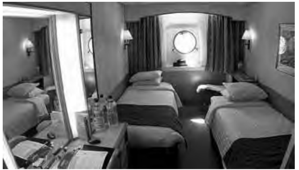
Desde el camarote más sencillo, se aprecia un completo equipamiento.

El Monarch de Pullmantur, navega con una variedad de comodidades de alta tecnología de la marca, que lo mantendrá entretenido de día y de noche. Con spa, gimnasio, pista para correr al aire libre, clases de aeróbicos y un menú completo de tratamientos relajantes. Pruebe sus habilidades deportivas en la pared de escala o en la cancha de baloncesto al aire libre. La atmósfera elegante de los dos comedores principales es ideal para un desayuno tranquilo o una cena gourmet. Disfrute de la inigualable diversión nocturna que incluye deslumbrantes producciones musicales ( diariamente dos funciones en el Teatro Broadway del barco ), un animado y completo casino con tragamonedas y bingo, varios clubes y salones, que sumado a los distintos bares y pianos bar