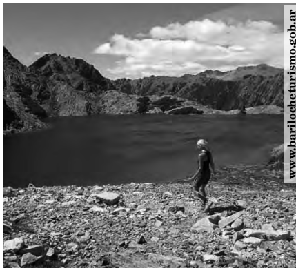
Lugares tradicionales de turismo invernal como la ciudad de San Carlos de Bariloche, Río Negro también ofrecen alternativas para los meses de verano

Hasta 1970, en Argentina, con dos meses de ocupación plena los hoteleros vivían bien todo el año y ahora, ni se justifica iniciar el proyecto de una inversión en un centro turístico donde no sea demostrable la posibilidad de un mínimo de 100 días de uso al ochenta por ciento de ocupación. Antes venían menos visitantes, y por ello no se necesitaban las costosas inversiones públicas que en un mercado receptor orientado a la cantidad son imprescindibles. También la rentabilidad social requiere unas ocupaciones medias mensuales suficientes para poder mantener una ocupación en puestos de trabajo en alguna medida estables, ya que, de lo contrario, cuando otros mercados más regulares necesitan personal, se produce un trasvase hacia ellos, dejando al sector turístico de esos centros o comarcas sin trabajadores, con el mínimo estándar de calidad y profesión demostrable.