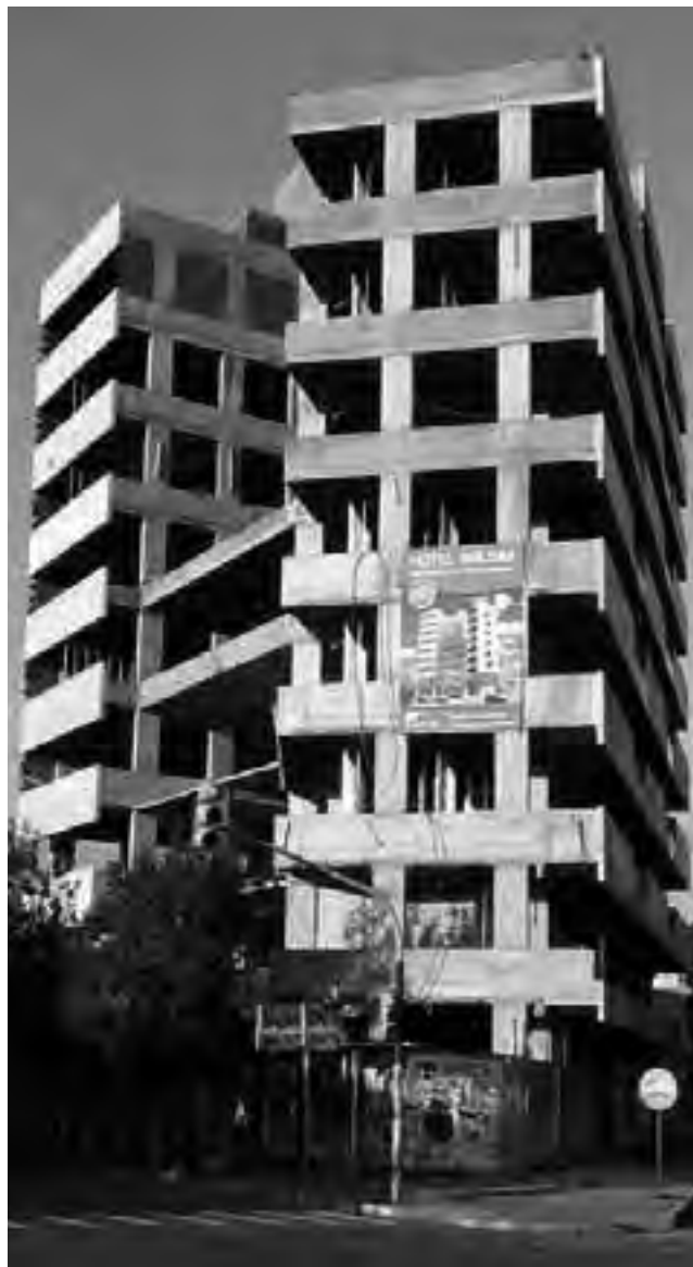
Estado de obra al 11 de febrero de 2016.

caracterización de dichos accesos, se opta por seccionar una porción de edificio existente, jerarquizando y redirigiendo la circulación del peatón, invitándolo a ingresar en un espacio que, por la libertad y transparencias de su fachada de vidrio, desarrolla una fuerte permeabilidad visual, colaborando así con la apertura y la amplitud que conciben un nuevo estado perceptivo del mismo, mostrando en consecuencia su ubicación privilegiada.