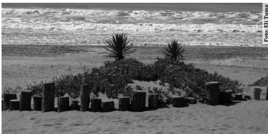
Clásicos destinos turísticos de Sol y playa como Pinamar hoy ofrecen otros atractivos como los deportes náuticos y de aventura para atraer visitantes durante todo el año.

La ruptura de estacionalidad aportará, entre otros beneficios: