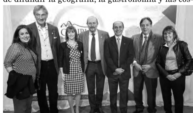
Encuentro en la presentación de #ExperienciaChubut en Buenos Aires de operadores y representantes del sector turístico

CAMINATAS POR LA INFANCIA El domingo 12 de junio, a las 9, se realizará un recorrido por Interlagos, encuentro en Olleros y Libertador. Los participantes podrán llevar alimentos no perecederos y ropa que se destinarán a hogares de niños. Informes: ☎ (011) 15-4436-7136