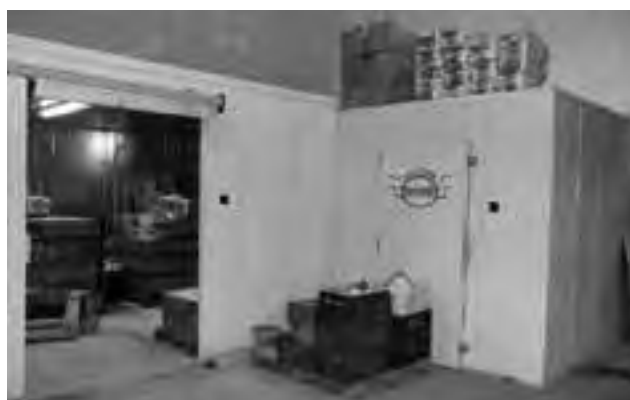
El Centro de Distribución cuenta con un depósito de mercaderías con cámaras frigoríficas de 850 m2.

"A los productos lácteos anexamos los fiambres -nos cuentan los titulares de la empresa-, y así hace 15 años atrás comenzamos con venta al público, hasta alcanzar hoy cinco puntos de venta,