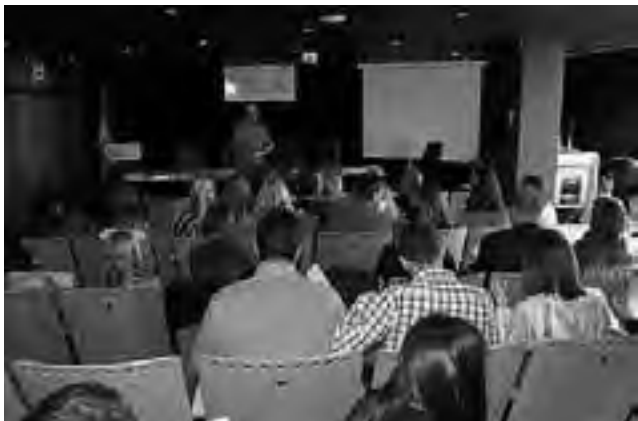
La Agencia Federal de Inversiones invitó a Nación y las Provincias para presentar proyectos de inversión y con ayuda de la agencia, captar inversiones.

La jornada sobre "Formulación de Proyectos de Inversión Turística y Herramientas de Apoyo", se llevó a cabo en el Ministerio de Turismo de la Nación, estuvo a cargo de la Subsecretaría de Inversiones Turísticas y se trabajó sobre la Inversión Pública y Privada para el Sector Turismo.