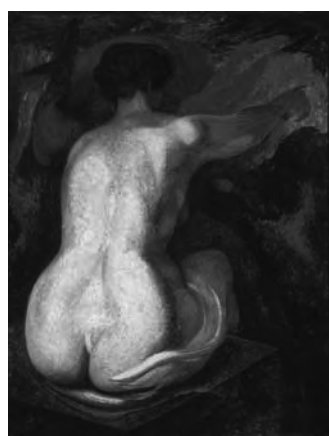
Desnudo - La Guitarra - (1946) de David Alfaro Siqueiros

Continúa hasta el 7 de agosto, la exhibición que reúne obras de los artistas Clemente Orozco, Diego Rivera y David Alfaro Siqueiros, acompañada de charlas, talleres y recorridos guiados, con entrada gratuita, en el Pabellón de exposiciones temporarias del Museo Nacional de Bellas Artes, Avenida del Libertador 1473, Buenos Aires. Puede visitarse de martes a viernes de 11.30 a 19.30; sábados y domingos de 9.30 a 19.30.