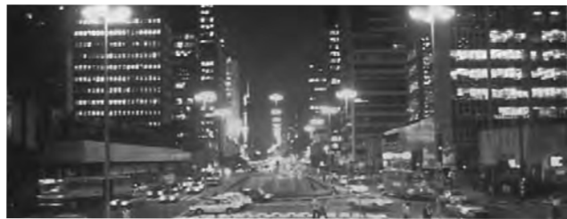
São Paulo, al sureste de Brasil, ha tenido un rápido crecimiento de su población desde la década de 1920 hasta convertirse en la actualidad en la ciudad más grande de América del Sur.

(Hasta el 14/7) Informes: www.expoelevador.com.br