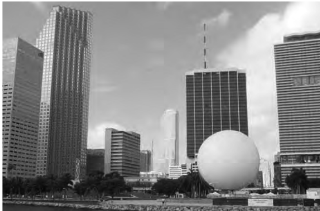
Miami combina negocios y descanso para el viajero

(Hasta el 4/8) Informes: http://www.fimeshow.com/