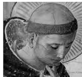
Canonización del Cura Brochero, Lourdes y Milagros Eucarísticos italianos