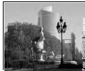
Los ángulos de Buenos Aires Monumento a los guardacostas Costanera Sur

Buenos Aires, República Argentina - Miércoles 8 de junio de 2016 - N° 1519 - Año XXXI