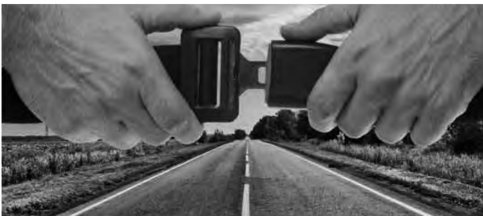
Desde el próximo viernes 17 y hasta el lunes 20 inclusive, habrá un nuevo y atípico "Súperfinde turístico" en Argentina. Tome todas las precauciones necesarias si sale a la ruta.

El próximo fin de semana del viernes 17, sábado 18, domingo 19 y lunes 20 de junio, será un "súper fin de semana largo" bastante atípico.