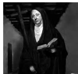
Beatificación de M. Antonia de Paz y Figueroa (Mama Antula)

Como nos dice Francisco, peregrinar es hacer un camino de renovación interior hacia Cristo.