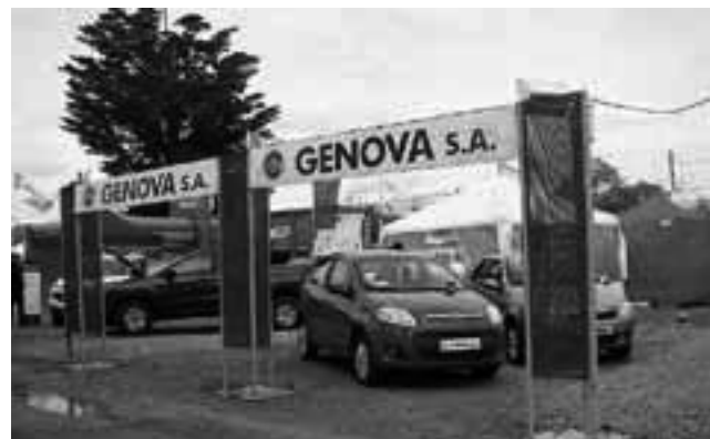
Stand de "Génova Automotores", concesionario Fiat.