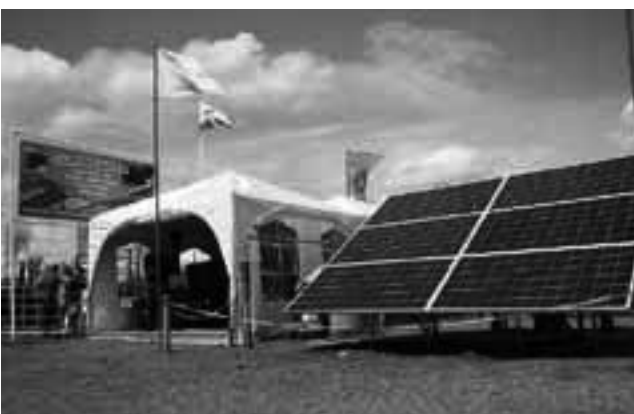
2º Premio mejor stand Industria para "Aguadas Alomar".