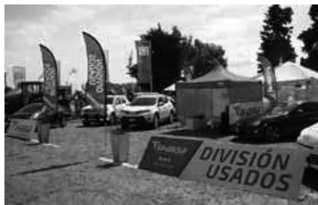
1er Premio mejor stand Comercio para "BHASSA".