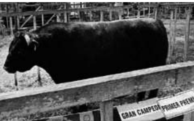
Como es habitual, hubo excelentes ejemplares bovinos.