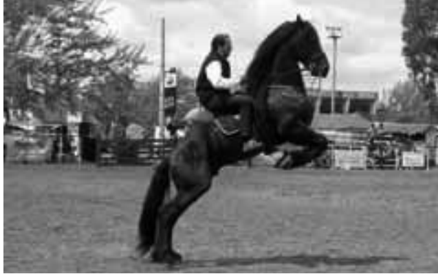
Los equinos cada año van tomando mayor protagonismo en la Expo de Santa Rosa. Esta vez acaparó la atención un Frizón negro de la Escuela de Equinoterapia "El Zorzal", no solo por su belleza, sino por la ductilidad en la tarea.

La lluvia -tan esperada por el sector-, dificultó la normal actividad de la 90ª Expo anual de Santa Rosa, especialmente el viernes en el ingreso de animales, la jura y la instalación de los stands. Afortunadamente mejoró el clima luego y hubo excelente participación el fin de