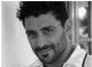
-Dom. 9 a las 20 y a las 22:30 hs: el bailarín Hernán Piquín presenta "Let it be... una historia

-Vie. 7 a 19:30 hs: transmisión en vivo de la ópera MACBETH de Giuseppe Verdi, desde el Teatro Colón. Gratis. -Vie. 7 a las 19:30hs: inaugura 1ra Exposición Nacional de Ilustración Científica. En Sala Di Nardo. Gratis -Dom. 9 a las 19:00 hs: Cuentos y Poesías de autores pampeanos. • Teatro Español: H. Lagos 44. -Vie. 7 a las 21:30 hs: Grupo danzas Mamüll Papu. $ 60. -Sáb. 8 a las 21 hs: musical Le Tour de la Danse. $120