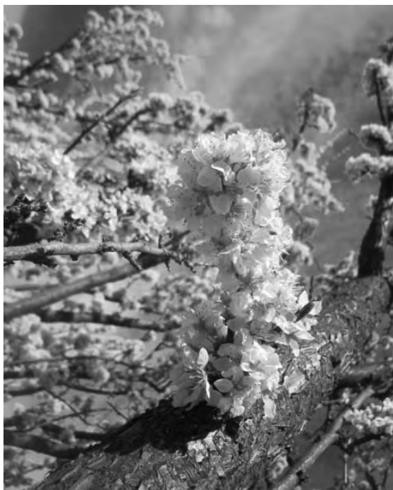
La flor del cerezo es un espectáculo efímero y puede ser de diferentes colores y tonalidades.

Este atractivo que solo ocurre en primavera y en el mes de octubre en nuestro país, es un gran espectáculo a los ojos de quien se detiene a observar la belleza de cada árbol vestido de blanco, anunciando después el fruto más emblemático y esperados por sus pobladores y por todo aquel que visita cada año, este maravilloso lugar. En los países del Hemisferio Norte también se da este espectáculo natural, en los meses de marzo y especialmente en abril, en Estados Unidos o España y principalmente en Japón. En este último país es la celebración más importante del año llamada Hanami.