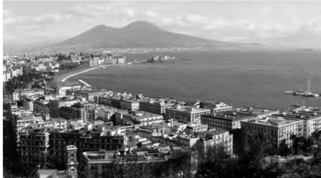
Nápoles, ciudad al sur de Italia

Nápoles, Italia - MITM Euromed. Foro interactivo de dos días donde programan citas con oficinas de turismo, hoteles, transportistas y proveedores de turismo de todo el mundo. (Hasta el 4/11) Informes: www.mitmevents.com