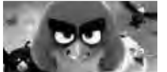
Viernes 14/10 19:00hs Miércoles 19/10 19:00hs