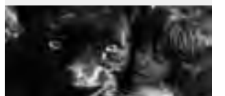
Viernes 14/10 21:00hs Lunes 17/10 21:00hs