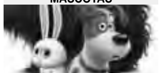
Domingo 16/10 19:00hs Miércoles 19/10 21:00hs