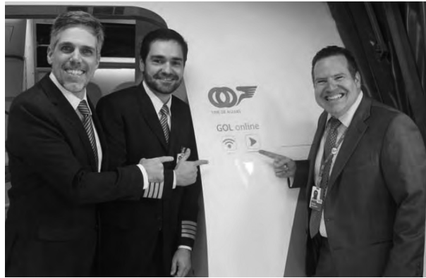
La aerolínea GOL ofrece en sus vuelos servicio de internet en pleno vuelo

El servicio será gratuito durante seis meses. Se notificará a los pasajeros cuando sus vuelos se encuentren programados para ser operados por aviones con internet a bordo. www.voegol.com.br