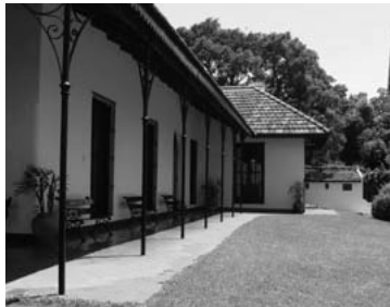
Quinta Los Ombúes, San Isidro

El Centro de Guías de Turismo de San Isidro programó para el mes de octubre una serie de interesantes visitas: El sábado 22, a las 16 Vidas y retratos II: Mujeres de esta casa . Con un recorrido destacando a los personajes femeninos ligados a su historia. La visita es a pie y gratuita. Concurrir a la quinta Los Ombúes . Calle Adrián Beccar Varela 774, San Isidro.