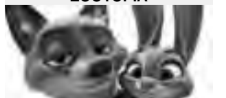
Sábado 15/10 21:00hs Martes 18/10 21:00hs