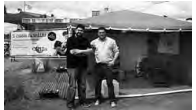
Como siempre, fue participe de la Expo la Obra Social del Personal de Imprentas, Diarios y Afines (OSPIDA), presente con su stand promocionando el Salón de Eventos.

Una vez más la Asociación Agrícola Ganadera de La Pampa desarrolló el primer fin de semana de octubre su Expo Rural, que este año fue la edición Nº 90.