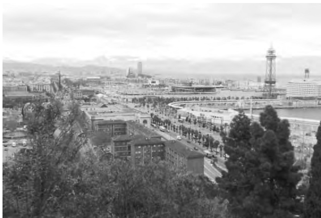
Vista de la ciudad de Barcelona, España situada a orillas del Mar Mediterráneo.

Barcelona, España - Hostelco 2016. Salón líder a nivel nacional y referente europeo, con nuevas oportunidades de negocio: acceso a nuevos compradores nacionales e internacionales. (Hasta el 26/10) Informes: www.hostelco.com