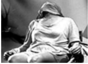
Sáb. 15 a las 21:30 hs: Obra "La Culpa es de Ana Laura... Deberías saber por qué...". Gratis.

-Sáb. 15 a las 23:30 hs: música popular con Palito Ortega. $ 100. • 80restobar: San Martín 264 - Sáb. 15 a las 23 hs: música de los 80&90 con "La Morocha". -Dom. 16 a las 23 hs: Show en vivo "Día de la Madre". • Castelvechchio: Palacios 300