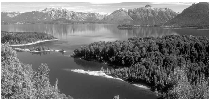
Las bellezas y los atractivos de un lugar, como la isla Victoria en el Parque Nacional Nahuel Huapi, en la provincia de Neuquén, requieren del trabajo multidisciplinario de profesionales para obtener una calidad del servicio que permita retener al turista.

La economía , el impacto económico del turismo al ser esa consecuencia la de mayor identificación histórica , revalorizada a partir de los años 70 con la aparición del turismo de masas; actualmente se le reconoce en lo global su condición de primer cuenta económica del comercio del Planeta , con incidencia en las balanzas de giro en los presupuestos de los países. El estudio de esta actividad ha dado el surgimiento de la Economía Turística , como rama especializada de investigación.