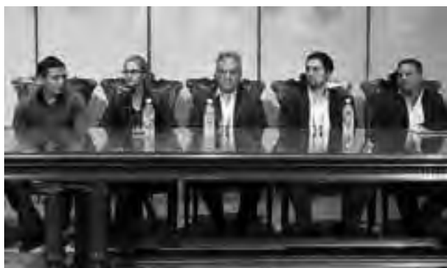
Los vuelos son de domingo a viernes, saliendo de Santa Rosa a las 06:05 y regresando de Buenos Aires 22:05 hs.

Tal como lo habíamos anticipado, la empresa estatal Aerolíneas Argentinas presentó sus nuevas frecuencias para la ciudad de Santa Rosa y las promociones vigentes, que aparentemente se extenderían hasta fin de año.