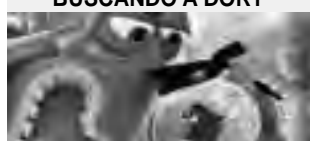
Martes 18/10 19:00hs