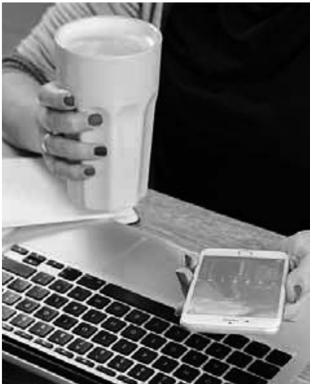
8 de cada 10 argentinos afirma que contar con un espacio de distensión en el trabajo mejoraría su rendimiento laboral

El deporte es la actividad elegida por el 33% de los encuestados para despejar la mente del trabajo, mientras que un 20% prefiere charlar con colegas o amigos y otro 20% escuchar música. Otro 12% se despeja con un libro, un 9% prefiere una infusión para relajarse y un 6% afirma