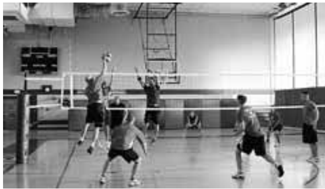
El estudio reveló que el 33% de los encuestados elige hacer deporte para distraerse de su jornada laboral.