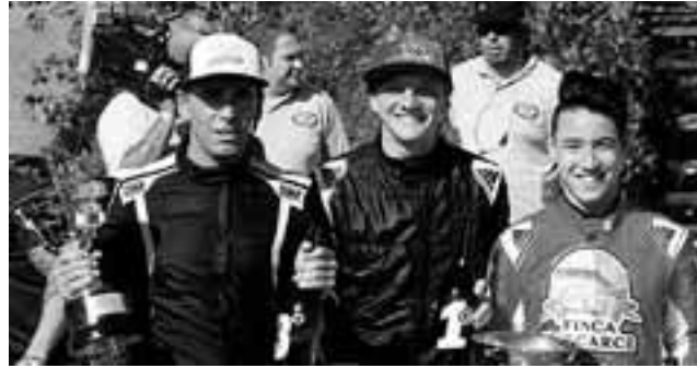
Podio de TCM en La Plata. Pilotos jóvenes que andan a fondo y prometen un excelente espectáculo.